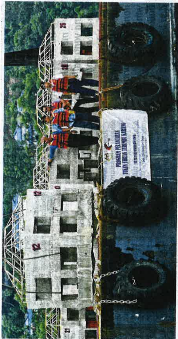
Bakri melihat proses melabuhkan tukun tiruan konkrit terumbu karang di Port Dickson.