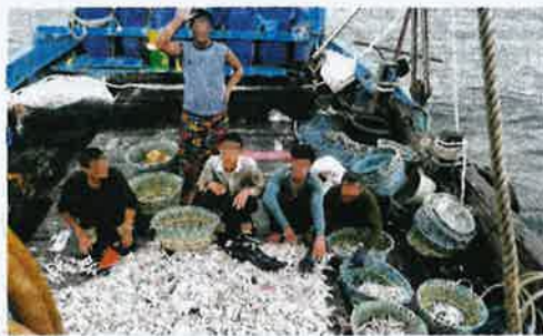
Lima nelayan warga Myanmar ditahan bersama tangkapan kelmarin.

"Ketika bot peronda melakukan operasi rondaan Ops Pertiwi di sekitar perairan Pulau Pinang telah mengesan sebuah bot nelayan tempatan kelas C melaku-