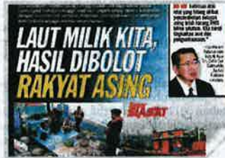
Keratan Sinar Harian semalam.

mendapat tempat dalam kalangan orang muda di negara ini.