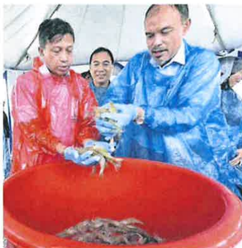
慕尼尔（左）和再努丁冒雨前往养殖区，了解白虾养殖法。

及农基工业部长拿督沙拉胡丁与内政部长丹斯里慕尤丁联合召开记者会时透露，因为外国渔船入侵大马海域捕鱼，导致我国每年损失 60 亿令吉。