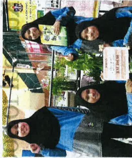
Ciptaan inovasi SK Gadong Jaya menjadi johan bersempena dengan Minggu Inovasi Peringkat Negeri Sembilan di Kuala Pilah, baru-baru ini.

Katanya, membina Porak-E juga mudah dengan menggunakan peralatan binaan yang mudah didapati dan senang untuk diuruskan oleh murid.