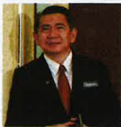
Kompen rasmi Salahuddin di Tanjung Plai amat dikesali.

Berdasarkan undang-undang, sememangnya tidak terdapat sebarang masalah untuk belia berpolitik. Namun yang dipersoalkan oleh orang ramai ialah niat