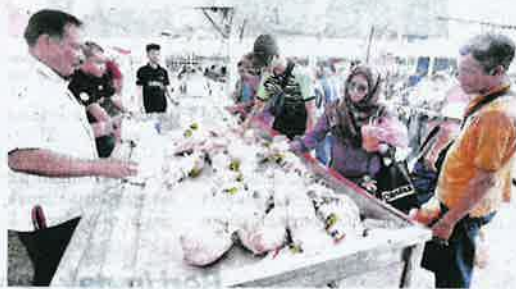
Pengunjung tidak melepaskan peluang membeli ayam yang dijual dengan harga RM6 seekor pada program Jalinan Mesra Peladang 2019 di Dataran Ilmu, Bandar Baru Selangor.

an dan Kemajuan Pertanian Malaysia (Mardi), hasilnya tidak digunakan dengan sebaiknya untuk dikomersialkan.