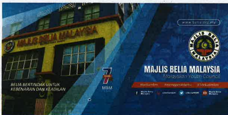
Kanapa peruntukan belia disalurkan melalui YPC, bukan melalui MBM.

Mereka juga kini tergamak pula menabur janji baharu kepada para pengundi di Tanjung Plai, sedangkan janji-janji lama mereka pun belum berjaya dilaksanakan lagi, apatah lagi untuk melaksanakan janji baharu.