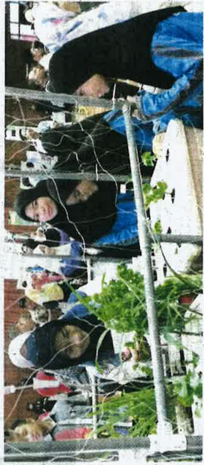
Murid SK Gadong Jaya memberi penerangan mengenai Sistem Porak-E Kreatif.