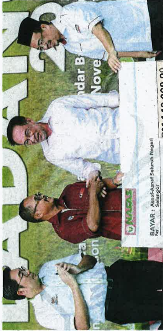
BAYAR : Anwar-Aznaf Seluruh Negeri Per Selangor

"Daripada memberi subsidi ke-pada syarikat besar, kita akan beri terus kepada petani dan peladang, supaya mereka boleh beli bara-ngan import seperti baja, racun dan sebagainya. Ini semua untuk