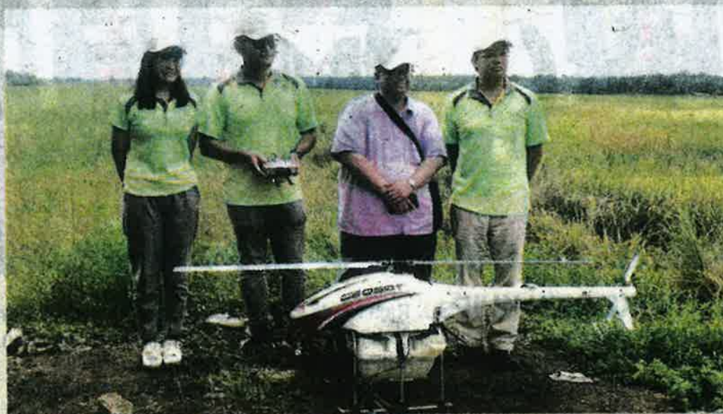
Penggunaan dron untuk penyemburan pertanian tanaman padi di Felcra Seberang Perak akan bermula penghujung November ini.

“Dengan ini, Felcra Seberang Perak yang merupakan estet padi pertama dan terbesar di Malaysia bakal melakar sejarah dengan penggunaan teknologi dron secara skala yang besar untuk penyemburan pertanian tanaman padi,” menurut kenyataan itu. - Bernama