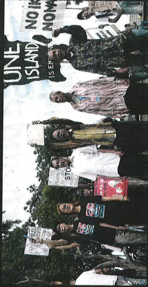
Nazri (tiga kanan) menunjukkan memorandum bantahan projek tambahan laut di selatan Pulau Pinang pada Hari Solidariti Nelayan di Padang Kota Lama, Georgetown baru-baru ini.

Meraka beriya menyelamatkan penyu itu. Ladi kawasan itu sememangnya sangat berharga bagi nelayan dan rakyat negeri ini," katanya.