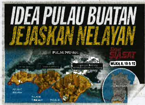
Laporan Sinar Harian semalam.

Antara syarat tersebut ialah pertanya kajian teknikal terperinci serta langkah mitigasi mengikut nasihat teknikal bagi menangani impak projek ke atas sumber perikanan dan komuniti nelayan.