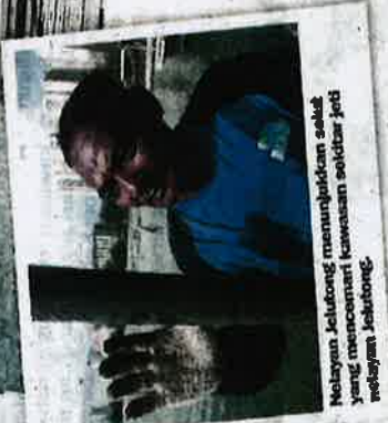
Nelayan Jelutong menunjukkan selut yang mencemari kawasan sekitar jeli nelayan, Jelutong.

"Ekoran itu saya sebagai nelayan muda memang tak setuju dengan projek PSR yang mahu dilaksanakan kerajaan negeri kerana ia akan menyusahkan lagi keadaan nelayan di negeri ini yang sudah sedia terhimpit," katanya.