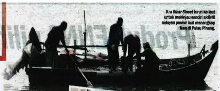
Kru Sinar Siasat turun ke laut untuk melihat sendiri aktiviti nelayan pesisir laut menangkap ikan di Pulau Pinang.

LAPORAN: ANITA ABU HASAN, RAIHAN SANUSI, SYAJARATULHUDA MOHD ROSLI dan RIDAUDDIN DAUD