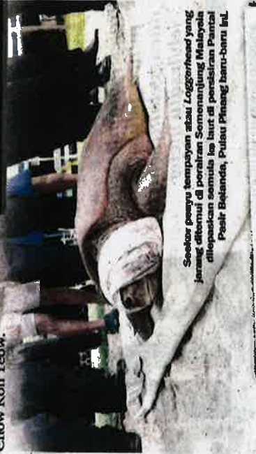
Seekor penyu tempayan atau Loggerhead yang jarang ditemui di perairan Semenanjung Malaysia ditandakan semasa lawatan di penapisan Pantai Pasir Belanda, Pulau Pinang baru-baru ini.