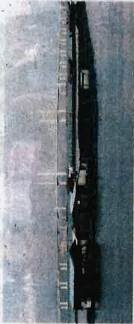
Industri penambakan ikan sangkar di kawasan pembangunan tiga pulau buatan di selatan Pulau Pinang. (dijangka terjejas dengan pembinaan tiga pulau buatan di selatan Pulau Pinang.)

"Projek mega ini dikhuatiri akan menyebabkan wujud dataran lumpur, merosakkan tempat penangkapan ikan seperti di Pulau Kendi, menjelaskan kawasan pendaratan penyu seperti di Pulau Kendi, Teluk Kumbang, Gertak Sanggul, Pantai Medan, Pantai