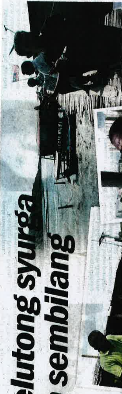
Projek penambakan laut menyebabkan kawasan perairan di Jelutong berselut.

"Kawasan ni ditambah dengan batu. Batu-batu yang berat bila tindih tanah di bawah yang lembut, selut akan naik ke permukaan tambakan batu hinggalah selut di kawasan ini sekarang sudah melebihi paras dada.