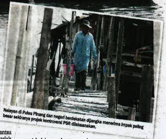
Nelayan di Pulau Pinang dan negeri berdekatan dijangka menerima impak paling besar sekiranya projek kontroversi PSR dilaksanakan.

"JAS bertanggungjawab memantau pematuan syarat yang dilaksanakan kerajaan negeri. Cadangan untuk mengetahui syarat-syarat ini dipenuhi, kerajaan