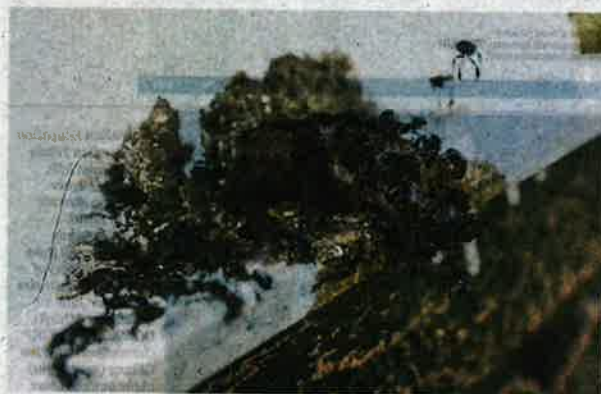
Natural honey contains nutrients which are essential to human body such as vitamins, minerals, antioxidants and organic acids.