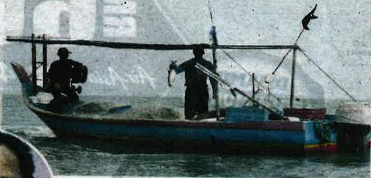
Seorang nelayan menunjukkan seekor ikan yang diperolehnya sewaktu menangkap ikan di perairan Pulau Pinang baru-baru ini.

PSR ini," katanya ketika dihubungi Sinar Harian .