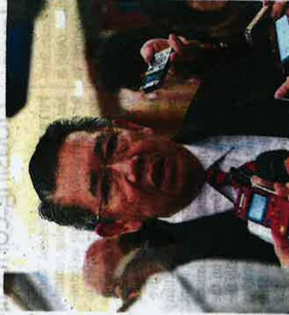
Datuk Seri Dr Wee Ka Siong highlighted the fiasco, asking Salahuddin to explain why he sought to award a RM1.4bil direct contract award to Nafas.