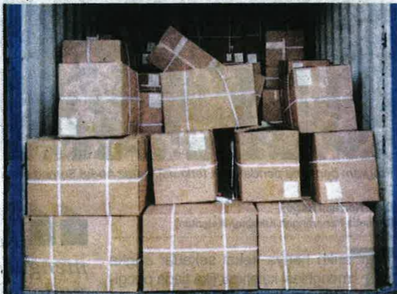
Produk perubatan dari China yang dirampas Maqis di Pelabuhan Klang Utara kelmarin.

Menurutnya, kegagalan pihak pengimport dalam mematuhi syarat yang dinyatakan di dalam permit import adalah menjadi satu kesalahan di bawah Seksyen 15(1) Akta 728.