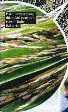
PADI hampa yang dijangkiti penyakit Hawar Bulir Bakteria.