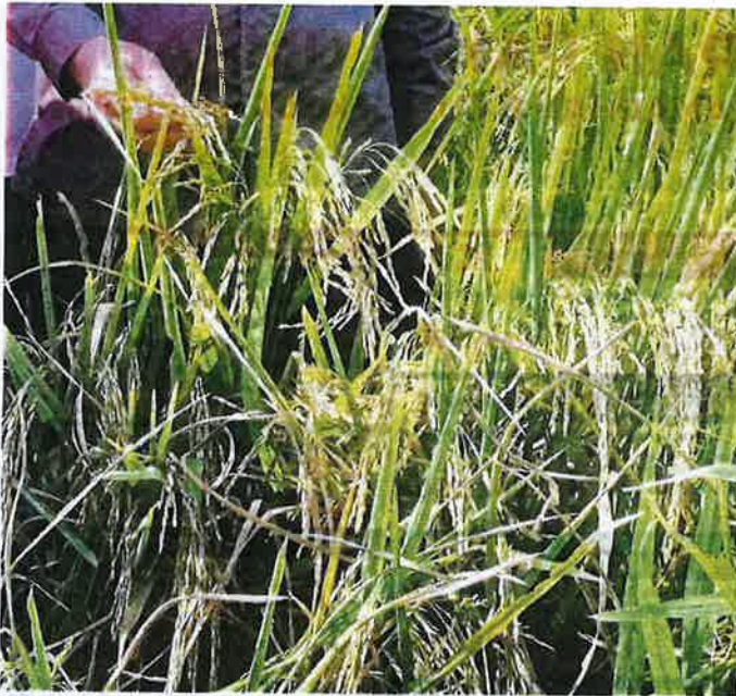
KEADAAAN sawah padi hampa atau tidak berisi.