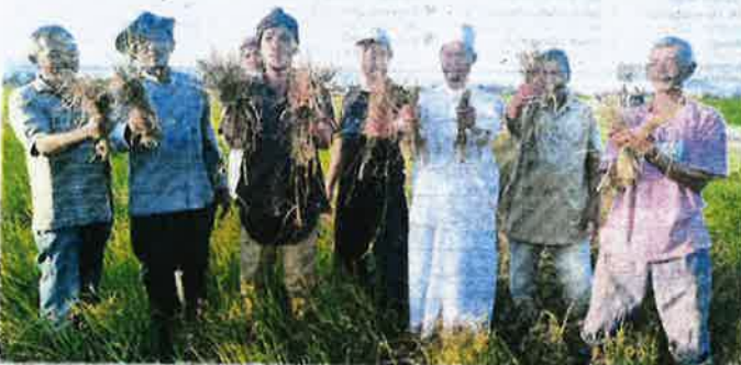
PESAWAH di Jeju Dalam menunjukkan tanaman padi yang musnah akibat tidak menerima bekalan air yang mencukupi.

Katanya, pihaknya mendapati masalah pengaliran berlaku di hulu dan hilir kawasan pertanian itu dan proses pengumpulan maklumat sedang dijalankan.