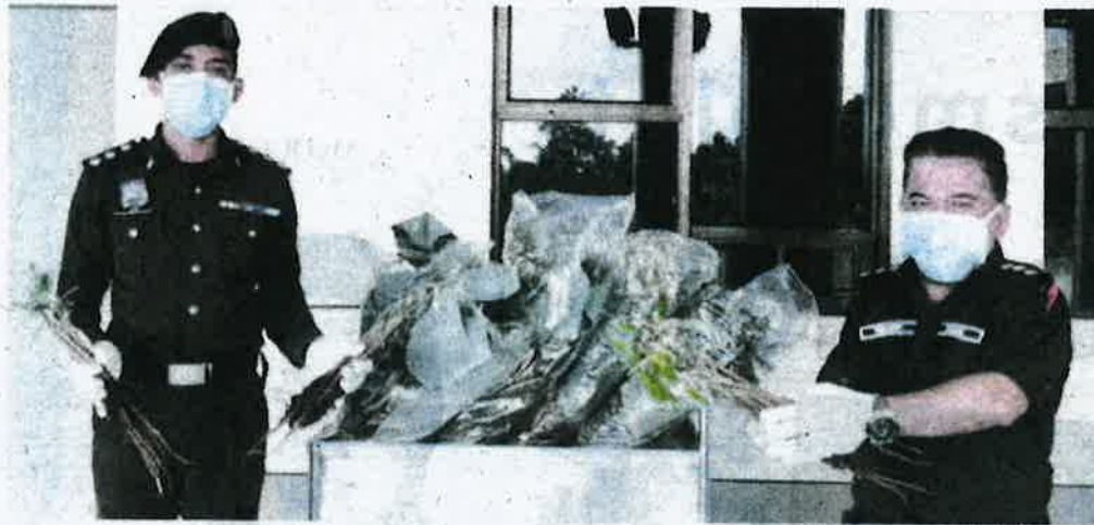
Kakitangan Maqis Kelantan menunjukkan anak benih pokok durian yang dirampas di ICQS Bukit Bunga Khamis lalu.

2,000 anak benih durian dirampas daripada seorang lelaki warga Thailand