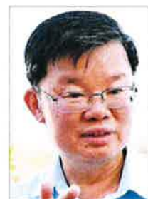
将逼近危险水平。无足够雨量，槟州水坝存水曹观友：一旦3月和4月仍

水源被过度使用，均将逼近危险水平。全球气候变化，导致去年没有足够雨量降槟，使槟州各水坝均没在踏入2020年时，水位达100%。