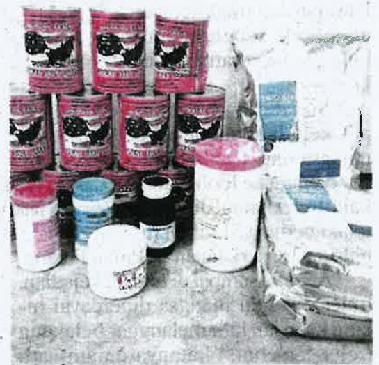
Antara makanan udang yang dibawa masuk dari negara jiran tanpa dokumen yang sah kelmarin.

“Perbuatan itu didapati salah di bawah Sekyen 11(1) Akta Perkhidmatan Kuarantin Dan Pemeriksaan Malaysia 2011 [Akta 728] yang boleh dihukum di bawah Seksyen 11(3),” katanya dalam satu kenyataan di sini semalam.