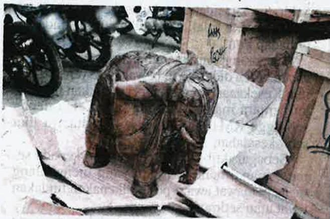
Tiga kotak kayu mengandungi ukiran patung gajah yang dibawa masuk menggunakan kapal tongkang dari Indonesia.

KLANG - Jabatan Perkhidmatan Kuarantin dan Pemeriksaan Malaysia (Maqis) Selangor menahan tiga kotak kayu berisi patung ukiran gajah dari Indonesia di pintu masuk Pelabuhan Klang Selatan di sini.