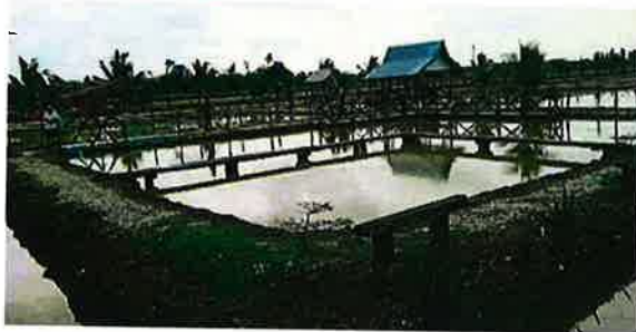
丹絨加弄農業科技展覽中心，除了可以感受到农村的风情，还可看見從遠處看不到的稻田，也可從中了解傳統稻米耕作过程。