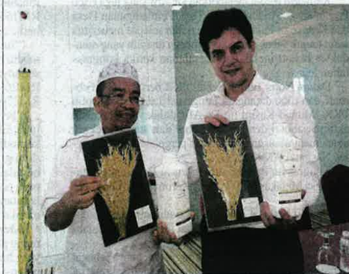
Phahrolrazi (kini) menunjukkan hasil padi yang ditanam menggunakan teknologi mikrob.

"Kita akan tinjau projek di sana untuk lihat potensinya. Di Kedah, plot percubaan diwujudkan di Sekolah Menengah Kebangsaan (SMK) Tajar sebanyak empat relung dengan tanaman tiga kali setahun," katanya.