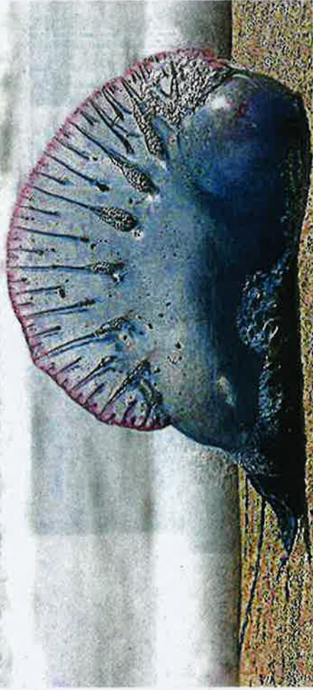
Pretty peril: The Portuguese man o' war jellyfish can sting even when its tentacles are detached.

The department anticipated the venomous jellyfish "season" to end by late March or early April when wind direction changes, he added. Those stung by this species should not apply vinegar as the stinging cells would continue to stimulate the toxin discharge and cause more pain, a doctor said. Seawater should