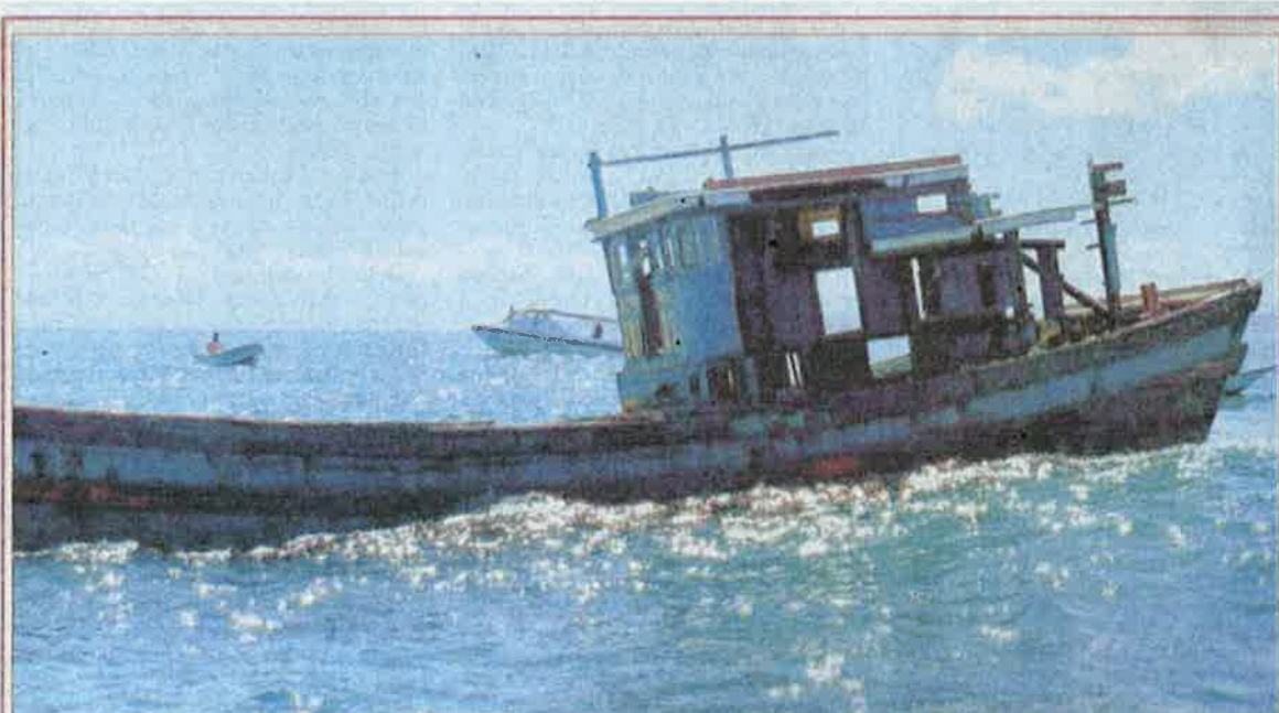
KAPAL nelayan Vietnam yang ditenggelamkan di Tompok Nosong, Kuala Penyu.