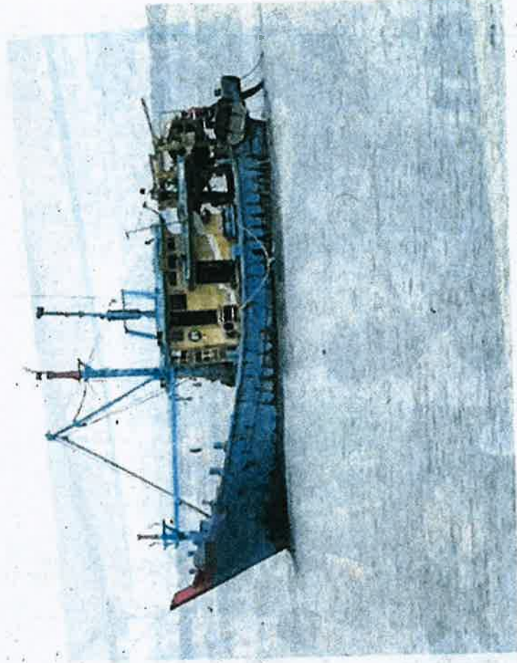
Sebuah bot tunda kelas B1 ditahan PPM dalam operasi di perairan Bagan Nakhoda Omar, Sabak Bernam, Selangor kelmarin.

Katanya, turut dirampas kira-kira 800 kilogram ikan pelbagai jenis bernilai RM8,000 dan siasatan dijalankan mengikut Akta Perikanan 1985.