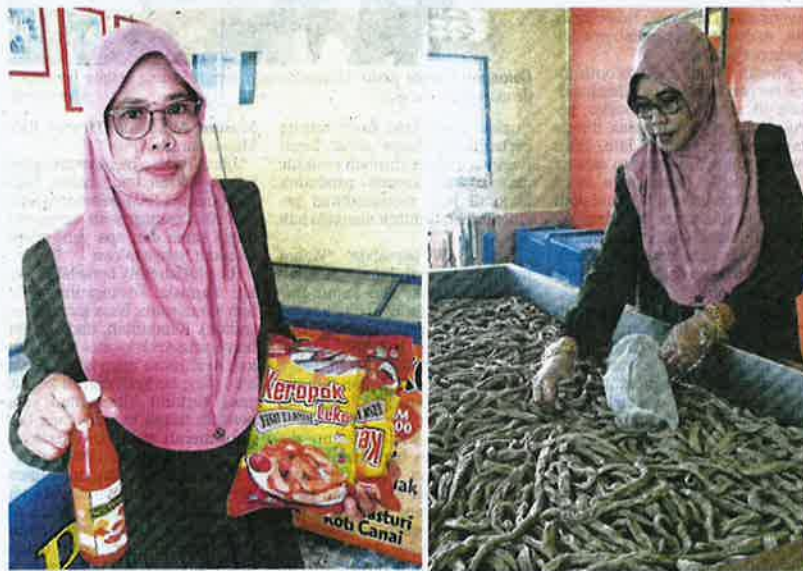
Yah menunjukkan produk keropok lekor dan sos pencicah yang belum dibungkus. (Gambar kanan) keropok lekor yang

Lantas, berbekalkan semangat dan minat mendalam wanita ceka itu yang dimulakan sejak 24 tahun lalu secara kecil-kecilan di rumah sambil dibantu anak, kini boleh dibanggakan sambil dibantu tujuh pekerja, selain anak, Mo-