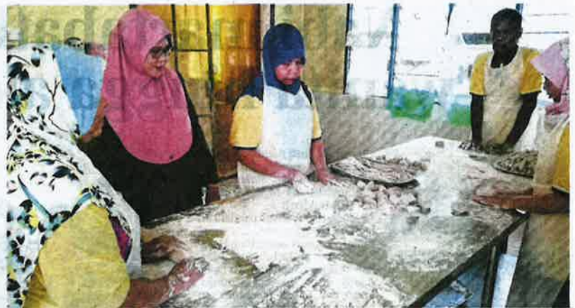
Yah bersama pekerja menjalankan perusahaan keropok lekor dan sos pencicah sejak 24 tahun lalu di bengkel pemrosesan di Kampung Pasir Pandak, Sitiawan, Perak.

"Saya mula menghasilkan keropok lekor selepas diberi sekeping kertas resipi daripada seorang pegawai Jabatan Perikanan,