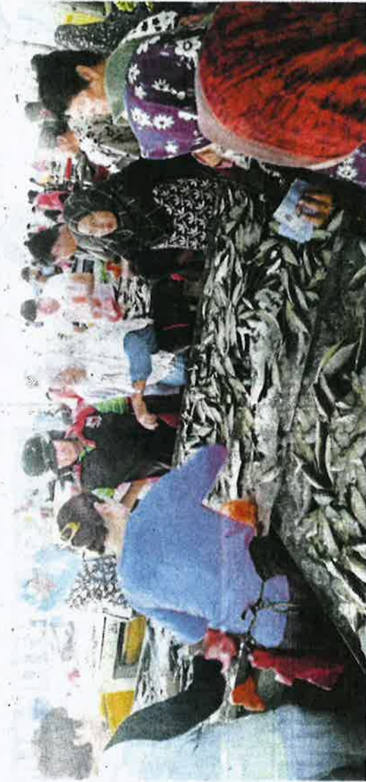
Orang ramai tidak melepaskan peluang membeli ikan kembung dan cencaru yang dijual antara RM2.50 hingga RM4 sekilogram di Pasar Awam Sekinchan, semalam.

"Saya jarang jual ikan kembung dan cencaru pada harga lebih murah kerana harga biasa sebelum ini mencecah hingga RM12 untuk sekilogram, malah, harga ini di-