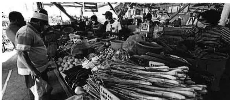
Pasar Besar Terkawal menjual barangan segar seperti sayur, ayam dan barangan runcit lain