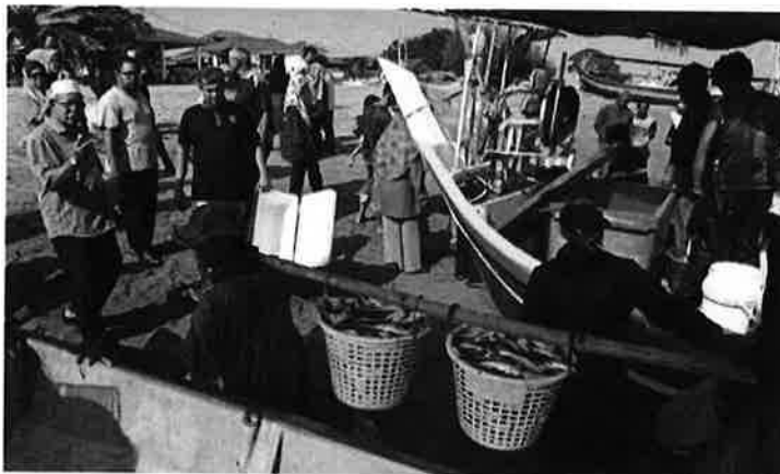
Marketgoers at the beach getting fresh mackerel. This event was before the movement control order was enforced.

He had just returned from Pulau Sanyk, less than 1km from the southern Kedah coastline.