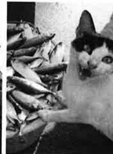
This basket of fish is all mine, claims a feline 'customer'.