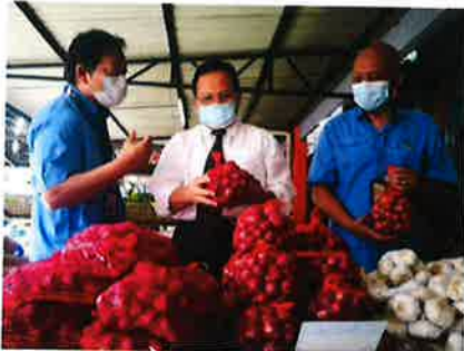
Ahmad (tengah) melihat produk jualan peniaga ketika melawat Pusat Operasi FAMA Puchong di sini hari ini.

PETALING JAYA - Sebanyak 97 lokasi Pasar Segar Terkawal (PST) diwujudkan di seluruh negara bagi menyediakan keperluan ke arah mensejahterakan rakyat sepanjang tempoh Perintah Kawalan Pergerakan (PKP). Timbalan Menteri Pertanian dan Industri Makanan I, Datuk Seri Ahmad Hamzah berkata, Lembaga Pemasaran Pertanian Persekutuan (FAMA) diperuntukkan untuk membuka 63 lokasi PST manakala Lembaga Pertubuhan Peladang (LPP) sebanyak 34 lokasi PST di seluruh negara.