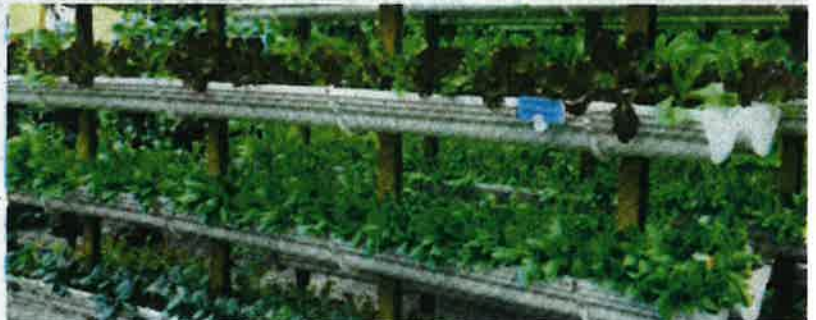
Pertanian menentang (vertikal) antara kaedah digunakan banyak negara bagi mengatasi masalah kekurangan tanah untuk bercucuk tanam.

Apa yang penting, semua perlu sederap melaksanakan transformasi bidang pertanian dan industri makanan supaya sektor agromakanan menjadi lebih moden, dinamik dan kompetitif.