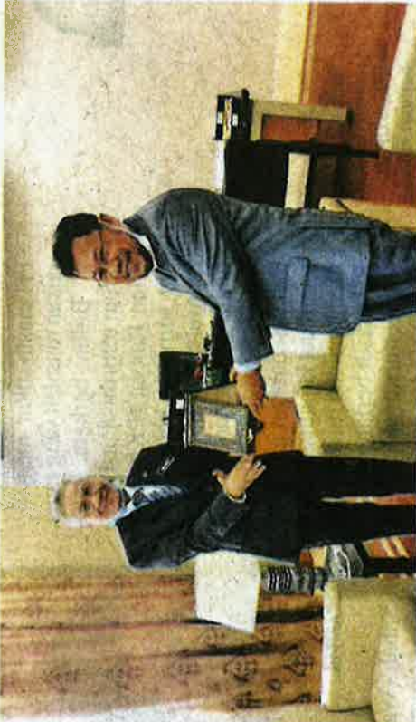
Timbalan Menteri Pertanian dan Industri Makanan II, Dato' Che Abdulah Mat Nawi melakukan kunjungan hormat ke Pejabat Timbalan Menteri Pengajian Tinggi, bagi membincangkan kerjasama yang boleh dilakukan antara Kementerian Pengajian Tinggi dan Kementerian Pertanian dan Industri Makanan untuk menggaitakan graduan berkecimpung dalam bidang pertanian.

Peranan dan tanggungjawab diperkukuhkan melalui jalinan serta usaha sama dengan pihak-pihak lain demi kemaslahatan rakyat Malaysia seluruhnya.