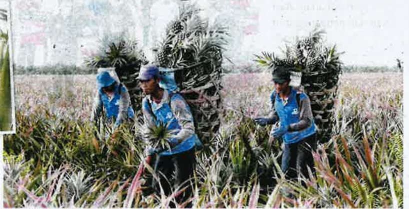
Pekerja Huay Heng sedang memetik nanas di ladang miliknya di Simpang Renggam, Johor.

Pemilik Jutawan Agriculture Products Sdn Bhd itu berkata, dengan bantuan Lembaga Perindustrian Nanas Malaysia (LPNM) kemudiannya diperkenalkan dengan pengimport pertanian dari Iran yang berminat mendapatkan buah