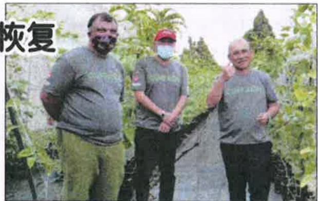
罗南建迪在 (右起) 在亚航集团执行主席拿督卡玛鲁丁和东尼费南德斯陪同下，巡视菜园的农作物成长情况。