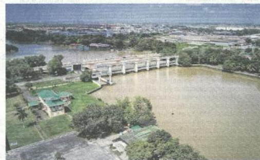
Ampang Jajar, Alor Setar.