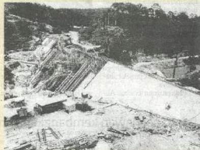
Empangan Muda dalam pembinaan pada tahun 1968.

Baki seluas 62,958 hektar kawasan dilaksanakan secara