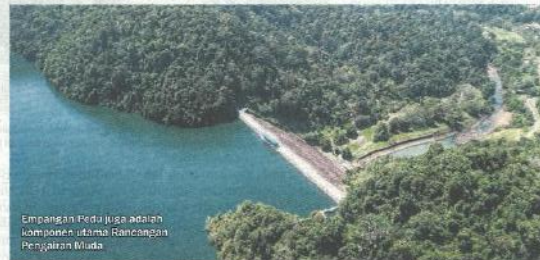
Empangan Pedu juga adalah komponen utama Rancangan Pengairan Muda.