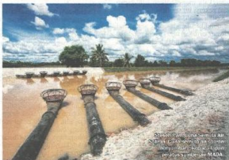
Stesen Pembina Semula Air Saliran Gura semula air saliran menyumbang kepada kemajuan pertanian MADA.