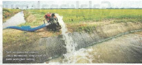
Pam bergerak digunakan untuk membantu pengairan pada peringkat lasteng.

Masalah yang timbul itu kemudiannya telah membawa kepada wujudnya Rancangan Pengairan Muda dalam Rancangan Pembangunan Malaysia Pertama (1965-1970) yang telah membawa perubahan kepada pesawah apabila mereka diperkenalkan dengan kaedah menanam padi dua kali setahun.