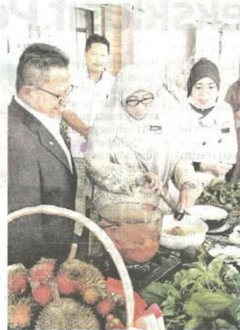
Isa (kiri) melihat Pengarah Jabatan Panyiaran Kedah, Rafiqi Othman menggalas nasi ulam sempena kempen 'Lebihkan Makan Ulam-Ulaman dan Sayur Tempatan' di Alor Setar semalam.

alan kepada 500,000 orang pengguna antara 18 Mac hingga 9 Jun daripada 300 peniaga di negeri ini. Buat masa ini, tiada