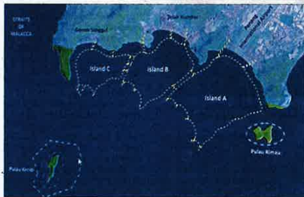
Draf lokasi tiga pulau buatan yang akan dilaksanakan di selatan Pulau Pinang.

"Peranan dan kemajuan Jawatankuasa Taskforce Nelayan yang ditubuhkan pada 2016 bertujuan menangani isu nelayan selatan-Pulau Pinang dan memastikan kebajikan mereka dijaga ketika projek PTMP dan PSR dijalankan. Selain itu, ia juga untuk memastikan projek