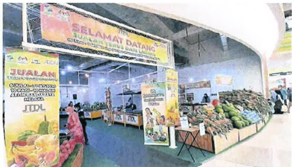
■设于柏灵玉永旺购物广场底楼的农场直销计划, 将于7月6日开始举行至10月7日。

新鲜且价格公道的蔬果, 消费者可以以比市价低价格购物, 同时也可协助本地农民增加收入。