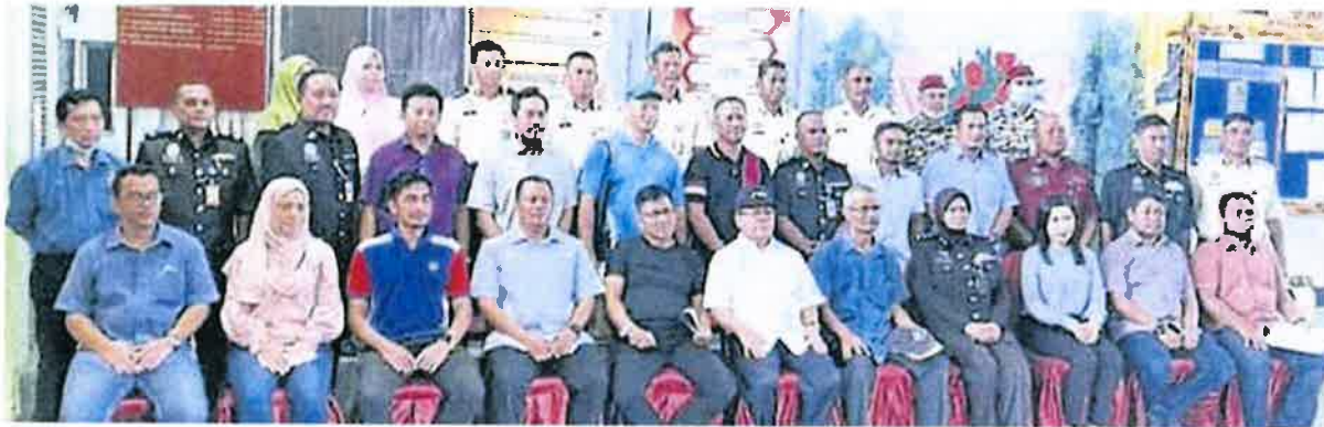
■ 阿末韩查（前排左6）访问力拔加央工业监狱。

（野新6日讯）农业及食品工业第一副部长拿督斯里阿末韩查日前访问野新力拔加央的工业监狱兼改造所，聆听监狱官汇报该中心的运作及为接受改造者所提供的农业与工业课程。