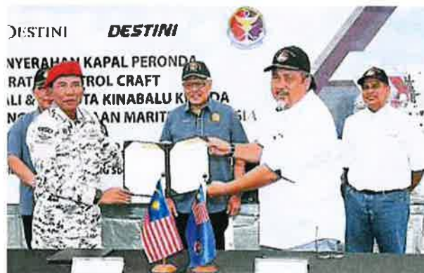
韩沙（后中）见证大马海事执法机构总监拿督莫哈末祖比尔海军上将（前左起）与造船厂董事经理拿督罗斯里交换巡邏舰交付协议。后左一为内政部长秘书拿督嘉米尔和造船厂董事拿督阿兹兹（右一）。