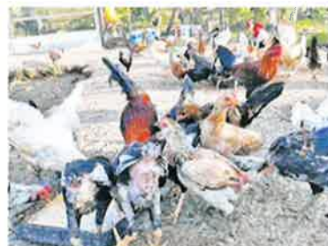
TERNAKAN AYAM... Antara ternakan yang popular di kalangan petani tempatan.