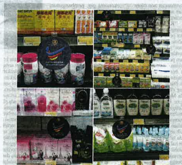
Barangan buatan Malaysia kualitinya terjamin, harga juga sangat berbaloi.

#barangbaikbarangkita #belanjauntukMalaysia #sokongprodukjenamaMalaysia