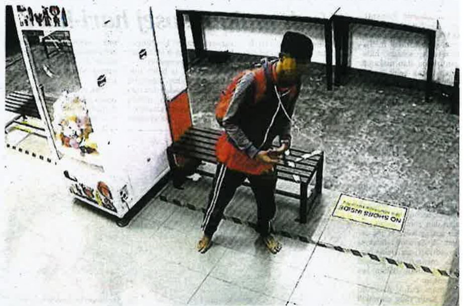
KEJADIAN 'melemas' tiga ekor kucing yang bertaku di sebuah kedai dobi layan diri di Kepong.

Katanya, selepas menjumpai lelaki itu, rakannya juga datang membantu dan membawanya ke rumah sebelum menghubungi pihak polis.