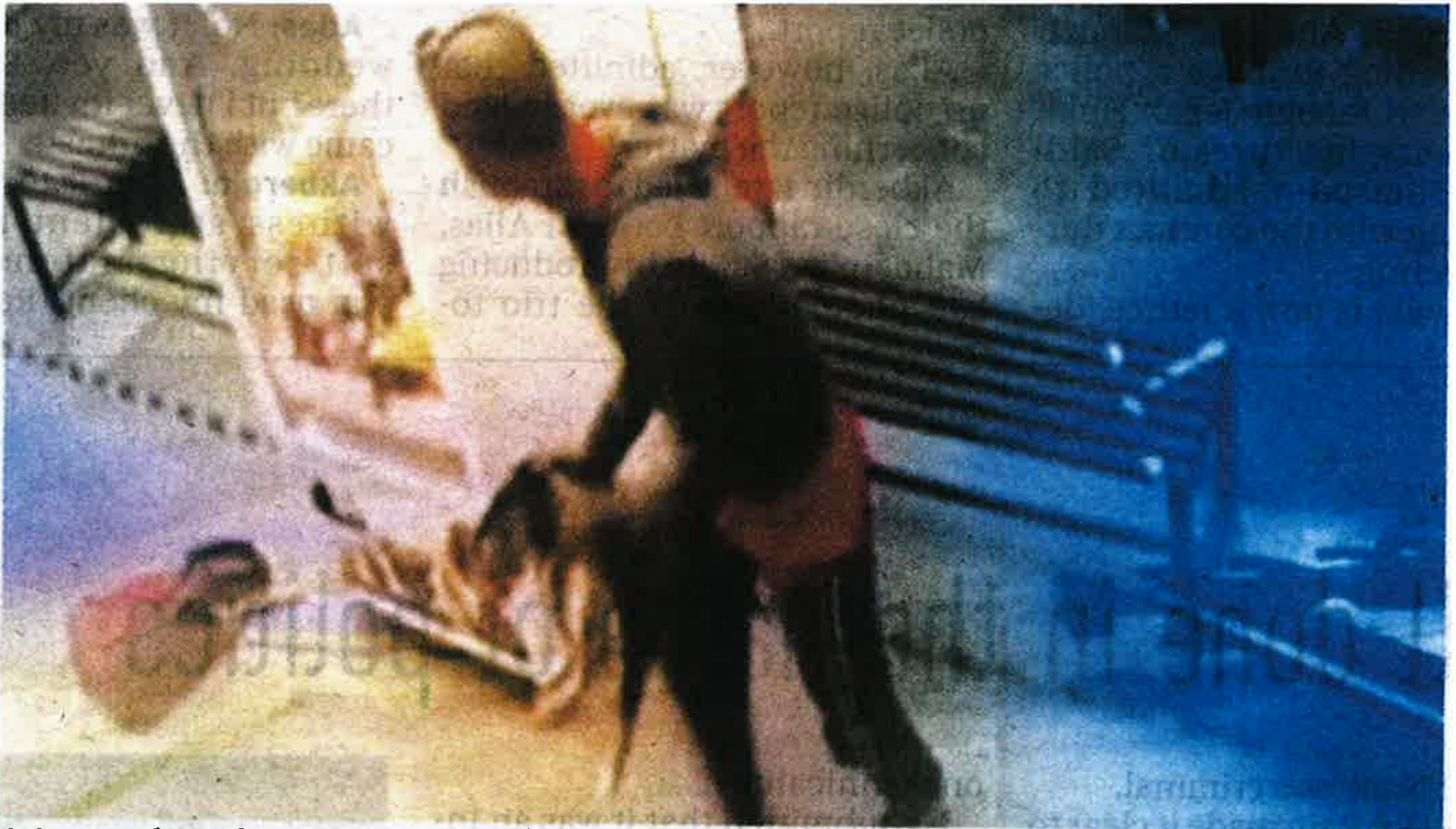
A screenshot of closed-circuit television footage of the man who allegedly killed three cats at a self-service laundrette in Kepong, Kuala Lumpur, on Sunday.