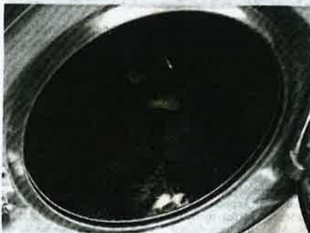
KEADAAN seekor kucing yang 'dilemaskan' lelaki tidak siuman.

Katanya, dia terkejut sebaik mendapati terdapat bangkai kucing di dalam tiga daripada kira-kira 10 mesin basuh yang dipasang di