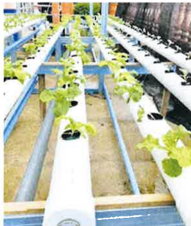
BIBIT KEJAYAAN... Sayur yang ditanam oleh salah seorang ahli GBHM.

GBHM adalah merupakan Kumpulan WhatsApp yang pertama seumpamanya di kawasan ini membatikn komuniti tani.