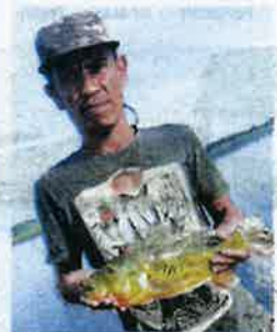
IKAN raja yang masuk ke pukat seorang nelayan darat di Sungai Kinta, Perak Tengah.