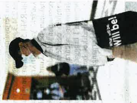
Tertuduh yang keluar dari mahkamah selepas prosiding semalam.

Mengikut fakta kes, seorang wanita bersama suaminya yang memberi makanan kepada anjing jalanan di kawasan itu menjumpai tujuh bangkai anak anjing dipercaiyai mati diracun dalam makanan selain menjumpai seekor anjing betina mempunyai kesan luka tetakan di kaki kiri, kanan dan badannya.