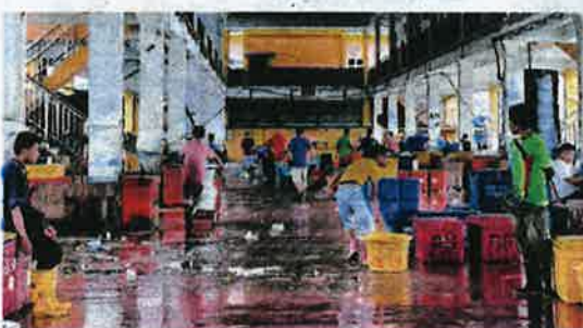
SUASANA di pelantar pendaratan ikan Kuala Perlis tidak serancak dahulu berikutan kurangnya aktiviti menangkap ikan sejak Mac lalu.

tempatan tetapi mereka tidak sanggup melakukan kerja berat, itu menjadi masalah," katanya ketika ditemui di sini semalam.