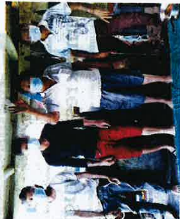
EMPAT lelaki ditahan APMM kerana menjalankan aktiviti menangkap ikan di kawasan tidak dibenarkan di Tanjung Manis kelmarin.

Tambahnya, jika terdapat sebarang aduan aktiviti jenayah serta kecemasan di laut, orang awam boleh menghubungi Pusat Operasi Maritim Malaysia Sarawak ditalian 082-432544 atau pun MERS 999 yang beroperasi 24 jam.