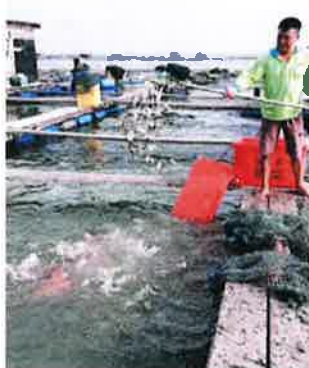
风灾及新冠肺炎疫情,使高渊港口海上养殖业受重创。

他表示,公会2年前也曾向檳州政府提出有关地契问题,不过至今也是没有下文,希望获得关注。#