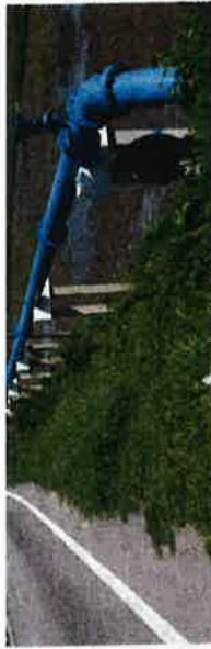
Paip baharu di Kampung Pengkalan Nangka.