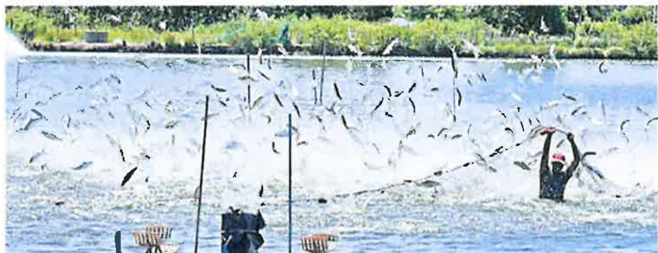
Harvesting process of the milkfish.