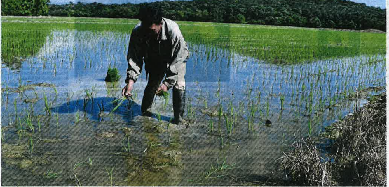
PADI ditanam dengan menggunakan kudrat di kawasan yang tidak boleh berjenjera.

Lelaki dari Selangor ulang alik ke Melaka sejauh 200 kilometer sejak lima tahun lalu untuk tanam padi