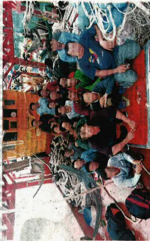
NELAYAN-NELAYAN Vietnam yang berjaya ditahan ketika menangkap hasil laut secara haram di perairan Kuala Terengganu semasa PKP dan PKPP.

"Jelas beliau, bot nelayan asing yang dikenal pasti menceroboh perairan negara akan ditahan sebelum peralatan menangkap ikan mereka dirosakkan agar mereka tidak boleh menangkap