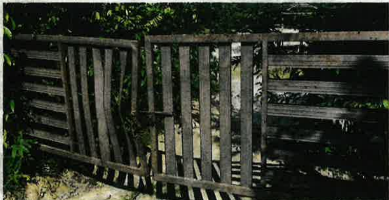
Laluan masuk utama ke sebuah kawasan bekas lombong turut dicencal bagi menghalang nelayan darat masuk ke kawasan itu untuk menangkap ikan.

Katanya, di kawasan Sungai Galah di daerah Perak Tengah, daripada 20 bekas lombong yang ada di kawasan itu, hanya lima bekas lombong yang boleh digunakan dan selebihnya sudah di-