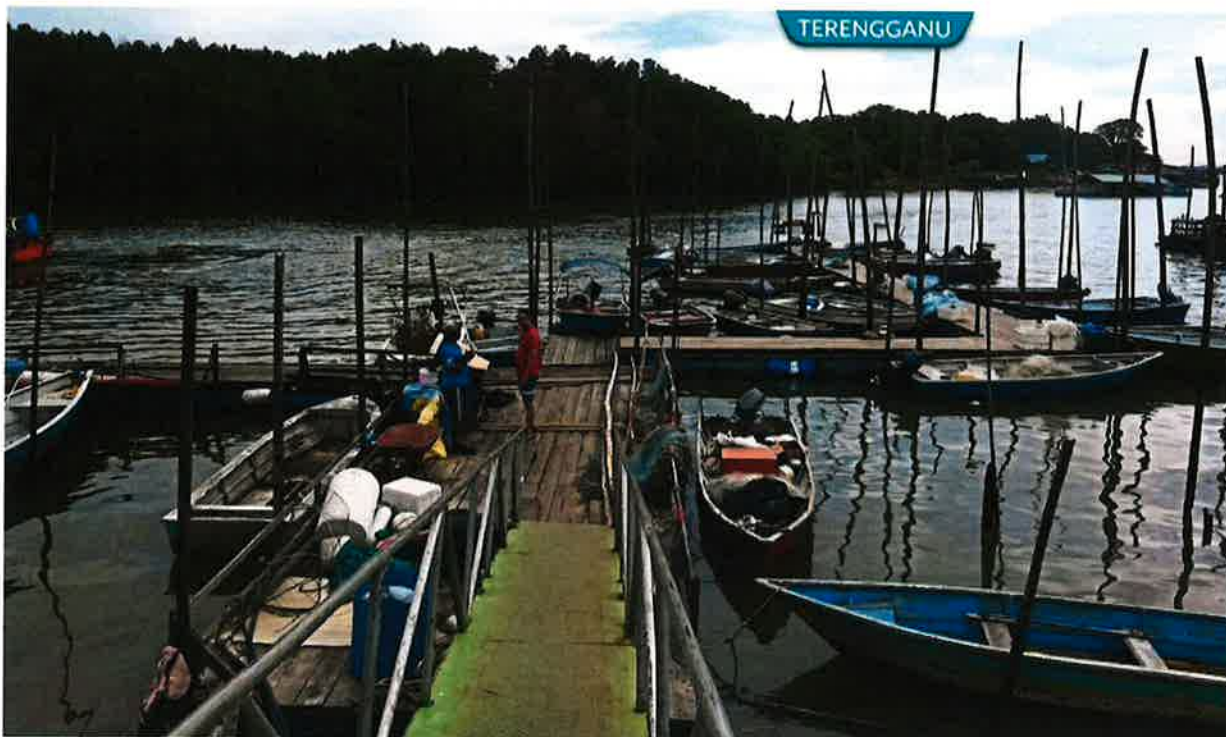
Coastal fishermen nationwide will be registered as part of an exercise by the Agriculture and Food Industry Ministry.