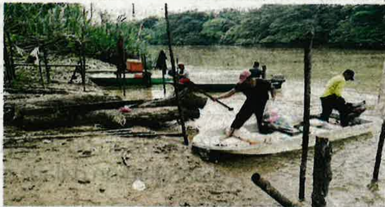
Nelayan darat di Perak memerlukan bantuan kerajaan untuk mewartakan kawasan bekas lombong sebagai kawasan perikanan darat untuk memudahkan mereka mencari rezeki tanpa gangguan pihak tertentu.

"Malangnya, nelayan darat berdepan pula de-