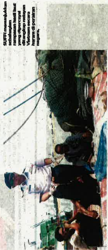
SUPRI membolehkan rampasan hasil laut yang dipercepat di berbagai negeri Vietnam secara haram di perairan negara.