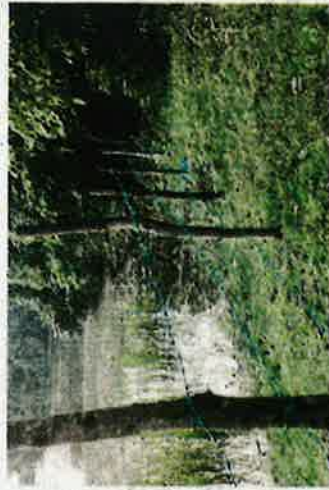
Salah satu bekas lombong yang dipercayai telah diginger oleh peneroka haram bagi menghidang nelayan darat merampas ikan di kawasan Sungai Galah di Perak Tengah.