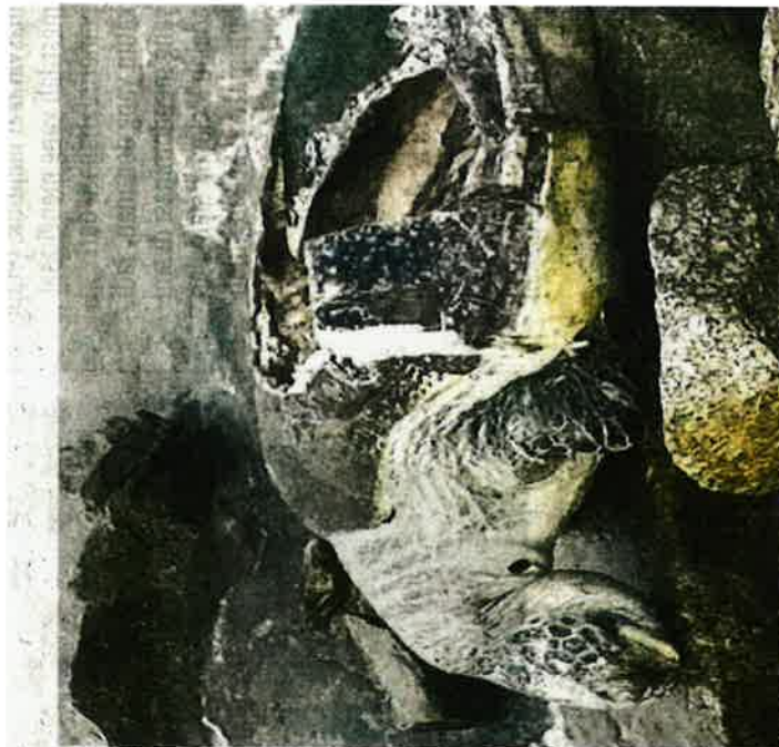
BANGKAI penyu agar jantan yang ditemukan orang awam di tepi pantai PD Waterfront dekat Port Dickson, Negeri Sembilan, semalam.

Befiau menasihatkan orang ramai supaya melaporkan penemuan penyu mati atau cedera di sepanjang pantai Port Dickson.