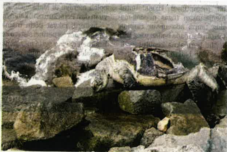
BANGKAI penyu agar ditemui pengunjung di Port Dickson kelmarin.