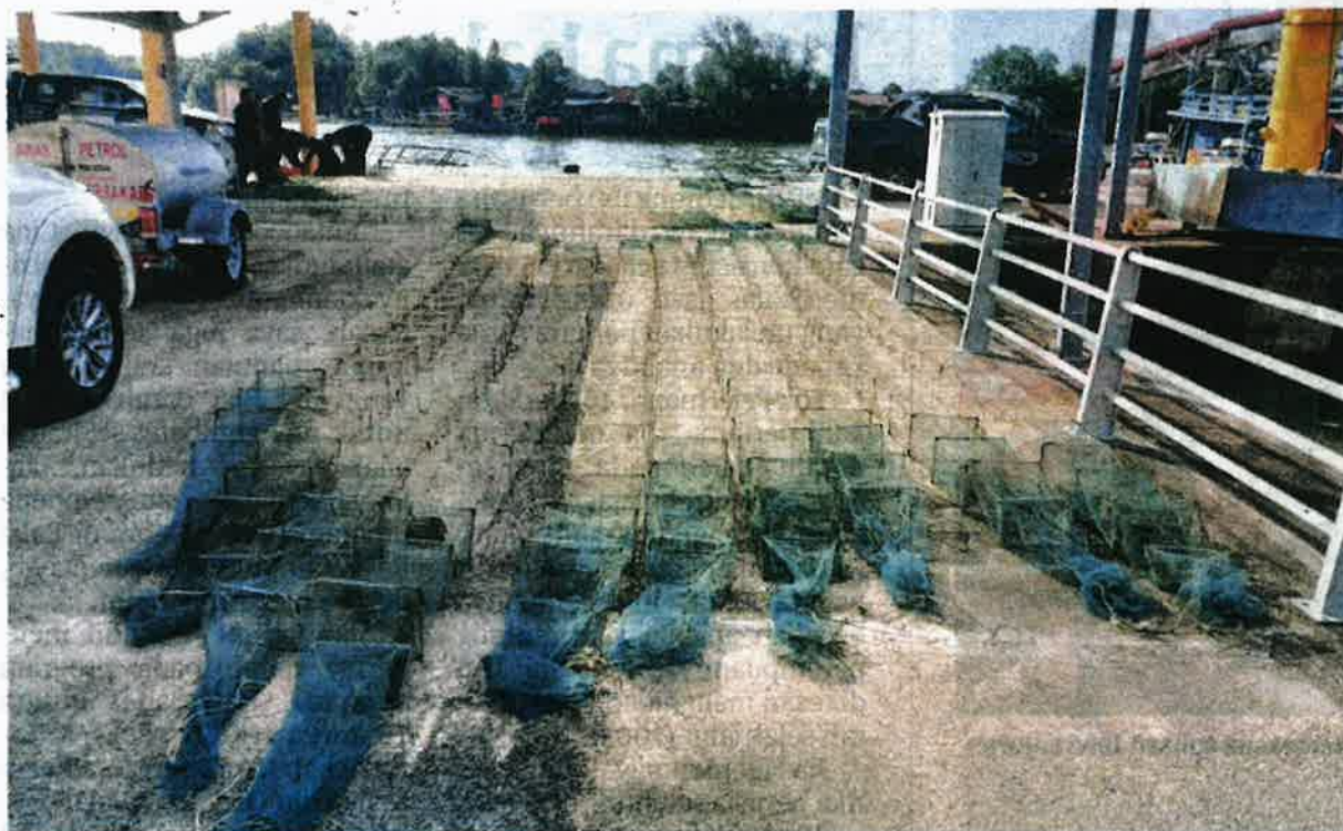
SEBANYAK 60 unit bubu naga dirampas dalam Op Benteng Laut di perairan Kuala Perlis kelmarin.