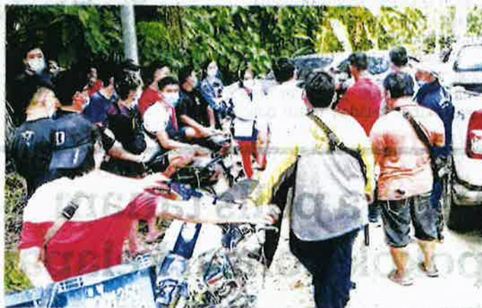
PEKEBUN durian yang tidak dibenarkan memasuki kawasan kebun durian berkumpul di tepi jalan di Sungai Ruan di Raub Pahang semalam.

Kerajaan negeri dalam kenyataan itu menyatakan pihak berkuasa ada bukti bahawa pembukaan tanah haram tanaman durian itu semakin bertambah di kawasan Sungai Ruan dan Sungai Chalit, Raub dan masalah itu tidak boleh dibiarkan.