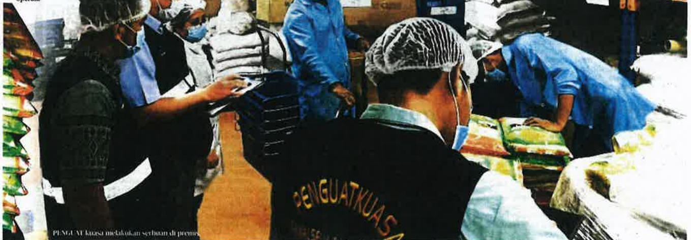
PENJAJAG kuasa meletakkan sebatian di premis.