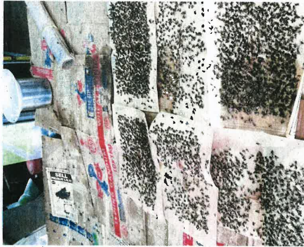
Lalat dari ladang ternakan ayam berhampiran Sungai Benut, Kampung Datuk Ibrahim Majid mengganggu penduduk setempat.

Simpang Renggam: Kira-kira 9,000 penduduk di Japen perkampungan sekitar Bandar Baru Ibrahim Majid membantah sekilas-kerasnya cadangan pembinaan ladang ternakan ayam berhampiran Sungai Benut di Kampung Datuk Ibrahim Majid dekat sini.