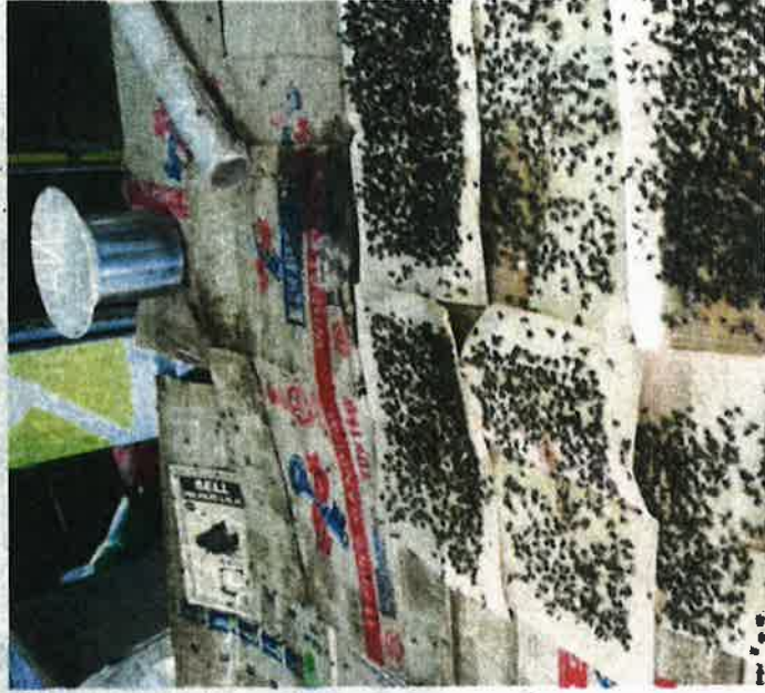
LALAT penuh atas kertas pelekat yang dipasang di kediaman penduduk.

"Saya secara dasarnya menyokong bantahan yang disuarakan oleh penduduk kampung kerana implikasinya berlaku secara berpanjangan," katanya.