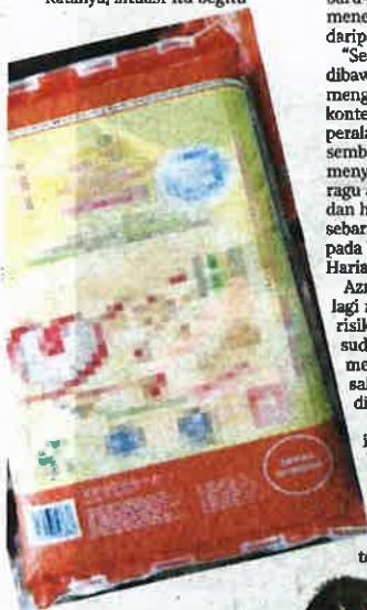
ANTARA beras yang dirampas dalam operasi.

Beliau berkata, siasatan dijalankan di bawah Seksyen 202 Akta Kawalan Padi dan Beras 1992 iaitu memiliki padi atau beras dengan cara menyalahi undang-undang.