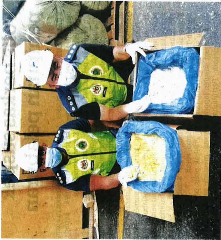
PEGAWAI Maqis Pulau Pinang menunjukkan serbuk telur itik yang dirampas di Butterworth pada 19 Ogos lalu.