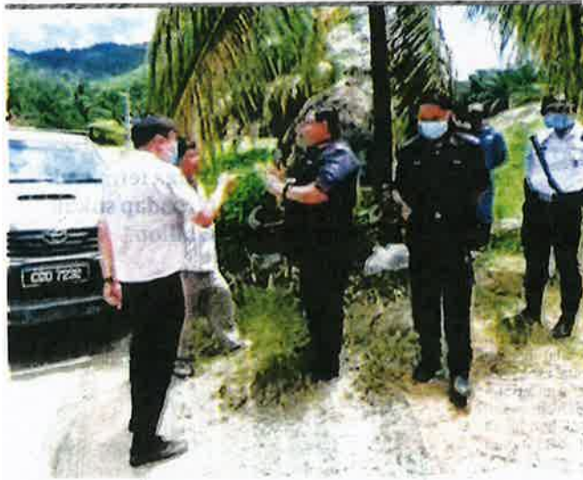
SEORANG pekebun dilarang memasuki kebun durian di Sungai Ruan, Raub, Pahang, semalam.