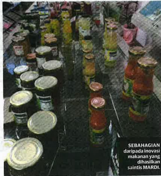
SEBAHAGIAN daripada inovasi makanan yang dihasilkan saintis MARDI.

"Pusat ini juga membangunkan sebanyak 57 teknologi makanan konvensional antaranya termasuklah sos dan kicap, jus dan minuman buah-buahan dan produk daging sejuk beku selain 39 teknologi makanan kesihatan antaranya minuman buah