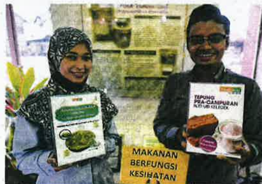
DUA kakitangan MARDI menunjukkan produk pracampuran yang diberi suntikan teknologi terkinil.

Antara keistimewaannya adalah karbohidrat tinggi yang