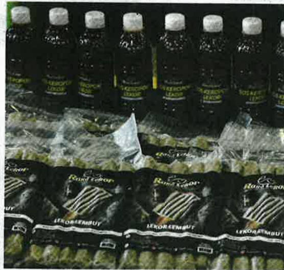
INOVASI makanan keropok lekor lembut.

"Inovasi makanan tempatan yang dihasilkan oleh MARDI sememangnya berkualiti