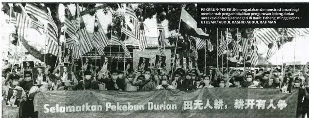
PEKEBUN-PEKEBUN mengadakan demonstrasi aman bagi membantah pengambilalihan pengurusan ladang durian mereka oleh kerajaan negeri di Raub, Pahang, minggu lepas.