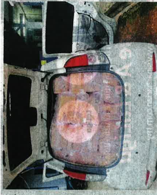
PGA merampas 60 kotak berisi ayam sejuk beku di dalam sebuah Perodua Myvi di Jalan Bypass Banggol Chicha, Rantau Panjang Kelantan.