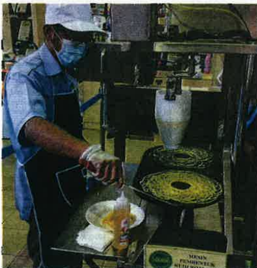
MESIN roti jala antara hasil penyelidikan MARDI.

bertukar penggunaan daripada keropok ikan komersial sedia ada kepada keropok lekor ikan MARDI. Antara keistimewaan produk tersebut adalah mengandungi protein, rendah kandungan lemak dan mengandungi asid lemak tidak tepu (PUFA).