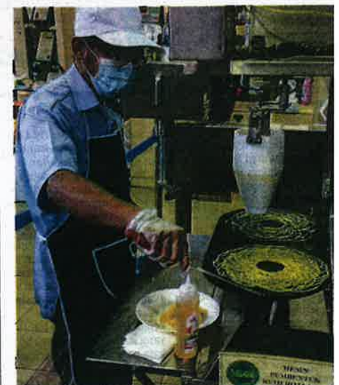
MESIN roti jala antara hasil penyelidikan MARDI.

bertukar penggunaan daripada keropok ikan komersial sedia ada kepada keropok lekor ikan MARDI. Antara keistimewaan produk tersebut adalah mengandungi protein, rendah kandungan lemak dan mengandungi asid lemak tidak tepu (PUFA).