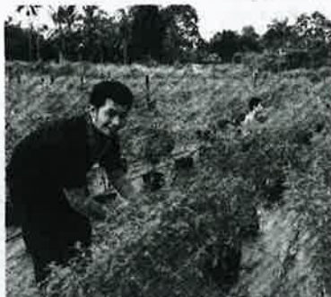
PROGRAM perantis pertanian amat sesuai dilaksanakan bagi menarik golongan profesional menceburi bidang itu.