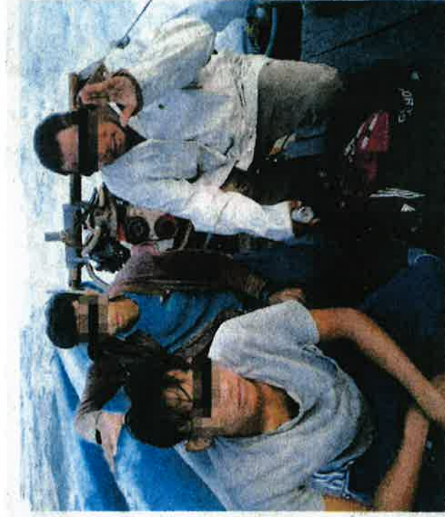
TEKONG bersama dua awak-awak ditahan Agensi Penguatkuasaan Maritim Malaysia Pulau Pinang selepas disyaki menggunakan pukat rawa sorong awal pagi semalam.

Beliau meminta orang ramai diminta memberi kerjasama dengan memberi maklumat lengkap sekiranya terdapat kecemasan atau aduan di laut kepada Maritim Malaysia melalui talian 24 Jam iaitu MERS 999 atau di Pusat Operasi Maritim Pulau Pinang: 04-2626146 atau 04-264-3650.