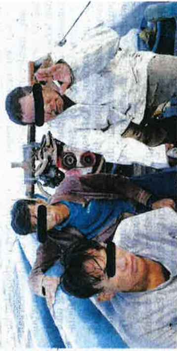
TEKONG bersama dua awak-awak ditahan APMM selepas disyaki menggunakan pukat rawa sorong semalam.

Mereka boleh hubungi di talian 24 Jam iaitu MERS 999 atau terus hubungi Pusat Operasi Maritim Pulau Pinang ditalian 04-263 6146 atau 04-264 3650 .