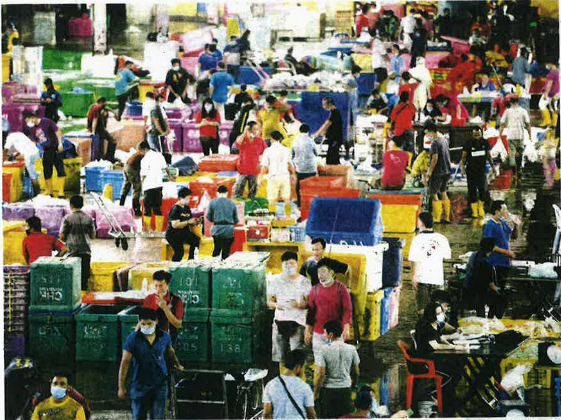
LKIM akan membuat 'pembersihan' warga asing di Kompleks LKIM Kemunting, Kuantan.