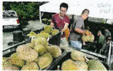
Pekebun merayu agar kerajaan Pahang menyewakan tanah kepada mereka untuk terus mengurangkan tanaman durian di beberapa kawasan di daerah Raub.

"Lebih baik bagi kami jika pekebun menguruskannya dengan menyewakan tanah serta