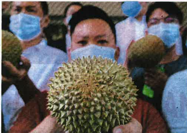
Some of the Raub durian farmers gathering in front of the Kuantan Court Complex last Friday after being issued eviction notices by the authorities.