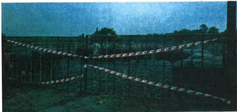
Kakitangan Jabatan Perkhidmatan Veterinar menyuntik kerbau sehingga lewat petang.

“Jasa dan bakti mereka layak dihargai walau pelbagai cemuhan terpaksa mereka terima dan hadapi. Terima kasih semua,” ujarnya.