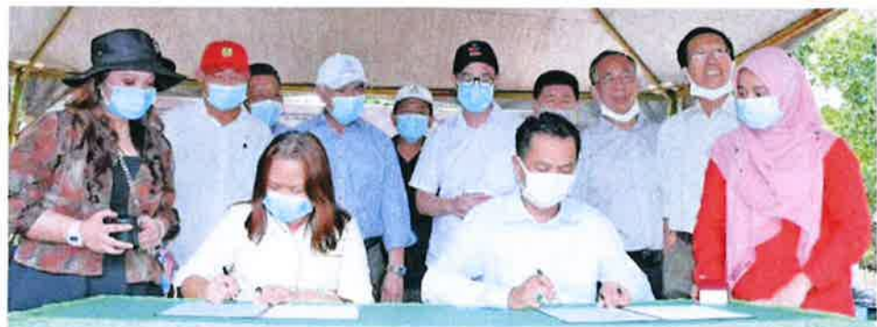
Junz (seventh, left) witnessed the MoU signing between KPD and Green Drone Advance Farming.

"Early this year, we roped in Ananas Farm as the anchor for Sabah Golden Melon. They have identified a correct SOP