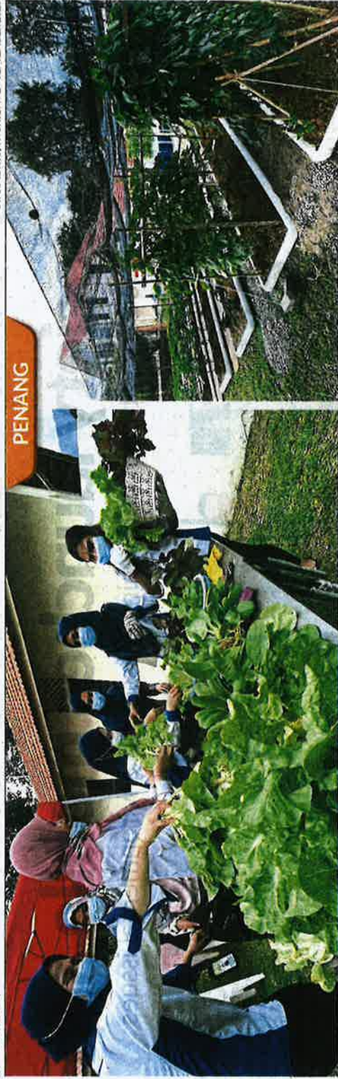
Salad leaves being harvested at the community farming project at Penang Digital Library in George Town. (Right) Long bean plants growing on pergolas at the community farm at the Penang Digital Library grounds.