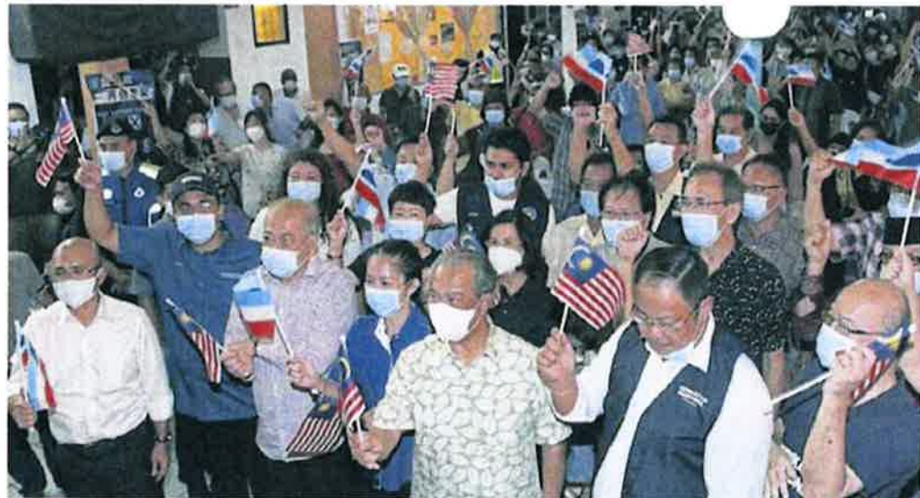
■慕尤丁（前排右3）与出席者挥舞国旗和州旗。

（亚庇23日讯）首相丹斯里慕尤丁如常飞往沙巴助选，并强调他是全民首相，会关注各族的福祉，希望能协助沙巴的发展，给予沙巴人更好的待遇。