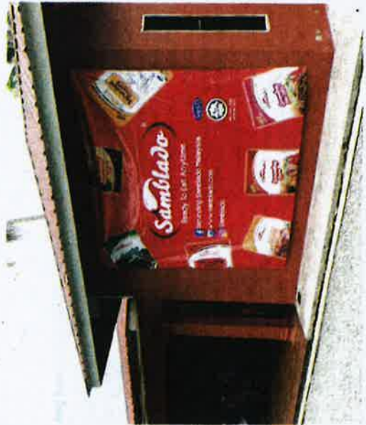
Kilang serunding Samblado terletak di Kampung Kubang Kerian, Bukit Panau.

"Saya juga membuat 10 hingga 15 jenis kuih setiap pagi untuk dihantar kepada tujuh tempat termasuk sekolah," katanya ketika ditemui di kilang serunding Samblado di Kampung Kubang Kerian, Bukit Panau