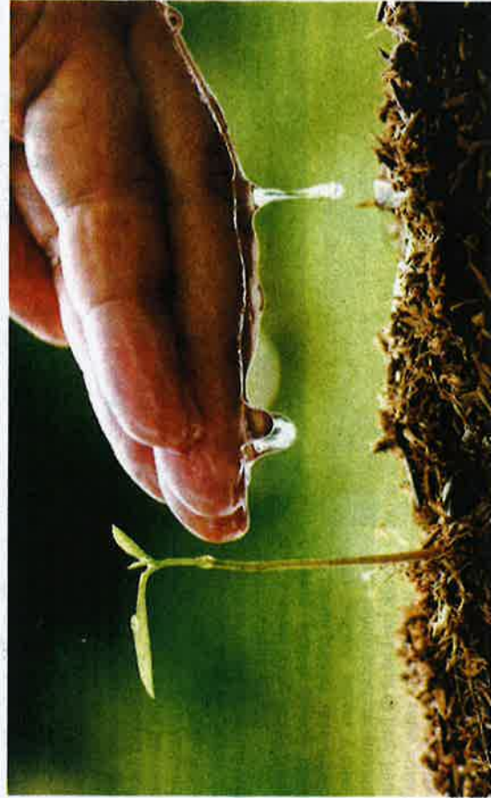
Pertanian satu perniagaan

Bagi memulihkan persepsi rakyat terutamanya generasi muda terhadap pertanian pelbagai program pertanian yang bernafas baru dan bernovasi. Kerajaan hendaklah