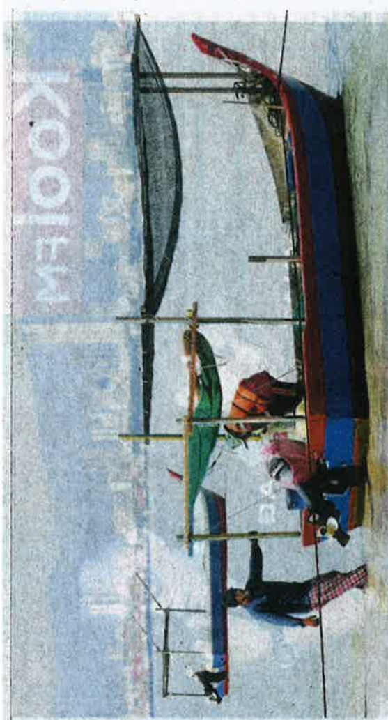
Ismail (tiri) bersama rakam melakukan persiapan untuk turun ke laut kerana hasil tangkapan meningkat sehingga tiga kali ganda ketika ditemui di Bagan Ajam, semalam.

but dia memperoleh hasil antara lapan ke 16 kilogram (kg) berbanding 4kg pada musim air tenang.