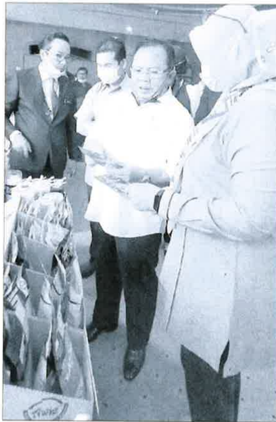
阿末韩查(右2)巡视各类农业摊位,了解特产。