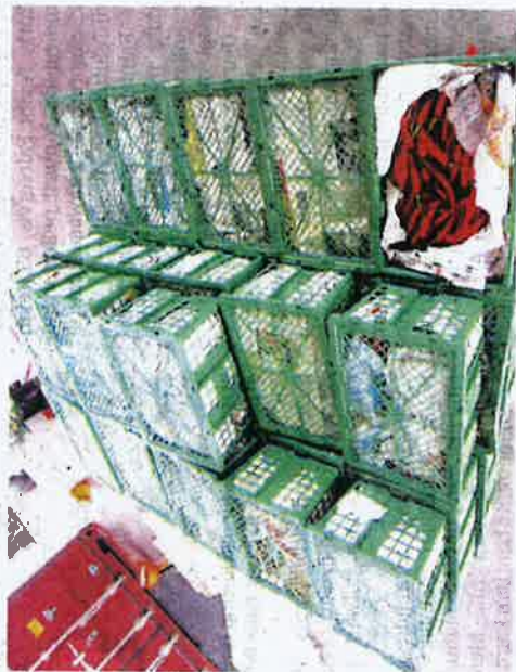
SEBANYAK 640 kg cili merah dari China dirampas Maqjis Pulau Pinang di Terminal Kontena Butterworth Utara, Seberang Perai kelmarin.

Menurutnya, hasil pertanian itu memerlukan permit import bagi mengawal perosak lalat buah cili atau Bactrocera latifrons dan memastikan penggunaan sisa racun makhluk perosak yang mematuhi piawaian.