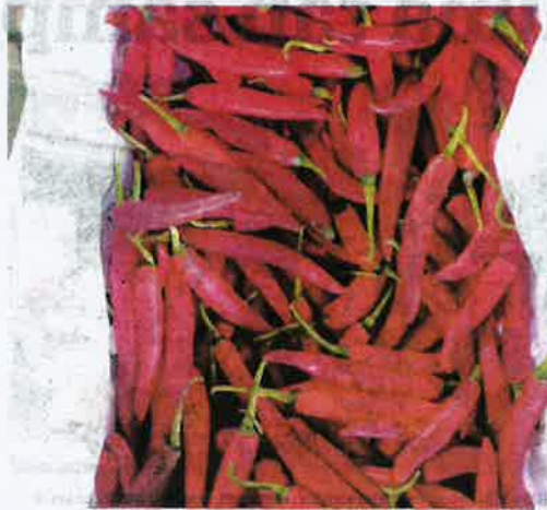
SEBANYAK 17,000 kg cili merah dari China dirampas Maqis Johor di PTP Gelang Patah kelmarin.

Bellau turut menegaskan, pihaknya sentiasa komited menjalankan pemeriksaan dan penguatkuasaan di pintu masuk negara bagi menjamin keselamatan keluaran pertanian agar mematuhi syarat serta peraturan yang ditetapkan kerajaan.