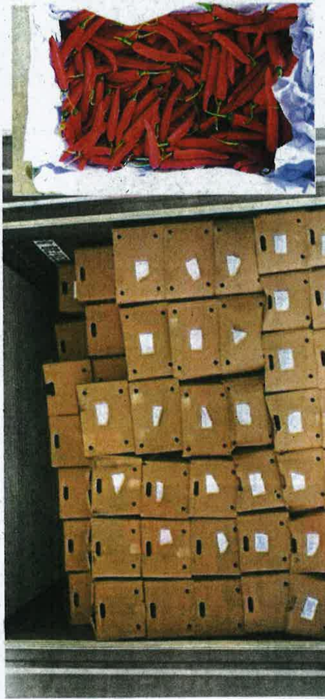
Hot commodity: Red chillies from China found by Maqis at Tanjung Pelepas Port in Iskandar Puteri.

She said Maqis seized the container and its contents for further action under Section 15(1) of the Malaysia Inspection and Quarantine