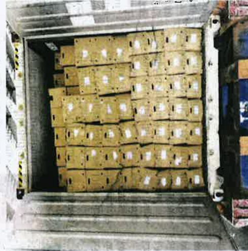
Kontena memuat 17,000kg cili dari China yang dirampas Maqis di Pelabuhan Tanjung Pelepas Kelmarin.

"Ia tidak mempunyai sijil fitosanitasi dari negara asal dan gagal mematuhi pengigredan, pembungkusan dan pelabelan sebagaimana yang dinyatakan