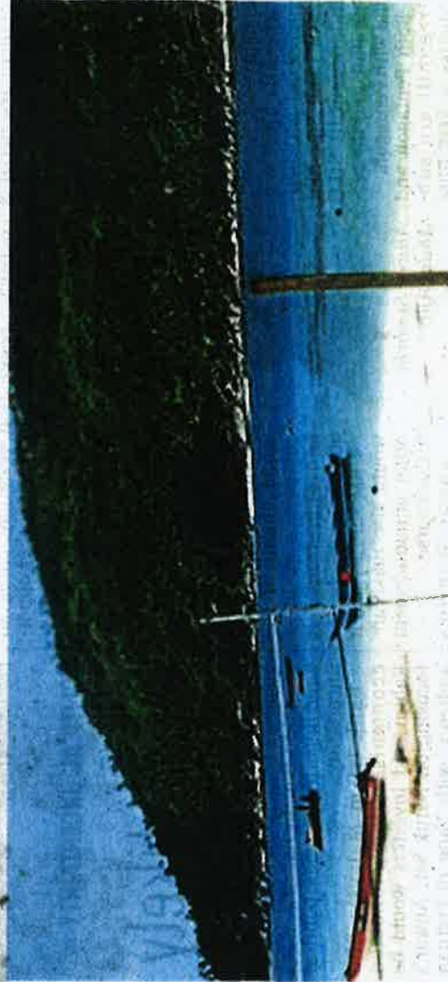
An information centre is being built at the Sultan Iskandar Marine Park on Pulau Besar and it is set to be a 'must visit' tourist destination when completed early next year. FILE PIC

ECERDC said a milestone project was Kampungstay in Air Pa-