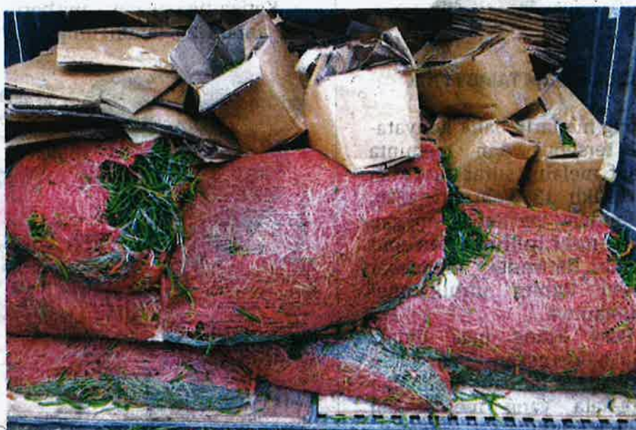
CILI hijau daripada India yang dirampas MAQIS selepas diseludup masuk secara haram tanpa permit import MAQIS di pintu masuk Pelabuhan Klang Barat, Klang kelmarin.

“Secara keseluruhannya, kita telah merampas 3,073 kilogram cili hijau dari India dianggarkan RM17,986.63,” katanya dalam