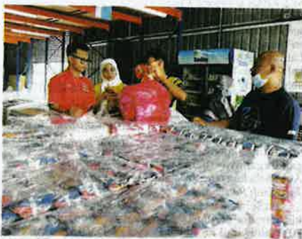
Melayani pelanggan yang datang membeli keropok segera.

"Namun begitu, kami masih optimis dan yakin dalam memenuhi tahun yang mencabar ini. Sekarang ini, kita akan memfokuskan kepada memperbaiki lagi kualiti produk dan memberikan servis yang lebih baik kepada pelanggan setia kami," katanya.