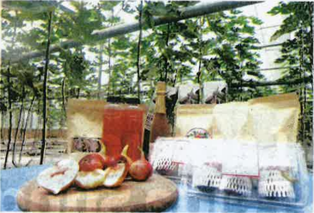
BUAH tin yang ditanam turut diproses untuk penghasilan produk-produk niliran seperti jus dan lain-lain.

Siti Fatimah menjelaskan; buah tin daripada jenis tersebut bukan sahaja lebih produktif dan bersaiz lebih besar bahkan harganya apabila dijual masih