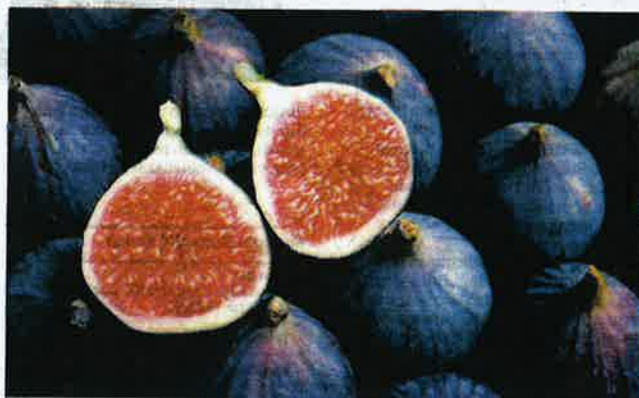
BUAH tin mengandungi serat yang tinggi sekali gus baik untuk proses pencernaan dalam tubuh manusia.

"Satu kajian dilakukan terhadap 150 orang berhadapan dengan sindrom iritasi usus dan sembelit mendapati, dengan pengambilan kira-kira empat biji buah tin kering seberat 45 gram dua kali sehari dapat mengurangkan gejala tersebut," jelas laporan itu.