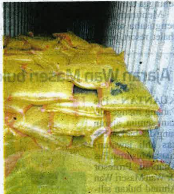
Produk makanan gluten jagung dari China yang dirampas di pintu masuk Pelabuhan Kontena Butterworth Utara (NBCT) Isnin lalu.

Menurutnya, barang dagangan seberat 112,000 kilogram (kg) dianggarkan bernilai RM211,777.16 itu disita untuk tindakan selanjutnya.