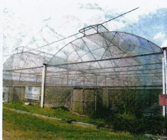
TANAMAN buah tin diusahakan di dalam rumah perlindungan hujan (RPH).