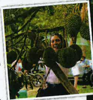
Pelbagai jenis durian khususnya Musang King di Janda Baik menjadikan lokasi itu berbaloi untuk dikunjungi.

"Kedatangan mereka akan membantu meningkatkan ekonomi setempat dan merancakkan sektor pelancongan di Pahang ketika Lembah Klang dalam pelaksanaan PKPB," katanya.