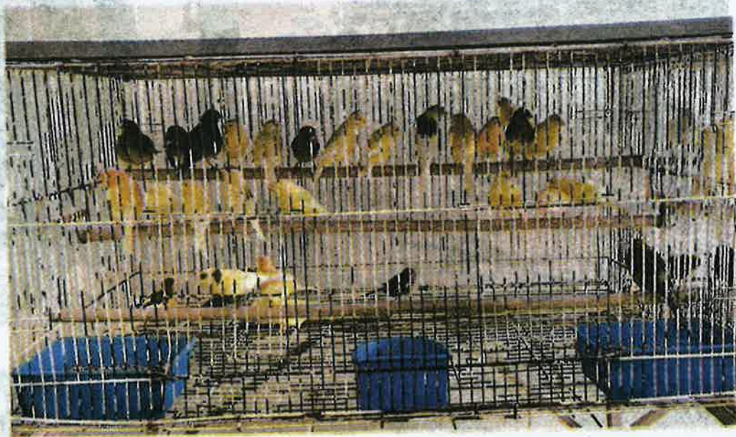
BURUNG-BURUNG kenari yang dirampas Maqis di KLIA, Sepang baru-baru ini.

Tarmisal berkata, pemeriksaan dilakukan bagi memastikan haiwan dan keluaran pertanian yang diimport bebas penyakit dan ancaman perosak serta mematuhi peraturan.