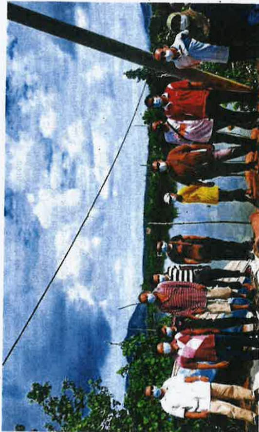
Waiting for action: Villagers and fishermen at Segari standing in front of the river they claim is being polluted and affecting their livelihoods.