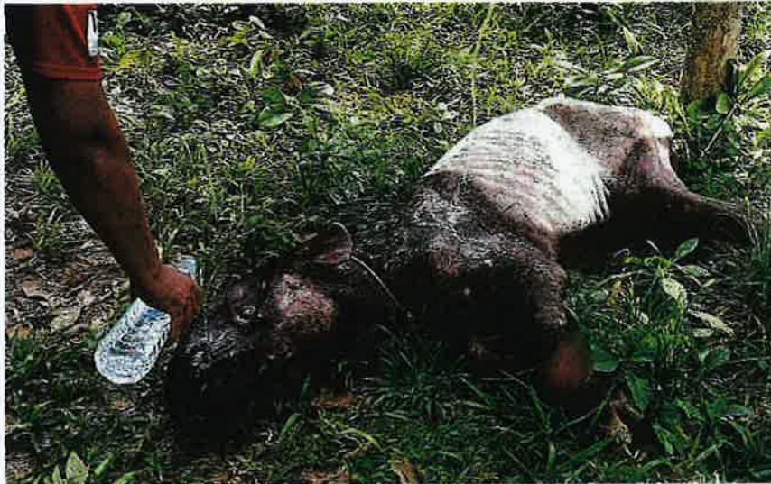
TAPIR ditemui lemah dan terdapat luka terkena jerat di kaki kirinya di Kampung Hulu Retang.