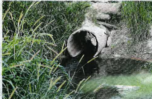
TINJAUAN air kumbahan dari kawasan ternakan kerbau yang didakwa mencemari Sungai Beranang.