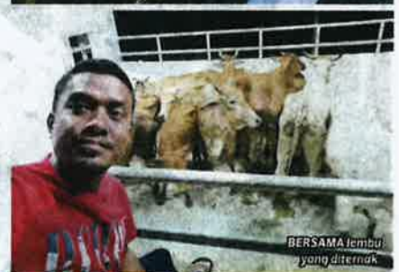
BERSAMA lembu yang diternak.