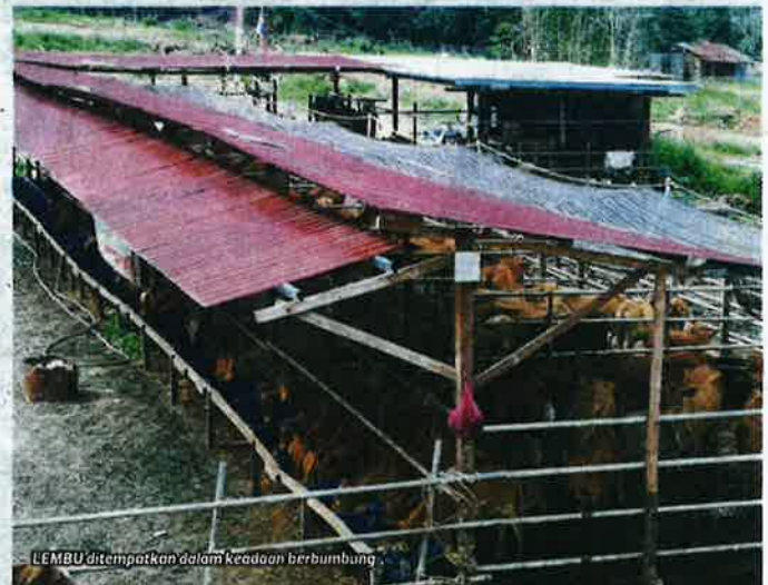
LEMBU ditempatkan dalam keadaan berbumbung.