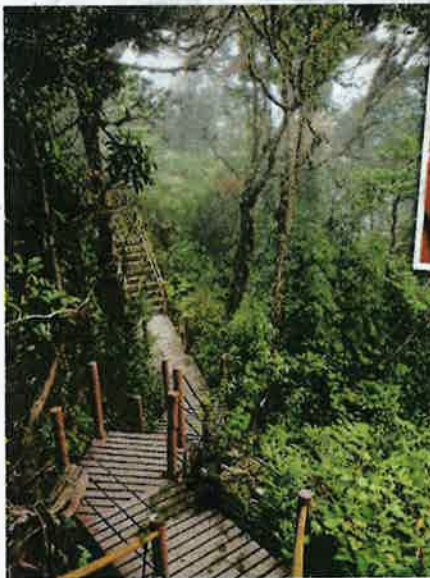
Keadaan cuaca yang berkabus menambahkan kecantikan Mossy Forest.

Tidak hairan, pada cuti hujung minggu atau cuti umum, Janda Baik menjadi tumpuan sama ada mereka bercuti bersama keluarga atau rakan.