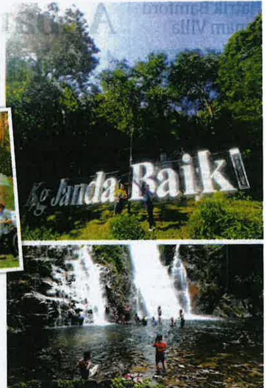
Di Janda Baik terdapat air terjun yang menjadi tarikan pengunjung.

"Apa yang perlu dilakukan ialah mematuhi prosedur operasi standard (SOP) yang ditetapkan oleh Majlis Keselamatan Negara (MKN) dan Kementerian Kesihatan (KKM) dalam usaha menyekat penularan COVID-19," katanya.