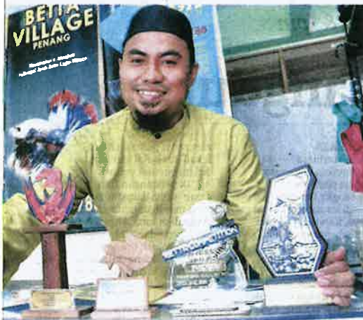
an anugerah yang dinenangi.