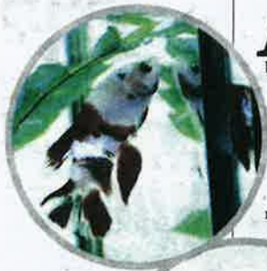
IKAN laga cantik dan menarik.

Lantas terpamerlah kecantikan dirinya hingga dipuja ramai peminat ikan laga di negara ini. Dahulunya ikan ini merupakan antara spesies yang menjadi mainan anak-anak kampung, namun kini ia menjadi pilihan ramai