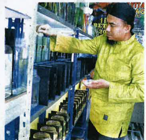
AIR tidak sesuai boleh mengakibatkan ikan laga mudah mati.