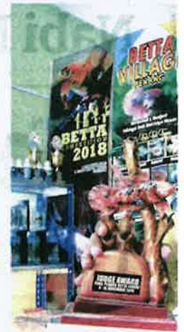
HASFANIZAM Hamdan menunjuki

Pelbagai spesies ikan laga kini mudah didapati namun spesies seperti halfmoon , single tail , halfmoon double tail , halfmoon plakot dan crowntail menjadi antara yang diburu peminat. Berpengalaman sebagai