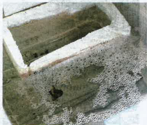
BUIH dihasilkan ikan laga untuk dijadikan tempat penetasan telur.

memandangkan terdapat pelbagai jenis ikan yang cantik, hasil daripada proses kacukan sehingga menghasilkan spesies lebih cantik.