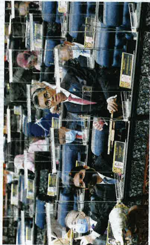
TENGGU ZAFRUL semasa membuat ucapan pengumuman Belanjawan 2021 di Parlimen semalam.

semula di peringkat jawatankuasa sebelum pengundian dilakukan sekali lagi minggu hadapan.