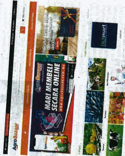
Usahawan dapat memasarkan produk pertanian secara online melalui Agrobazaar.

"Ia melibatkan pecahan nilai jualan produk segar dan industri asas tani (IAT) masing-masing sebanyak RM1.18 juta dan RM0.99 juta melibatkan 41,654 servis penghantaran sepanjang tempoh itu," katanya.