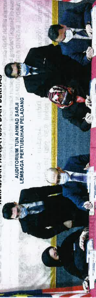
AUDITORIUM TUN AHMAD SARJIT LEMBAGA PERTUBUHAN PELADANG