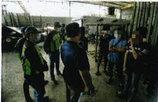
JKDM menyiasat siasat pekerja warga asing gudang terbabit berkenaan dalam misi mengesan mereka menulis dan mengetahui tempahan perut babi seperti yang tercatat dalam buku delivery order tersebut.

Kelmarin, Ketua Pengarah Maqis, Saiful Yazan Alwi mendedahkan kegiatan penyeludupan masuk daging sejuk beku dari Ukraine, Brazil, Argentina dan China itu dilakukan sindiket dipercayai menggunakan dokumen palsu termasuklah borang kastam, permit import, sijil halal dan resit bayaran.