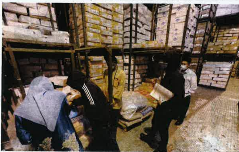
JAINJ bersama penguatkuasa lain bekerjasama menjalankan pemeriksaan di dalam gudang daging sejuk beku yang dipercayai beroperasi tanpa sijil halal serta menggunakan cap dan pelekat halal palsu.

Sumber JKDM berkata, siasatan lanjut terus dilaksanakan ke atas pekerja syarikat sebaik