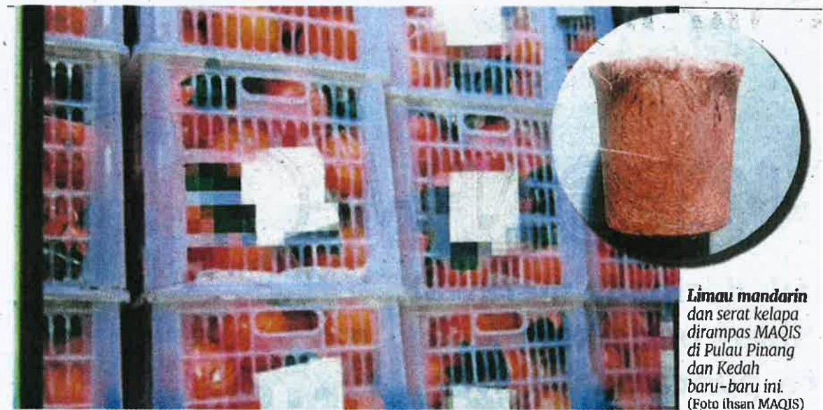
Limau mandarin dan serat kelapa dirampas MAQIS di Pulau Pinang dan Kedah baru-baru ini.