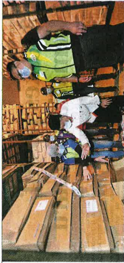
Daging sejuk beku dipercayai dibungkus semula dengan logo halal palsu disimpan dalam gudang diperiksa pihak berkuasa di Taman Perindustrian Senai, Johor awal bulan ini.

"Selain daging pejal, organ lain turut diseluput seperti paru, ekor, perut dan tulang leher. Dalam usaha menyeludup bekalan daging dari negara tidak diiktiraf ini,