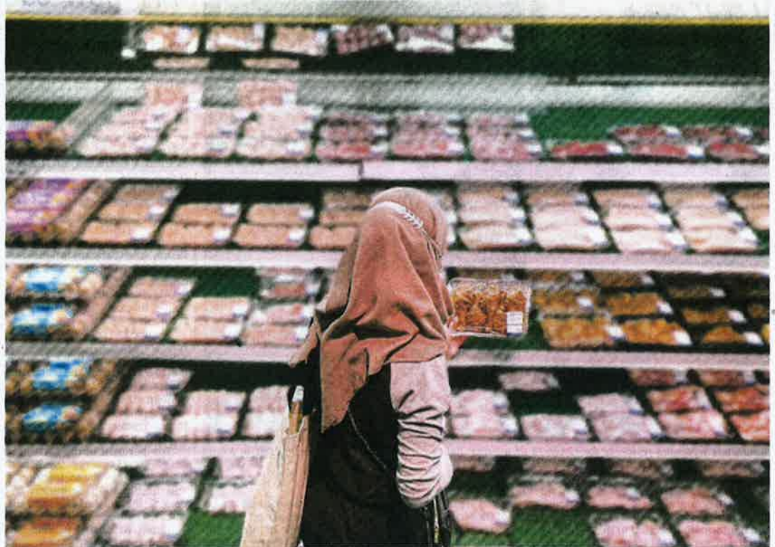
A woman looking at meat products at a shop in a major city.

sponsible for issuing approvals for products from meat processing plants abroad. But the sheer number of meat products from plants of dubious quality entering Malaysia has raised questions about the system's effectiveness."