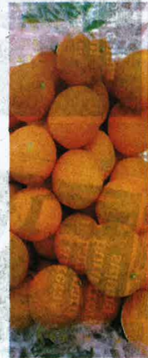
SEBAHAGIAN limau mandarin yang disita Maqis di Terminal Kontena Butterworth Utara, Seberang Perai, Jumaat lalu.