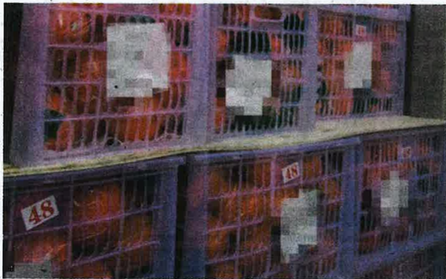
Sebanyak 25 tan limau mandarin dari China dirampas Maqis Pulau Pinang pada Jumaat lalu.

"Pemeriksaan mendapati kesemua kontena tersebut membawa 25,956kg limau yang dianggarkan