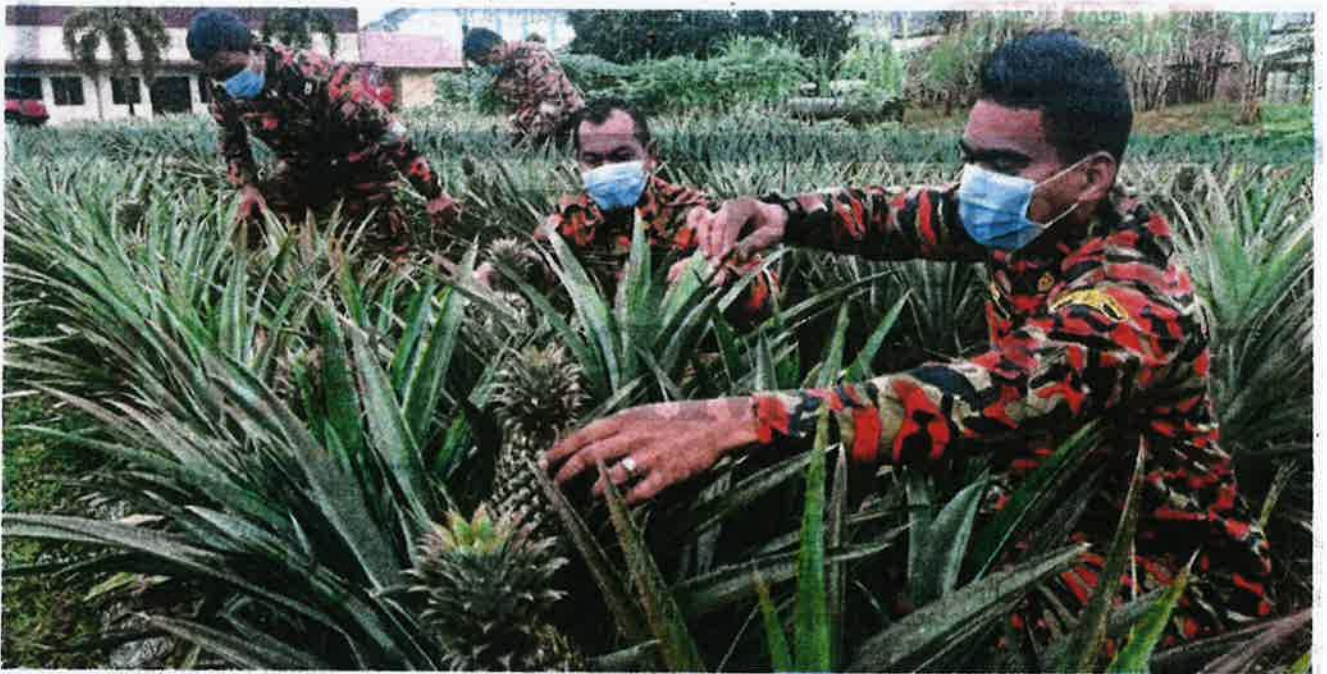
SEJUMLAH 3,000 pokok nanas di tanah seluas 0.5 hektar di belakang balai bomba.