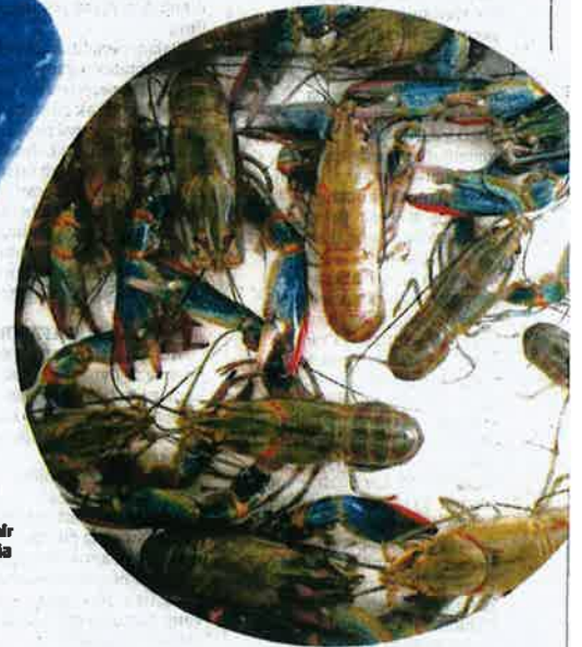
ANTARA udang kara air tawar yang sudah sedia untuk dimasak dan dipasarkan.