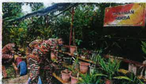
ANGGOTA bomba turut menanam herba dan sayur-sayuran.

"Alhamdulillah, dengan menggunakan kemahiran