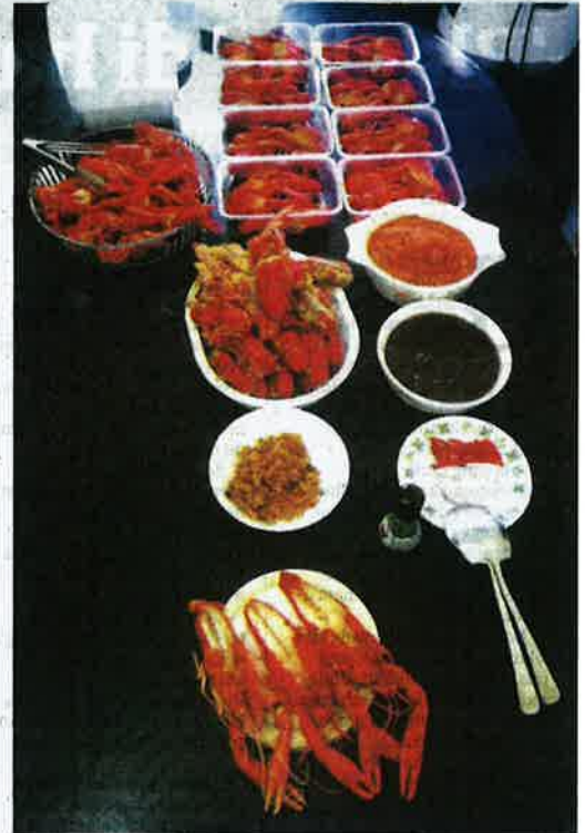
PELBAGAI jenis sajian udang kara air tawar yang menyelerakan.