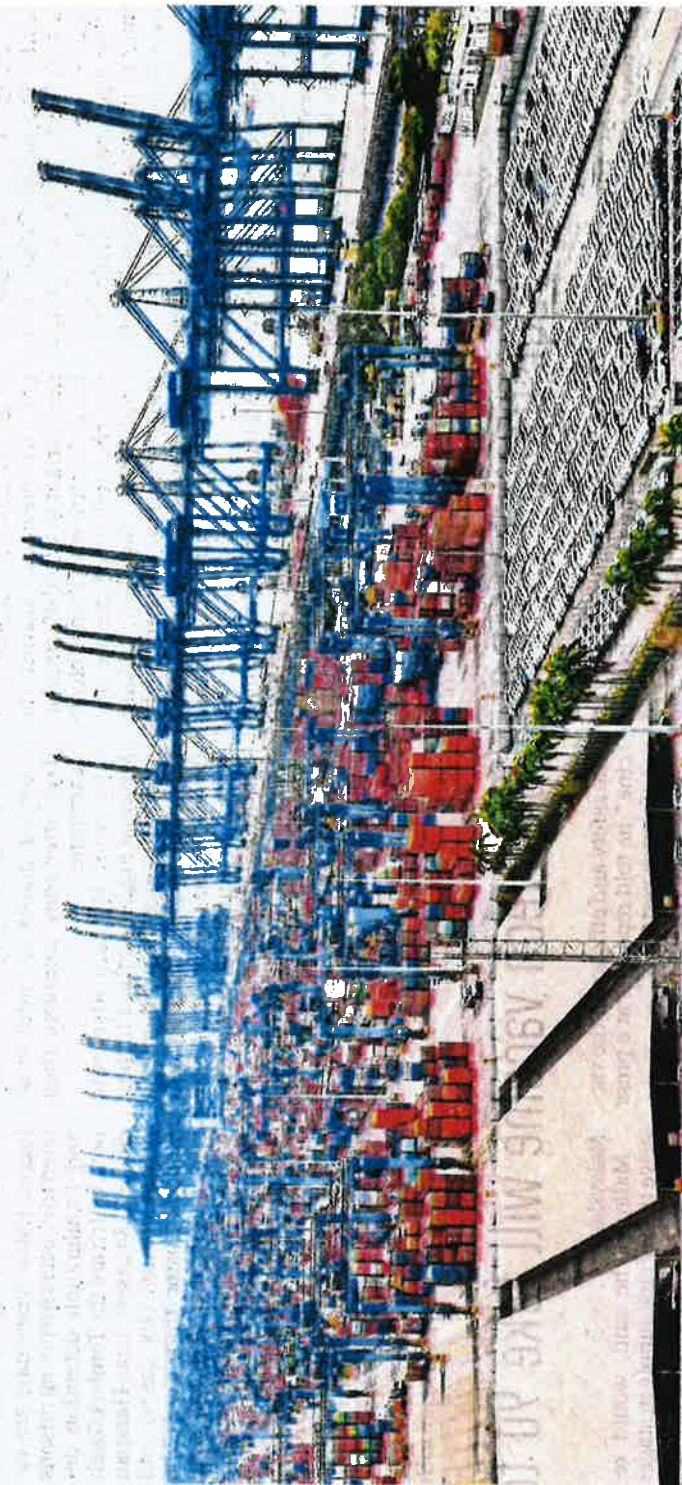
Containers of imported goods at Port Klang. Minister Datuk Seri Dr Ronald Kiandee says the authorities should conduct a probe and take action against those who conspired with the cartel.

knowledge of any possible involvement of Malaysian Quarantine and Inspection Services Department personnel with the cartel activities.