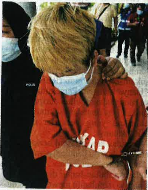
Suspek dibawa ke Mahkamah Bukit Mertajam bagi mendapatkan perintah reman pada pagi Khamis.

BUKIT MERTA JAM - Wanita yang didakwa memukul seekor kucing bunting sehingga mati di Jalan Pintas Kaloi petang Selasa lalu direman empat hari di Mahkamah Majistret Bukit Mertajam pada Khamis.