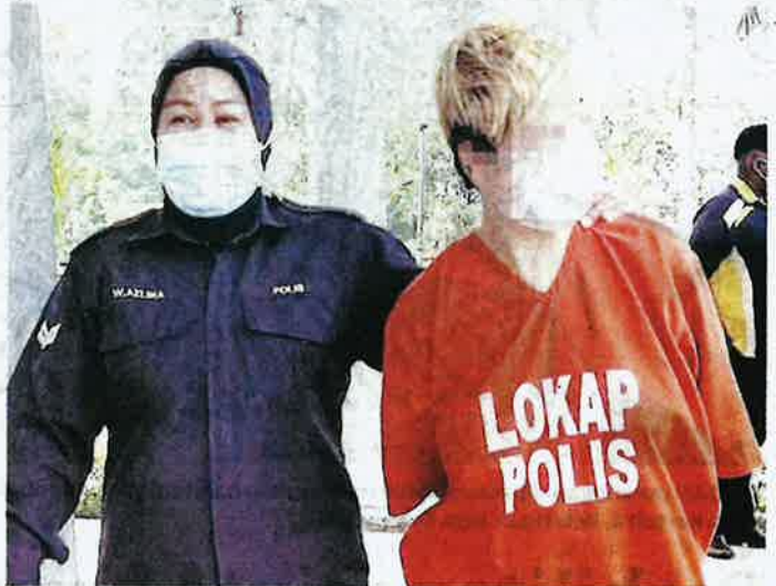
SUSPEK dibawa keluar selepas permohonan reman dibuat di Mahkamah Bukit Mertajam semalam.