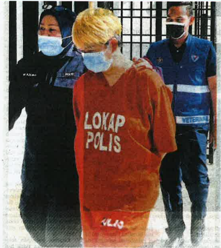
SUSPEK ditirngi pegawai JPV di pelcrangan mahkamah.