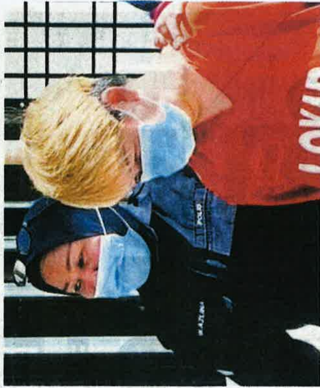
Suspek dibawa ke Mahkamah Sesyen Bukit Mertajam, semalam.

Ekoran itu, dia mengambil sebatang besi dalam keretanya sebelum memukul dua kucing yang