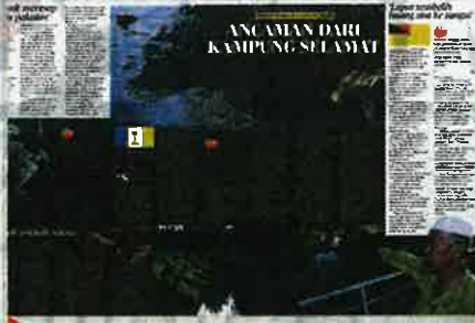
LAPORAN Harian Metro, semalam.