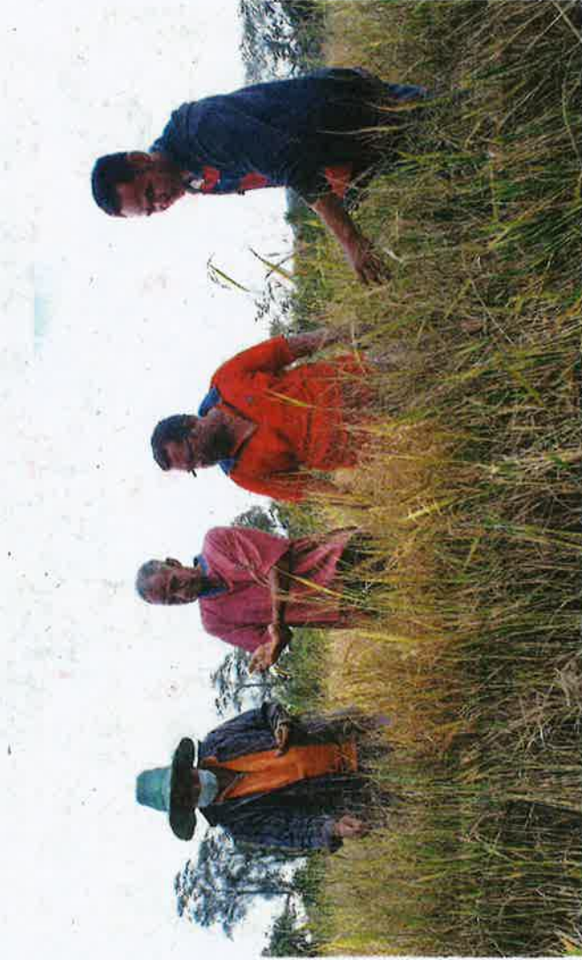
PESAWAH menunjukkan padi milik mereka yang tidak boleh dituai akibat penyakit dan serangan serangga di Kampung Tengah, Kuala Nerang semalam.