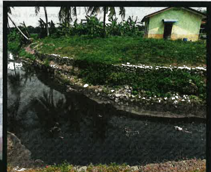
Air sungai berwarna gelap serta berbau akibat pencemaran di Sungai Keroh, kampung Tok Bedu, Esak Gelang.

"Dengan pengurusan ladang babi yang teratur pastinya isu pencemaran dapat diatasi," katanya.