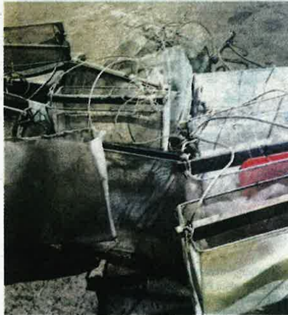
Sebahagian tangguk tangan yang digunakan bagi aktiviti mencuri anak kerang di perairan Sabak Bernam disita dalam serbuan pada Jumaat.

Bagaimanapun, kenyataan itu memberitahu, kesemua individu terlibat sempat melarikan diri ke arah laut menggunakan sampan dan membawa anak kerang yang disimpan dalam guni.