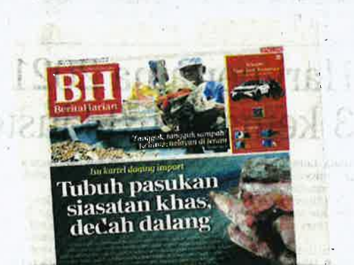
Keratan akhbar BH 28 Disember lalu.