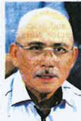
Datuk Seri Dr Ronald Kiandee

He said the Malaysian Quarantine and Inspection Services Department (Maqis) would also enhance efforts to curb smuggling of frozen meat and chicken into the country.