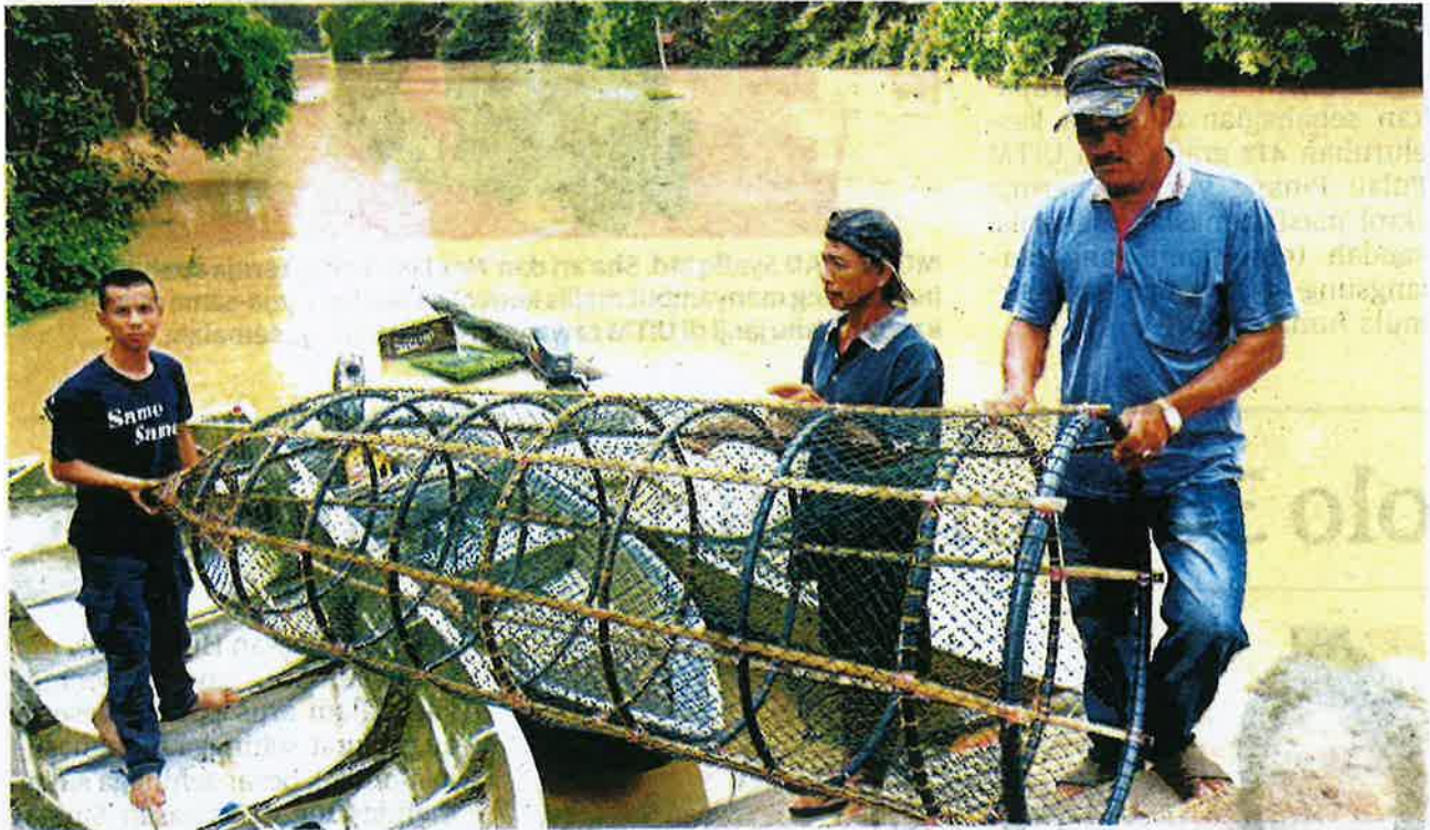
PENDUDUK kampung menaikkan lukah dari Sungai Segamat sebagai langkah berjaga-jaga ketika musim tengkujuh.