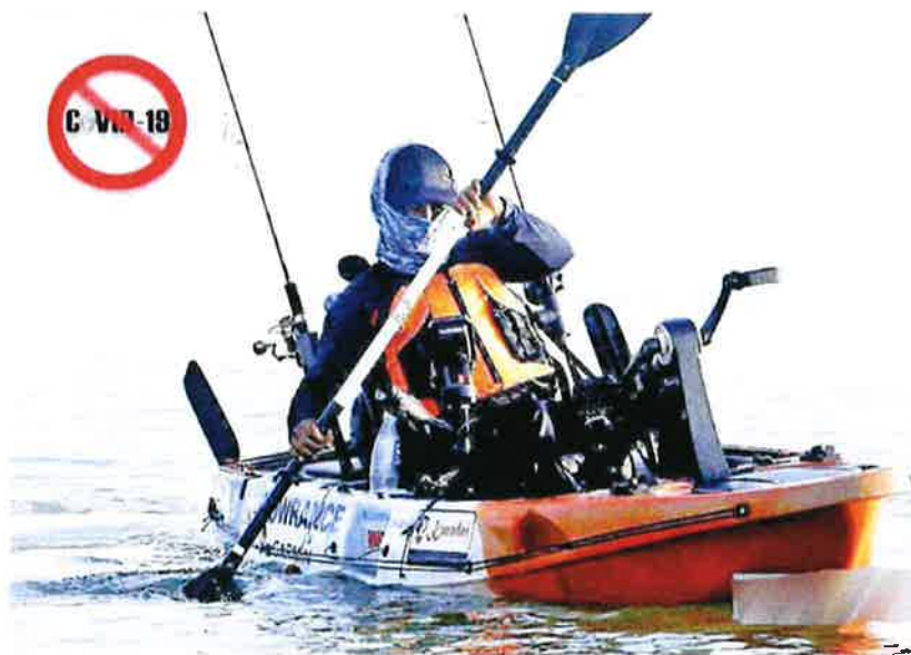
Kayak fishing activity about 3.6 kilometres from the coast at Pantai Bagan Pinang.