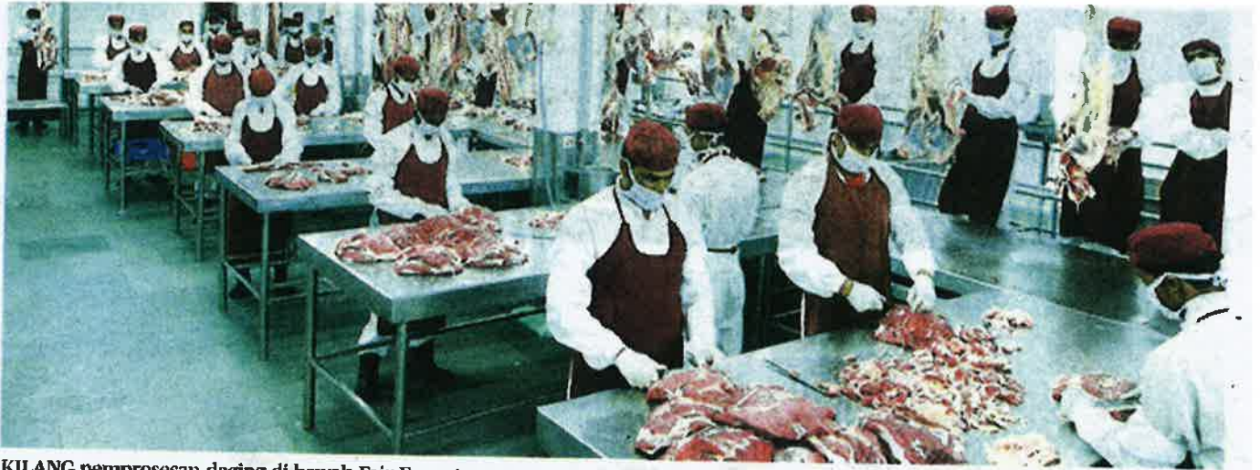
KILANG pemprosesan daging di bawah Fair Exports.