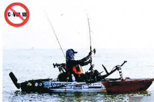
A kayaker looking for a suitable area to fish.

"We also provide a smartphone app which our kayak fishing anglers can download to locate fishing points in the sea which we will share