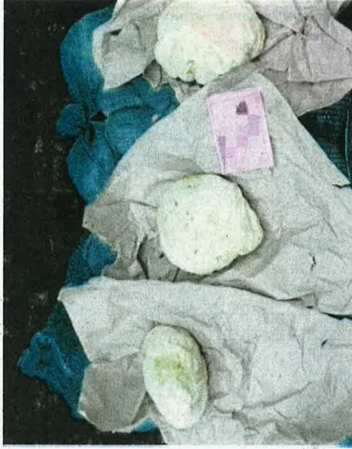
Kubis dibawa masuk dari Indonesia tanpa permit import sah dirampas di pintu masuk Pelabuhan Barat pada 31 Disember lalu.