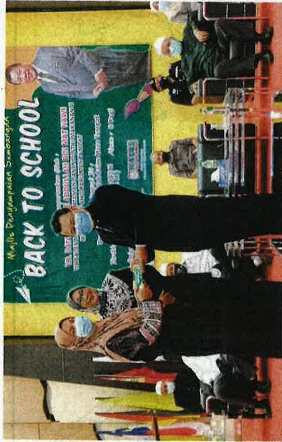
Che Abdullah (kanan) dan Nazilah (tengah) menyempalakan baucar Back To School kepada Ramlah di Tumpat pada Ahad.

Timbalan Menteri Pertanian dan Industri Makanan II, Datuk Che Abdullah Mat Nawi berkata, sumbangan diberikan kepada lebih 3,000 penerima dalam kalangan keluarga kurang berkemampuan termasuk