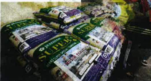
Beras yang diagihkan kepada 210 warga nelayan di Kuala Nerus.

Othman mendakwa, pendapatan nelayan terjejas kerana musim tengkujuh tidak dapat turun ke