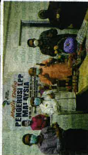
Produk yang dikeluarkan usahawan tempatan.