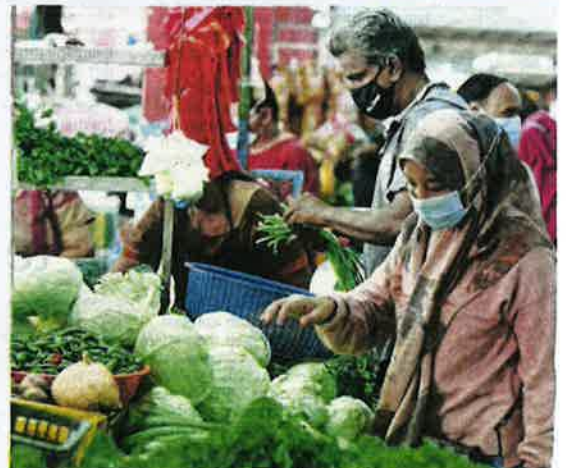
Orang ramai membeli sayur di Pasar Besar Jalan Othman, Petaling Jaya, semalam.