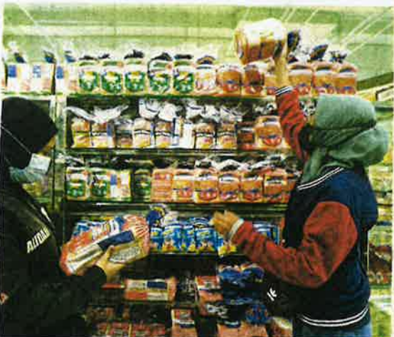
Roti putih Gardenia dapat permintaan tinggi sejak pelaksanaan PKP ketika jualan di sekitar pasar raya di Kuala Lumpur, semalam.

beberapa jenis sayuran mengalami sedikit kenaikan harga disebabkan beberapa faktor.