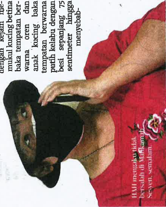
Hah mengaku tidak bersalah di Mahkamah Sesyen, semalam.

Mahkamah membenarkan tertuduh diikat jamin RM10,000 dengan seorang penjamin