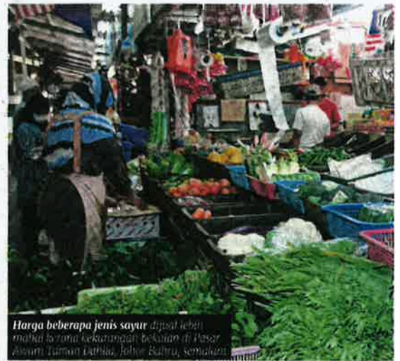
Harga beberapa jenis sayur dijual lebih mahal kerana kekurangan bekalan di Pasar Awam Taman Dahlia, Johor Bahru, semalam.