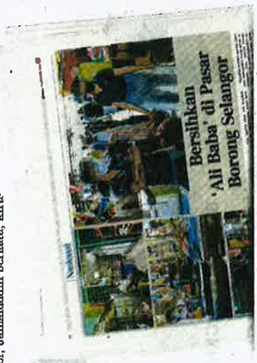
Keratan akhbar BH, semalam.

Sehubungan itu, pengunjug menuntut kerajaan negeri 'membersihkan' pasar berkenaan daripada warga asing, sama seperti dilakukan DBKL terhadap Pasar Borong Kuala Lumpur yang mengambil langkah drastik melarang kehadiran warga asing, sama ada sebagai pekerja atau peniaga, selain memastikan hanya pemilik sah menguruskan perniagaan di situ.