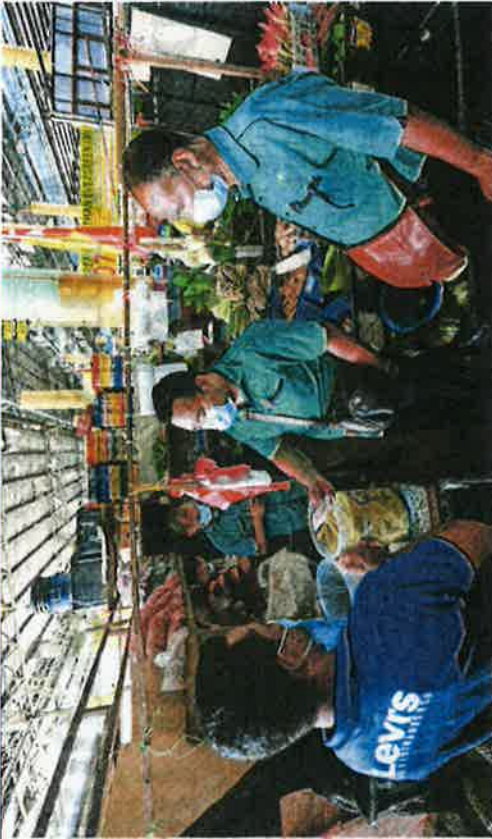
Petugas Operasi Pasar Borong Selangor melakukan pemeriksaan terhadap peniaga warga asing di Pasar Borong Selangor, Seri Kembangan, semalam.

Mengenai kebanjiran etnik Rohingya di Pasar Borong Selangor, Jamaluddin berkata, kira-