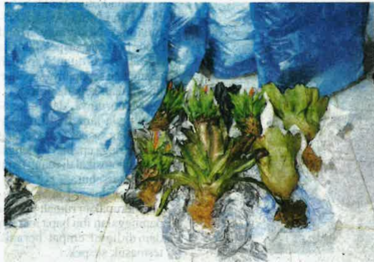
PGA Batalion 9 Kuala Terengganu berjaya mematahkan cubaan menyeludup masuk secara haram anak pokok dari Thailand.

mudian, sebuah bot dari arah Thailand telah menghala ke kawasan tebing sungai di pangkalan haram tersebut,” katanya kepada di sini pada Ahad.