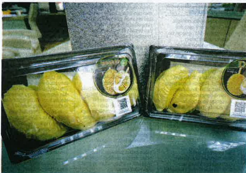
DURIAN D24 antara yang popular dalam kalangan penggemar raja buah itu.