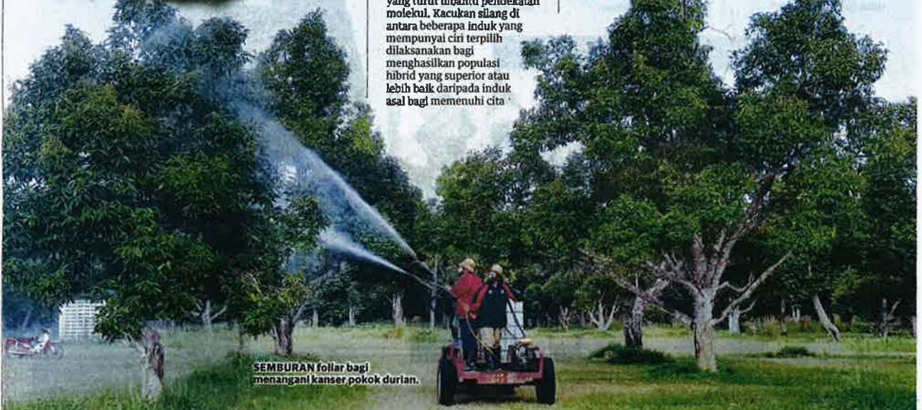
SEMBURAN foliar bagi menangani kanser pokok durian.

Beliau turut mendedahkan, MARDI sedang meneruskan penyelidikan bagi mengeluarkan hibrid baharu durian menerusi kaedah pembalokan konvensional yang turut dibantu pendekatan molekul. Kacukan silang di antara beberapa induk yang mempunyai ciri terpilih dilaksanakan bagi menghasilkan populasi hibrid yang superior atau lebih baik daripada induk asal bagi memenuhi cita