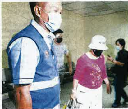
Tertuduh (tengah) hadir ke Mahkamah Sesyen Butterworth ditemani anak lelakinya pada tarikh.

Tertuduh didakwa dengan kejahannya memukul seekor kucing betina baka tempatan berwarna oren dan seekor anak kucing betina baka tempatan berwarna putih kelabu dengan