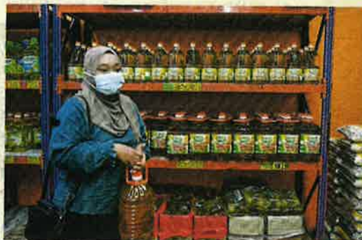
Pelanggan mendapatkan bekalan minyak masak di pasar raya di sekitar Kuala Berang, Terengganu, semalam.

"Sebelum ini, ada pelanggan yang datang ke kedai memberitahu beberapa kedai yang dikunjunginya tiada stok roti kerana ada segelintir individu yang membelinya dalam kuantiti yang banyak," katanya.