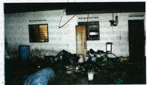
Kejadian berlaku di rumah pusaka peninggalan ibu bapa kepada suspek dan juga abangnya.

"Ketika kejadian, dua beradik lagi tidak berada di rumah kerana bekerja. Kes disiasat mengikut Seksyen 435 Kanun Keseksaan dan Seksyen 511 Kanun Keseksaan," katanya.