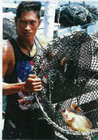
A fisherman showing a mature ocean fish that is ready to be sold at the market.

"This money is even more crucial for us, especially during this pandemic and monsoon season, so we are grateful for the state government's assistance," he said,