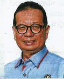
Samsolbari hopes fish breeders can expand their downstream products.

Samsolbari said fishermen should also take the initiative to change from traditional methods and adopt more sustainable and profitable ways of breeding.