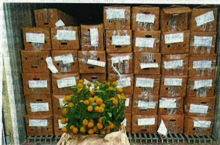
Maqis Selangor merampas 40 pokok limau yang diimport dari China di Pelabuhan Barat Klang Sabtu lalu

Jelasnya, perbuatan mengimport keluaran pertanian tanpa permit yang sah adalah menjadi suatu kesalahan mengikut Seksyen 11(1) Akta Perkhidmatan Kuarantin dan Pemeriksaan Malaysia 2011 [Akta 728] yang boleh dihukum mengikut Seksyen 11(3) Akta yang sama.