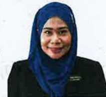
focus on sugarcane.

For example, Gelang Patah will grow chillies while bananas will be planted in Kukup, Kampung Pasir Gudang Baru in Johor Baru will