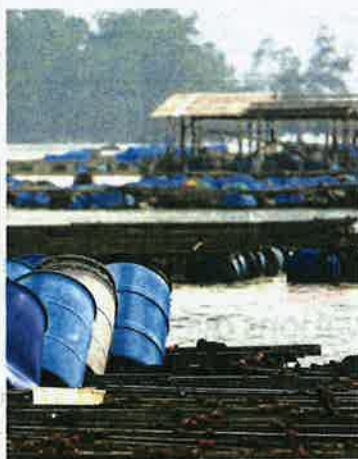
A traditional fish farm near the Kukup Jetty in Pontian, Johor.

Separately, Azli hoped that the state government would allow villagers to transform part of the 10ha land reserve near the village into a housing area for their future generation.