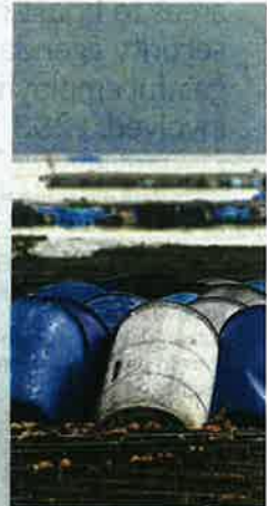
noted that the state government was currently looking for alternative sites to start a mussel farm. "One of the locations identified