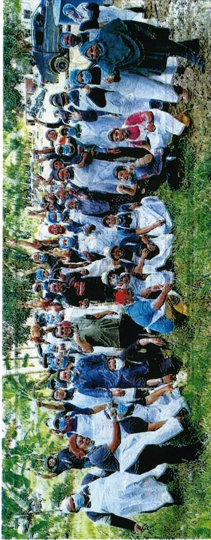
SEBAGIAN peserta bergambar selepas tamat Program Latihan Kemahiran dan Keusahawanan 2020 di Parit, Perak baru-baru ini.