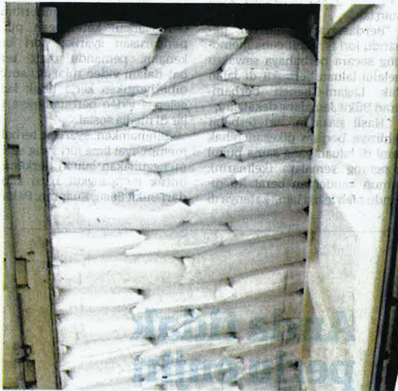
SEBUAH kontena yang sarat dengan guni berisi sekoi dirampas Maqis di NBCT, Butterworth kelmarin.

Sekoi adalah sejenis bijirin yang dikisar untuk dijadikan tepung yang menjadi bahan makanan utama di beberapa negara seperti di India dan juga Afrika Barat. Ia juga boleh dijadikan bubur.