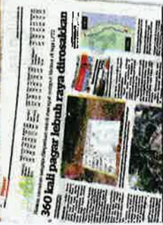
KERATAN Kosmo semalam.