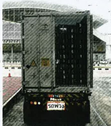
RAMPASAN tomato yang dibuat di Alor Setar.

"Pokok limau itu diletak bersama pokok bunga kering yang mempunyai permit sah bagi mengelirukan kami. Pokok limau itu tiada permit import sah dikeluarkan Maqis selain tiada sijil fitosanitasi dari negara asal. Ia akan dilupuskan mengikut prosedur operasi standard (SOP) ditetapkan," katanya.