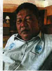
Azli says it is high time traditional fishermen change their ways of gaining income in order to survive.

Azli added that the project was important as it would give the