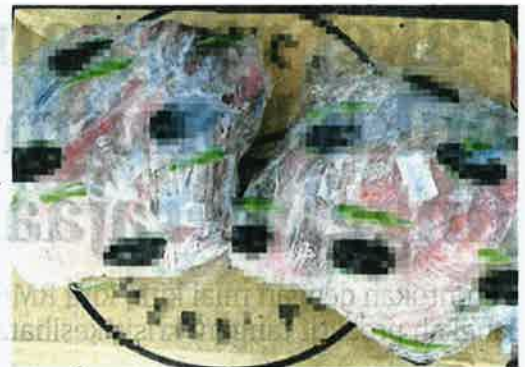
Pek daging kambing tanpa logo halal diiktiraf yang dirampas di Terminal Kontena Butterworth Utara, semalam.

"Kes juga disiasat mengikut kesalahan kerana tiada label dalam pembungkusan bahagian dalam kotak seperti disyaratkan yang mana kesalahan pengimport itu boleh dihukum mengikut Seksyen