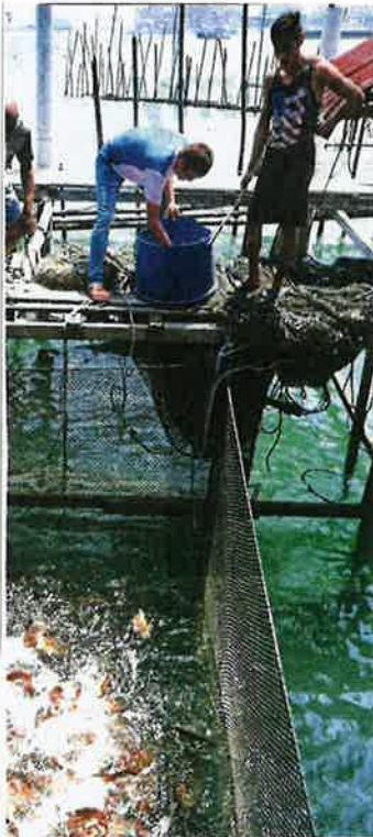
Fishermen feeding fish at a farm in Gelang Patah, Johor.

visit the fishing raft at the mussel farm and fish breeding raft in Teiuk Jawa. "Visitors will be shown how mussels are harvested and fish are caught at the farms.