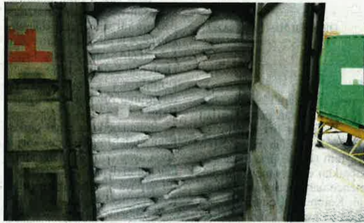
Antara kontena yang dirampas Maqis di NBCT pada Ahad lalu.

"Jika sabit kesalahan boleh didenda tidak melebihi RM100,000 atau dipenjara se-