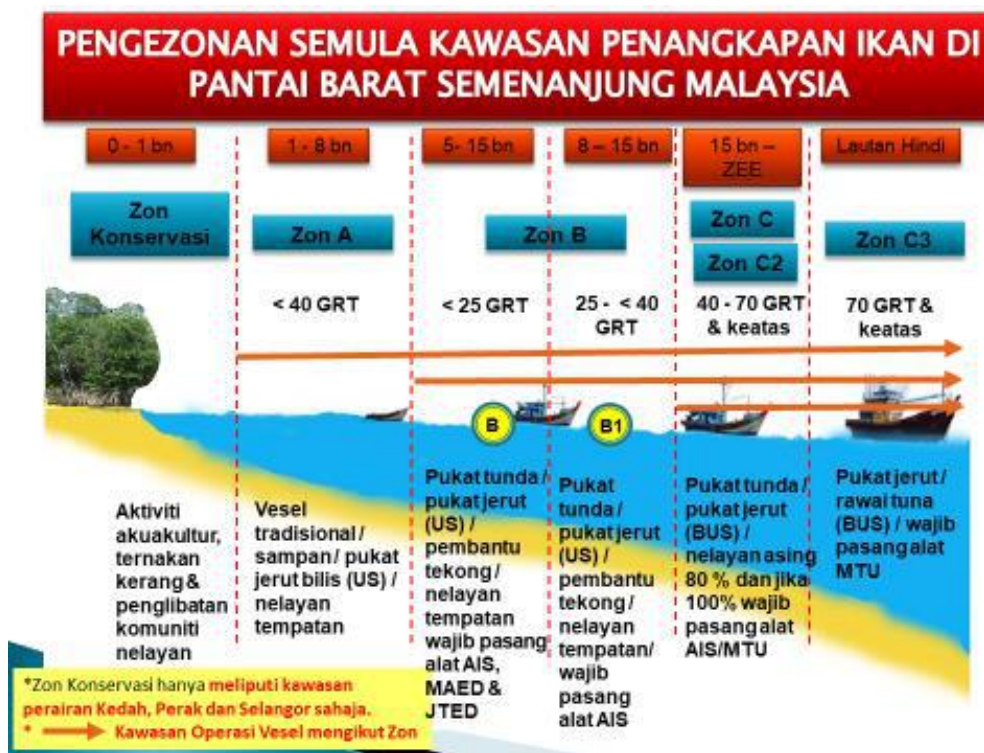
Rajah 1 : Pengezonan semula kawasan menangkap ikan di Pantai Barat Semenanjung.