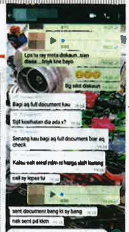
The WhatsApp messages between an agent and government officer as revealed by a source to NST.

Investigations by the MACC on the meat cartel case recently gathered pace with the arrests of 11 people so far, including five Malaysian Quarantine and Inspection Services Department (Maqis) officers, a delivery agent, and the directors and employees of two importing companies.