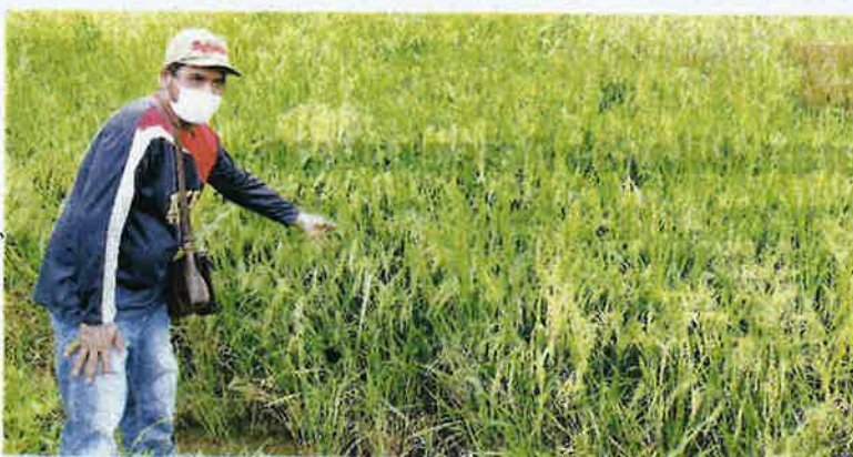
MASALAH pengairan menyebabkan sesetengah bendang sawah di Negeri Sembilan tidak dapat dimajukan.

"Untuk tanaman padi ini memang keperluan utamanya adalah air bagi pengairan sawah, jika tiada air memang mustahil untuk menanamnya. Di negeri ini padi masih banyak ditanam di daerah Kuala Pilah namun ada juga tanah bendang yang