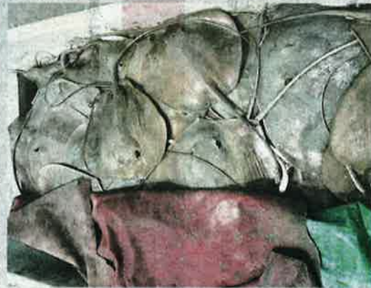
IKAN pari yang terdampar nebyan.

"Seperti yang tular di media sosial pada 29 Januari lalu, nelayan tradisi yang berpangkalan di Jeti Sungai Kajang di sini dilaporkan berjaya menangkap sekawan ikan pari menggunakan pukat yang