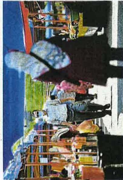
SERANYAK 22 daripada 48 pasar tani di Selangor dibenarkan beroperasi mengikut SOP yang ditetapkan.