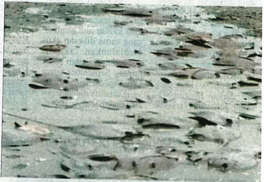
Ikan pari yang terdampar di Pantai Sungai Kajang yang tular di Facebook sejak Sabtu.

Sementara itu, Jabatan Perikanan Selangor mengesahkan menerima laporan berhubung sejumlah ikan pari didaratkan