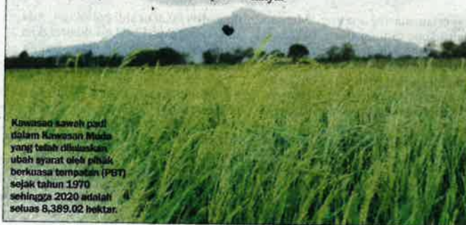
Kawasan sawah padi dalam Kawasan Muda yang telah diluluskan ubah syarat oleh pihak berkuasa tempatan (PBT) sejak tahun 1970 sehingga 2020 adalah seluas 8,389.02 hektar.