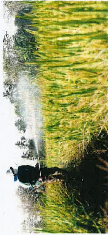
Hasil tanaman padi yang kurang menguntungkan menyebabkan petani lebih cenderung menjual tanah kepada pihak yang memberi tawaran tinggi. (Foto biasan)

Lama sudah tidak ke bendang, Habib padi dililit kangkung.