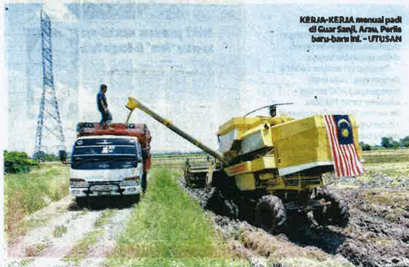
KERIA-KERIA menuai padi di Guar Sany, Arau, Perlis baru-baru ini.

"Kita mendapati kemerosotan hasil padi dianggarkan 1,000 tan metrik setahun dan perkara itu