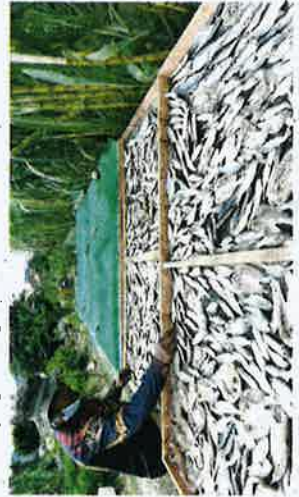
Muhammad Nizar memanjakan ikan tradisional, Khairul Nizam mampu menghasilkan 80 sehingga 100 kilogram ikan masin dalam tempoh sehari.

Selangor sejak setahun lalu setelah negara dilanda pandemik Covid-19 sehingga dikenakan Perintah Kawalan Pergerakan (PKP).