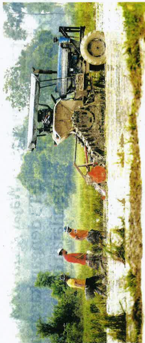
PENDUDUK Kampung BarohMas di Kuala Nearing memajak tanah untuk memulakan musim pentanaman padi di Kedah.