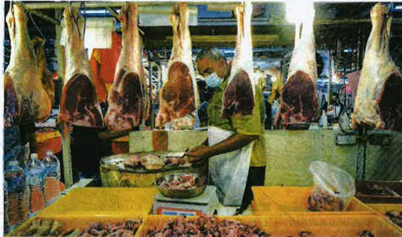
DARI segi integriti garis panduan, standard, manual dan protokol industri Halal Malaysia, semuanya sudah lengkap.

Langkah pertama yang dicetuskan oleh mereka ialah menaik taraf garis panduan halal ke tahap standard. Melalui kerjasama erat dengan pihak industri pada