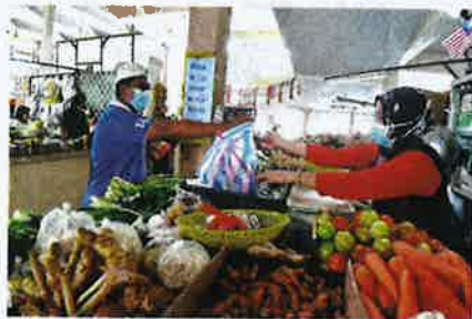
Harga sayuran di Pasar Bandar Marang masih stabil.

"Begitu juga dengan kubis Beijing terpaksa dijual RM6 sekilogram berbanding RM5 sebelum ini dan kenaikan ini