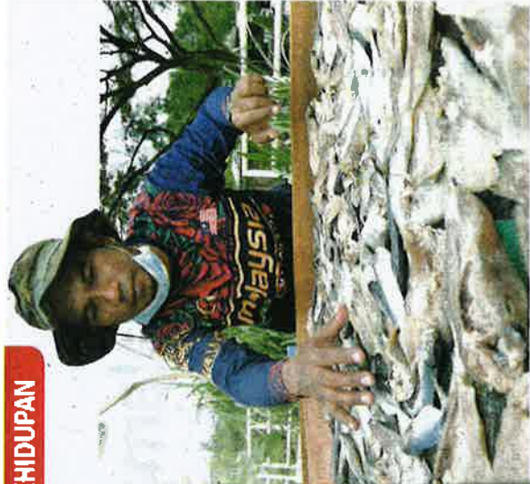
Aspek laburannya sangat ditibarkan sepanjang proses pembuatan ikan masin supaya tahun lebih lama.