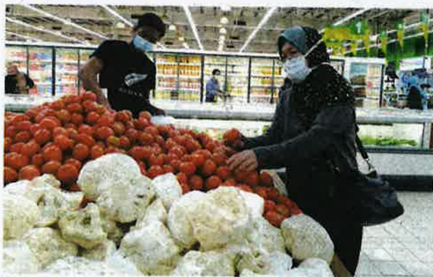
Harga tomato dijual RM7.99 sekilogram di sebuah pasar raya di Batu Caves pada Selasa.

jual sehingga RM6 sekilogram berbanding RM4 harga biasa. Apabila harga borong mahal, peniaga terpaksa jual mahal juga. Biasanya kami ambil untung RM2 bagi sekilogram," katanya.