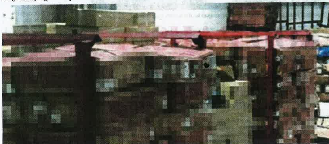
TIGA kontena daging lembu yang status halalnya diragukan yang dirampas di sebuah gudang di Puchong.

"Maqis komited dalam memastikan isu membabitkan aspek halal, keselamatan makanan, kawalan penyakit dan risiko kemasukan perosak merbahaya yang boleh mengancam industri pertanian dan peternakan negara," katanya.