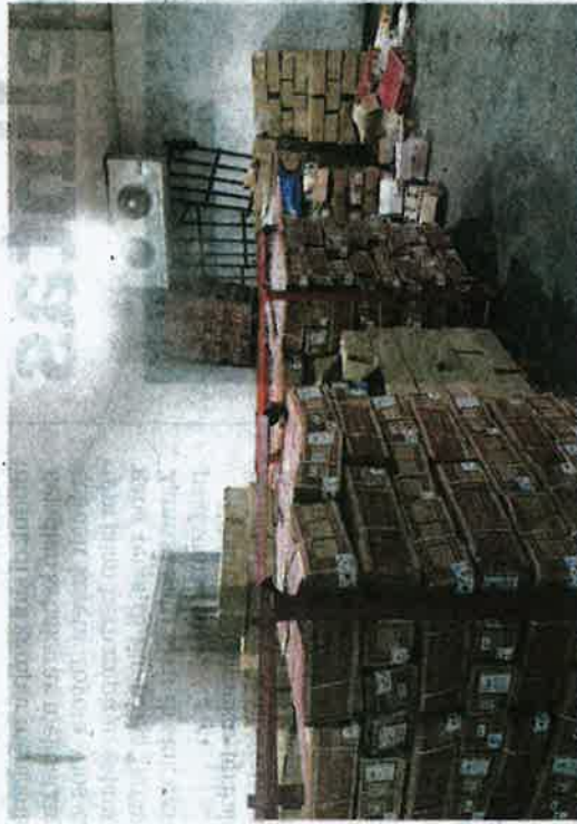
GUDANG sejuk beku yang diserbu selepas selepas disyaki mencampuradukkan bekalan daging yang tidak diiktiraf di Puchong, Khamis lalu.

Ketika ditanya jumlah dan anggaran nilai rampasan, Maqis berkata, pihaknya masih menjalankan siasatan dan akan mengeluarkan kenyataan dalam