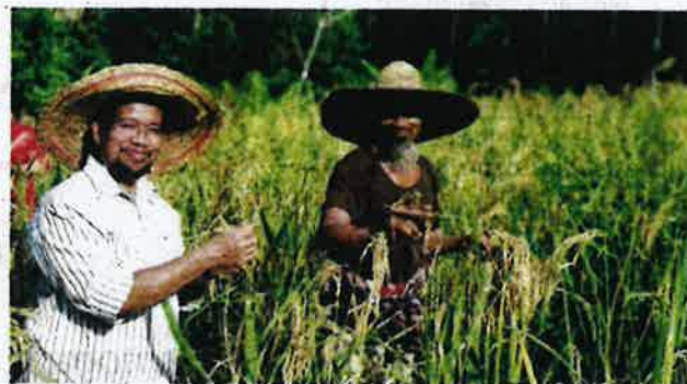
Pengerusi MADA semasa lawatan ke sawah padi sebelum ini.

Program berkenaan tambah beliau mensasarkan penglibatan usahawan