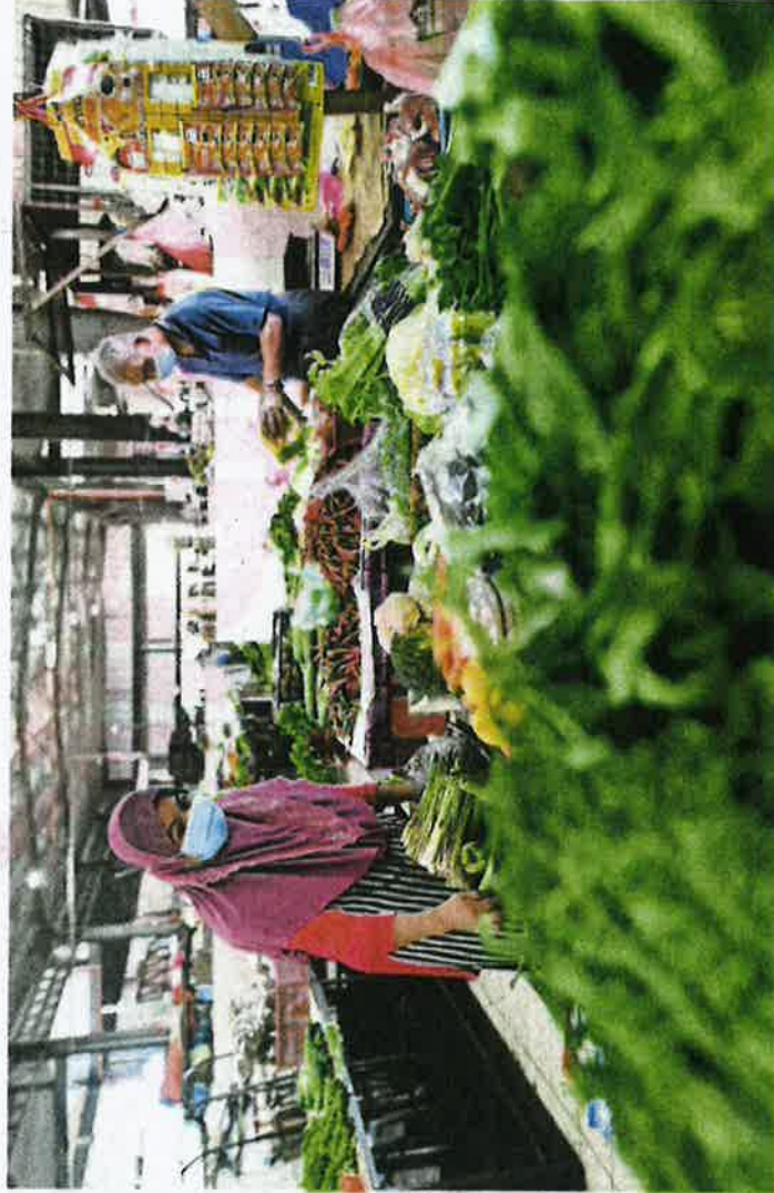
Peniaga di Pasar Chabang Tiga, Kuala Terengganu menaikkan harga sayuran akibat kesukaran mendapatkan bekalan berikutnya.

"Saya pernah beli cili padi merah pada harga RM29 sekilogram. Sayuran hijau lain memang mengalami kenaikan harga sejak tiga hari lalu seperti kailan dan sawi jepun antara RM8 hingga RM10 sekilogram, berbanding sebelum ini RM4, tetapi cili padi merah memang terlalu mahal, bila kita tanya kenapa jual mahal, pemborong cakap sebab PKP" katanya ketika ditemui semalam.