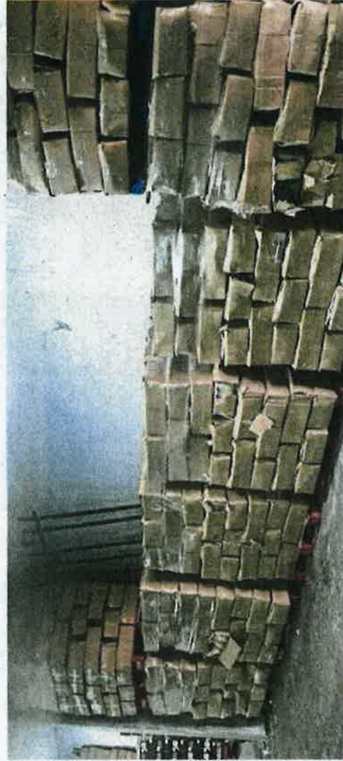
Serbuhan menemui produk sejuk beku dipercayai diseludup dalam gudang di Puchong, Jumaat lalu.

"Jika sabit kesalahan boleh didenda tidak melebihi RM100,000 atau penjara tidak melebihi enam tahun atau kedua-duanya