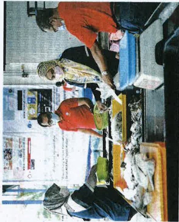
PELANGGAN boleh mendapat pelbagai hasil laut dengan harga berpepatan di Pusat Pengumpulan dan Pengedaran Nelayan di Taman Wahyu, Kuala Lumpur.

kepada pelbagai peringkat orang-orang. Kita boleh ambil contoh, orang tengah atau pemborong ikan di Johor ambil ikan melalui nelayan di sana.