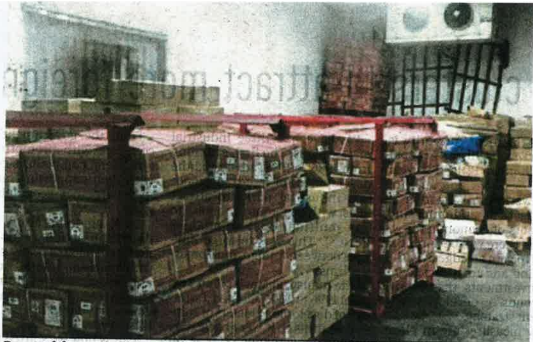
Boxes of frozen beef in a Puchong cold storage factory yesterday.