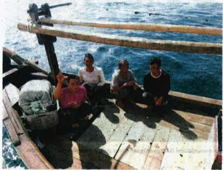
Empat nelayan asing dari Indonesia ditahan untuk siasatan lanjut.

ikut Seksyen 6(1)(a) Akta Imigresen 1959/63 kerana memasuki Malaysia tanpa permit masuk yang sah dan Seksyen 6(1)(c) kerana memasuki Malaysia tanpa memiliki dokumen yang sah,” katanya.