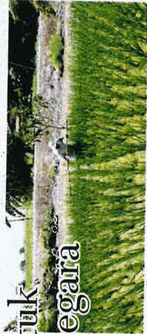
Tanah bendang murah menjadi rebutan kontraktor untuk menjalankan projek perumahan di negeri Kedah.

Ditambah pula perkembangan pesat kawasan Alor Setar dan bandar-bandar baharu yang tumbuh berdekatan dengan