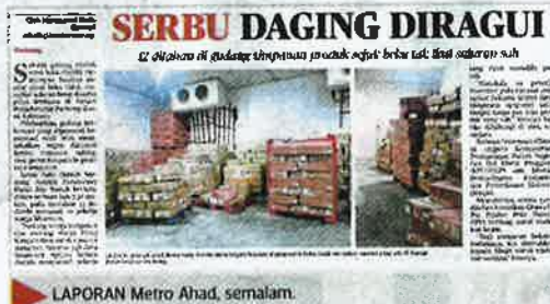
LAPORAN Metro Ahad, semalam.

kebenaran kerajaan dibenarkan membawa masuk daging sejuk beku ke negara ini.