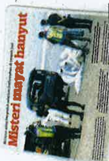
KERATAN Kosmo! semalam.

Selain bot, nelayan asing mempunyai peralatan serta pukuk yang jauh lebih baik berbanding nelayan tempatan. "Tkan-ikan bergred A kebiasaannya akan diperolehi ketika musim tengkujuh, namun tempatan tidak dapat ke-