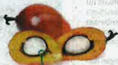
Palm kernel shell

Bentuk tempurung kelapa sawit sebelum diproses menjadi serbuk untuk dijadikan bahan dalam penghasilan makanan ruminan.