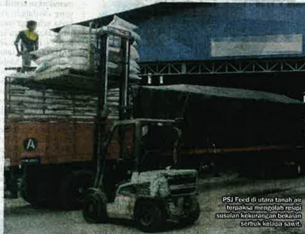
PSJ Feed di utara tanah air terpaksa mengolah resipi susulan kekurangan bekalan serbuk kelapa sawit.