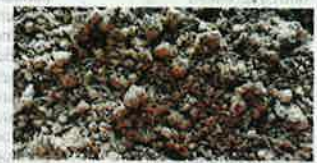
Serbuk kelapa sawit yang digunakan dalam penghasilan makanan ternakan.

• Maklumat daripada pengeluar harga makanan ruminan kepada Sinar Harian