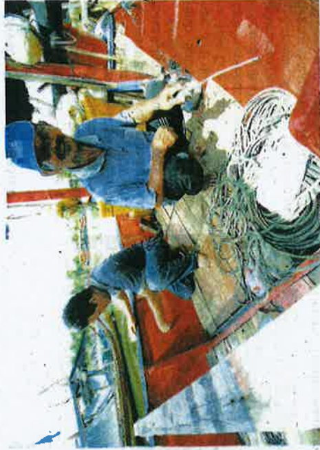
DUA nelayan melakukan kerja-kerja baik pulih bot di jeli pangkalan Kuala Kemasin, Bachok.

Katanya, dia tidak boleh mengikut tekong untuk menangkap ikan kerana keadaan laut masih bergelora meskipun cuaca