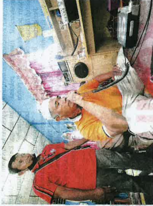
HAZAHAR (duduk) menggunakan Radio Nelayan Kelantan semasa bertubuh dengan nelayan-nelayan di laut baru-baru ini.

"Sekiranya bot nelayan tempatan karam atau ada awak-awak yang jatuh ke laut, tekong pastinya akan memaklumkan kejadian melalui jalur radio. Kami kemudian akan segera maklumkan kepada pihak berkuasa," katanya ketika ditemui Kosmo! baru-baru ini.