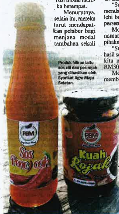
Produk hiliran iaitu sos cili dan pes rojak yang dihasilkan oleh Syarikat Agro Maju Selatan.

Menurutnya, selain itu, mereka turut mendapatkan petalabur bagi menjaga modal tambahan sekali