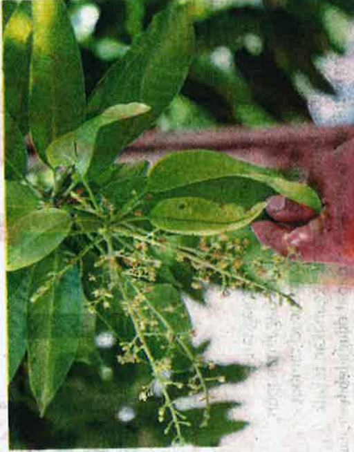
Fenomena cuaca panas dan kering di Perlis menyebabkan bunga pokok Harumanis kering dan gugur.

Ramai lagi pengusaha tanaman Harumanis di negeri ini kurang berhasrat baik apabila terpaksa membelanjakan banyak wang untuk membeli baja pokok, racun pemusnah serangga dan kos menyiram pokok.