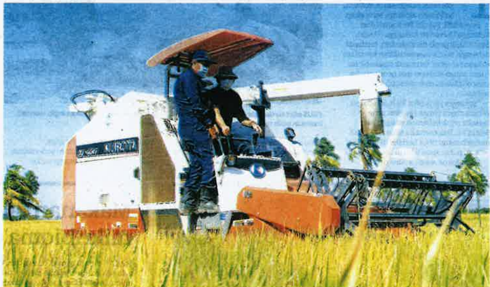
SELARI dengan penggunaan teknologi moden dalam pertanian, mentaliti pesawah juga perlu bertukar ke arah dunia digital bagi meningkatkan hasil penanaman padi. - GAMBAR HIASAN