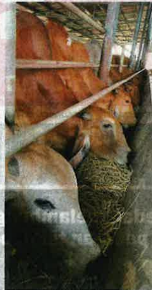
Penternak lembu meramalkan harga daging segar meningkat antara RM35 hingga RM40 sekilogram berbanding harga semasa RM28 hingga RM30 sekilogram.

"Dulu harga satu beg dedak seberat 50kg kira-kira RM53, kini dedak untuk kambing mencecah RM60 hingga