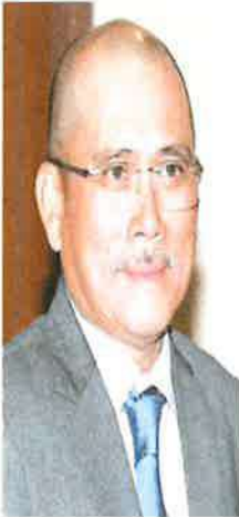
Datuk Seri Dr Ronald Kiangde

PUTRAJAYA: The Malaysian Quarantine and Inspection Services (MAQIS) now have access to the port system to conduct detailed inspections on any refrigerated container.