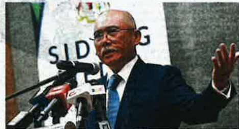
Win-win situation: "We are proud to report that one of the ministry's biggest achievements is to sustain the food equilibrium to ensure the people are fed and farmers earn an income," says Kiang.

"We are inviting those in the industry to facilitate us and explore the potential of this venture in waters off the west coast of Sabah in the South China Sea," he said.