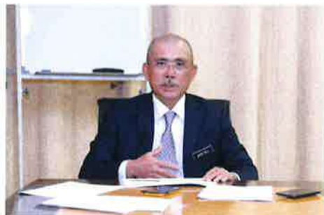
Datuk Seri Dr Ronald Kiandee

It has strengthened the agriculture sector and food industry to make sure that agriculture, fisheries and livestock products are not affected during this difficult time so that food supply is always sufficient for all Malaysians.