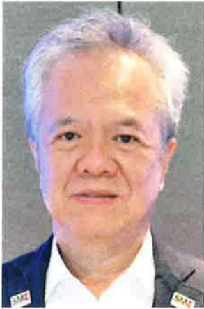
— Foo Ngee Kee Sabah Small and Medium Enterprises President

The microcredit financing scheme is a good initiative that helps local businesses, especially those operating on a small scale.