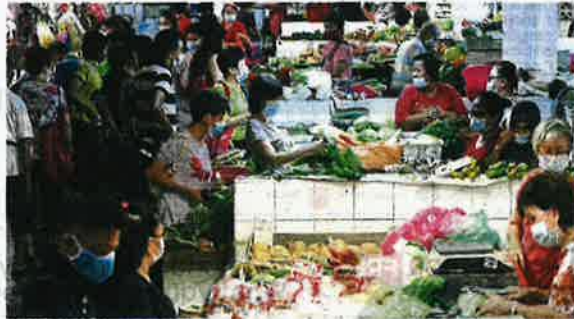
Steady supply: The ministry wants to ensure there will be no shortage of food supplies such as fish, vegetables, chicken and eggs.