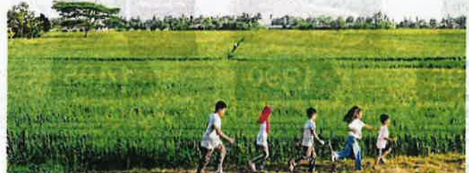
SKIM Insurans Pertanian atau Agromakanan dapat beri perlindungan terutama ketika ditimpa musibah.

"Selain itu, tahun ini juga kita akan melancarkan Pelan Pembangunan Perikanan Negara dan Pelan Strategik Pembangunan Industri Tuna untuk tempoh 10 tahun serta Skim Pembiayaan Agropreneur Muda (Agro-YES)," katanya.