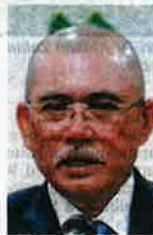
Datuk Seri Dr Ronald Khandee

"The implementation of Smart SBB will see changes to the padi and rice industry landscape as the government's goal is in guaranteeing food security at all times."