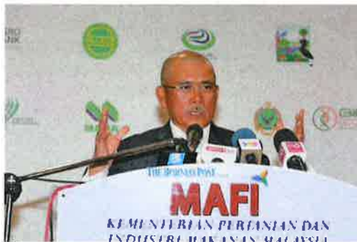
Kiandee speaks during a function at his ministry's office on Wednesday.

PUTRAJAYA: The Ministry of Agriculture and Food Industry (Mafi) has tasked Agrobank to spearhead efforts to formulate an insurance scheme for the agriculture and agro-food industry, to alleviate the burden of farmers and those in the livestock business affected by natural disasters.