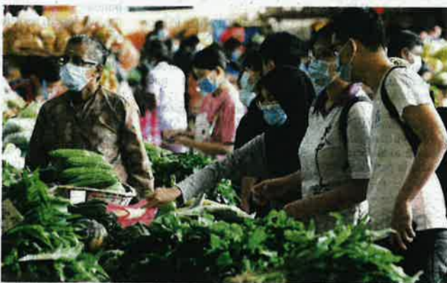
MAFI pastikan bekalan makanan untuk rakyat Malaysia mencukupi dan stabil.