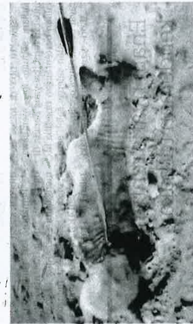
KEADAHAN seekor anjing liar yang mati selepas dipanah seorang lelaki di Alor Setar pada Khamis lalu.