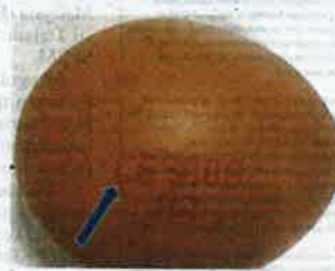
Telur berocap CES 008 yang dikesan mengandungi bakteria SE.

ngapura termasuk bekalan untuk pasaran tempatan.