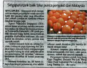
Keratan Sinar Harian pada Ahad.

Tegasnya, penggantungan CES 008 ke Singapura tidak akan menjejaskan pengeksportan lain-lain ladang ke Si-