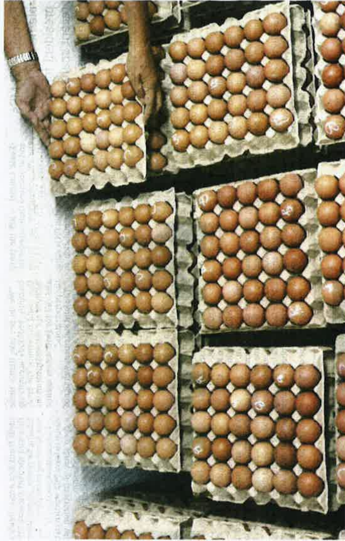
An investigation into the source of the Salmonella enteritidis bacteria in eggs is underway.

tests for cloacae, animal feed, drinking water and eggs were also conducted.