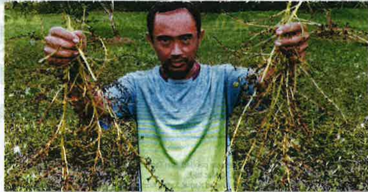
SEORANG pengusaha merunjukkan antara bunga harumanis yang rosak di kebunnya di Simpang Empat, Arau, Perlis.

Namun, ramai yang tidak tahu proses penjagaan dan penyelenggaraan pokok harumanis sebenarnya bukan mudah selain menelan kos cukup