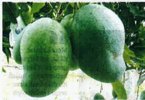
BUAH memelam harumanis yang merunggu masa untuk dituai di sebuah kebun di Kangar, Perlis.

ada kencing manis tidak sesuai makan dalam kuantiti yang banyak, sekitar dua hirisan sahaja sekali makan.