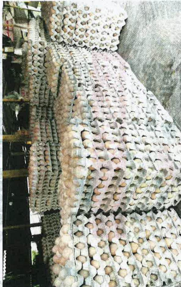
PENEMUAN bakteria SE dalam telur di Singapura dikhuatiri akan menyebabkan cirit-birit, sakit perut, demam dan muntah. – GAMBAR HIASAN

"Pihak syarikat memaklum-kan bahawa 100 peratus telur