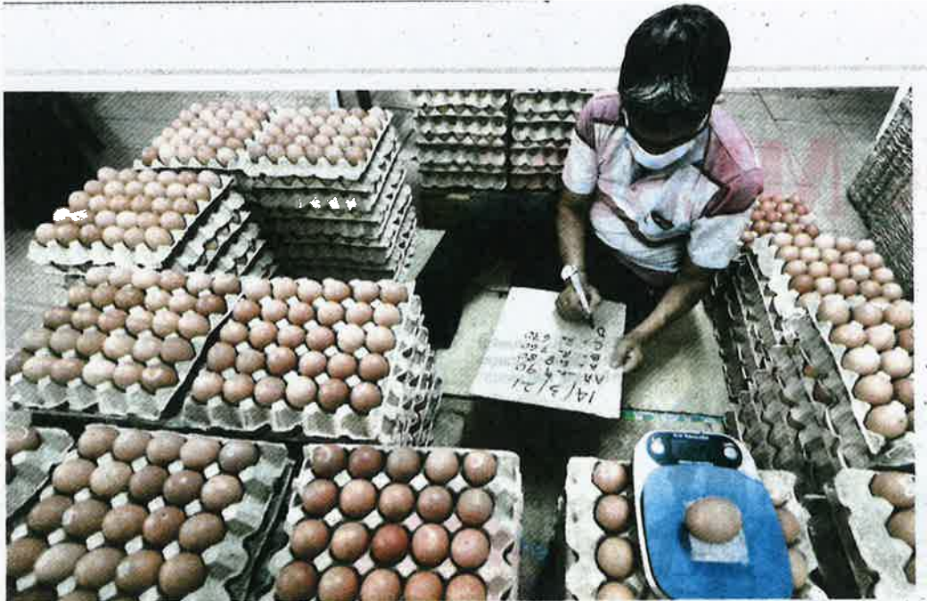
PEKERJA pembekal telur di Kuala Lumpur memeriksa bekalan telur yang baru sampai dari Pahang. Menurutnya, tiada isu kenaikan harga telur kerana bekalan yang ada berlebihan dan harga turun mendadak menyebabkan pembekal menanggung kerugian.