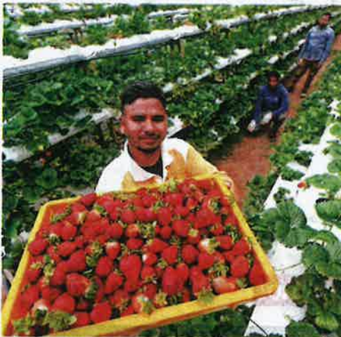
PEKERJA ladang di Tanah Rata, Cameron Highland, Pahang menunjukkan buah strawberi yang dikeluarkan di kawasan berkenaan.