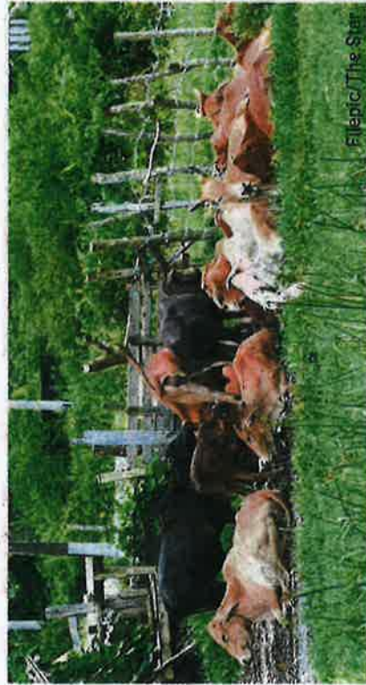
Electric The Star

One major contributing factor to past failures in the beef and dairy sector, as discussed in various analyses, is poor management. We are not short of good ideas when it