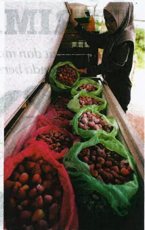
SEORANG pekerja melihat strawberi sejuk beku yang penuh dalam peti simpanan dingin di Tanah Rata, Cameron Highlands, Pahang.

"Anggaran itu membabitkan harga RM15,000 satu tan metrik pada ketika ini, secara kebiasaannya kami jual antara RM20,000 ke RM30,000 satu tan metrik," katanya.