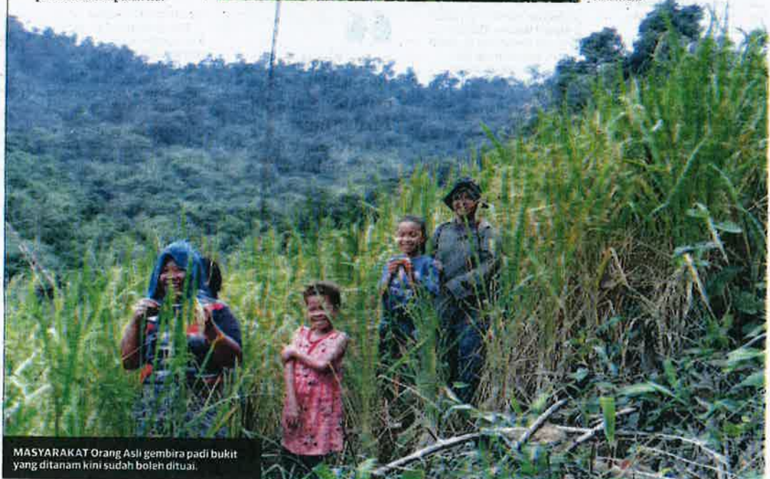
MASYARAKAT Orang Asli gembira padi bukit yang ditanam kini sudah boleh dituai.

SEORANG wanita Orang Asli menumbuk padi bukit yang dituai di Pos Bihai, Gua Musang, Kelantan.