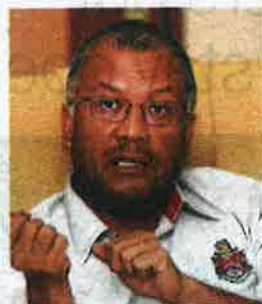
Khairul: It is not easy to change the mindset of the homeless.