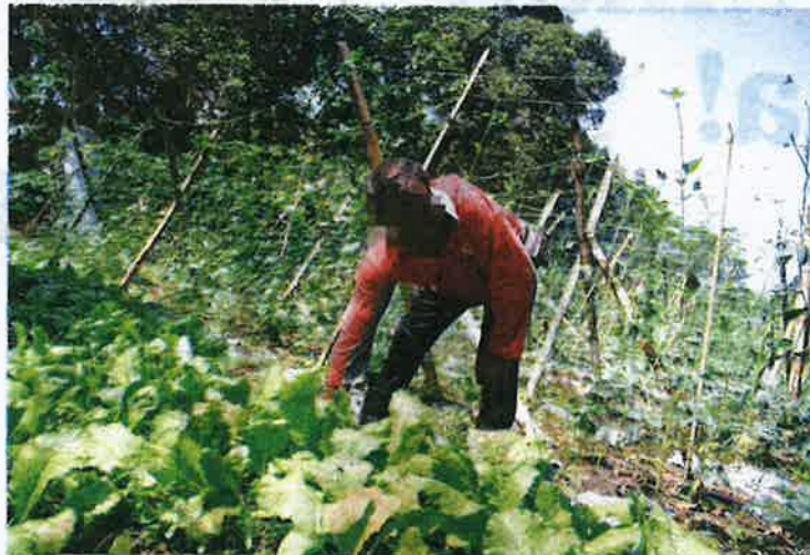
SEORANG warga asing mengusahakan kebun sayur di Balik Pulau, Pulau Pinang.

Tambahnya, dia mula mengusahakan tanah kebun milik penduduk tempatan di Balik