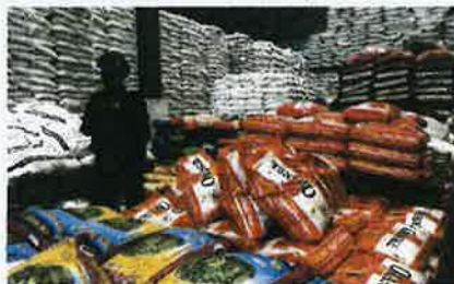
PELBAGAI jenama beras tidak bercukai yang dirampas.

Beliau berkata, hasil pemeriksaan di dalam stor, pihaknya menemui 13 tan beras yang dianggarkan