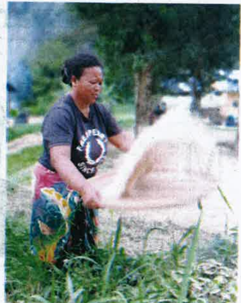
SEORANG wanita Orang Asli menampi padi bukit.

Oleh AIMUNI TUAN LAH gayautusan@mediamulla.com.my