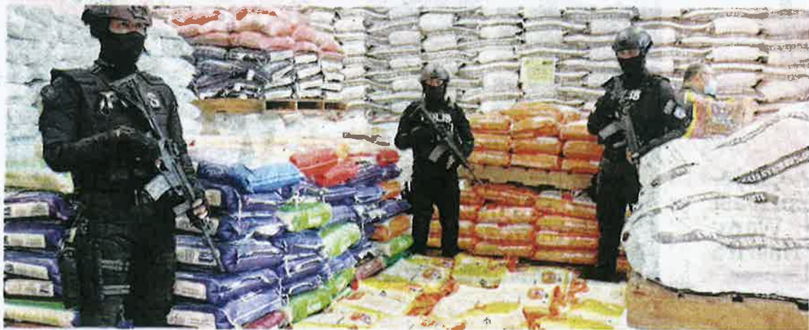
SEBAHAGIAN beras dari India yang dirampas dalam Ops Kontraban di sebuah premis di Jalan Telok Gadong, Klang kelmarin.

Kes tersebut disiasat di bawah Seksyen 20 Akta Kawal Selia Padi dan Beras 1994 (Akta 552) dan jika sabit kesalahan boleh dikenakan denda sebanyak RM25,000 dan semua barangan dirampas.