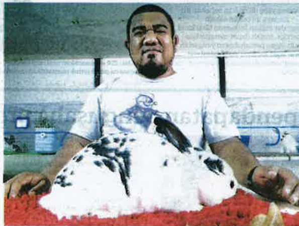
KHUWARIZMI bersama arnab betina New Zealand Broken Black seberat lima kilogram yang diternak di dalam sangkar tertutup di Kampung Gong Kedak, Pasir Puteh, Kelantan.

Antarabangsa Kuala Lumpur sebelum menginap di hotel haiwan. Sehingga kini saya telah membelanjakan sebanyak RM30,000 untuk membeli arnab selain membina sangkar halwan," ujarnya.