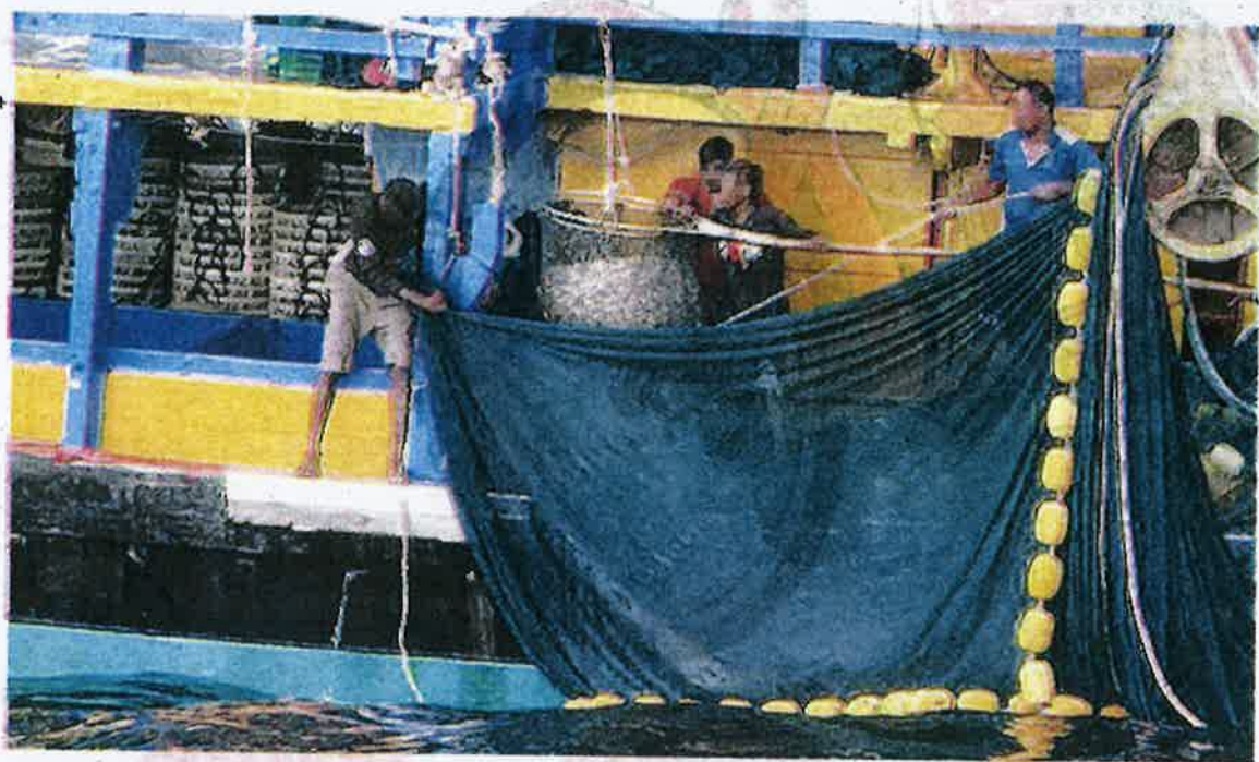
SEBAHAGIAN daripada 13 nelayan sedang menaikkan ikan menggunakan pukak jerut sebelum diberkas di Pulau Pangkor Jumaat lalu.