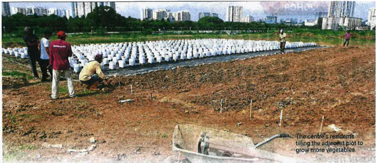
The centre's residents tilling the adjacent plot to grow more vegetables.