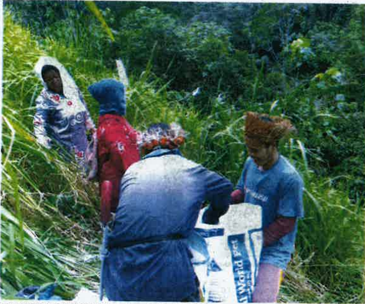
PENANAMAN padi bukit diusahakan masyarakat Orang Asli sejak turun-temurun untuk menampung bekalan makanan mereka. Hasil tuai mampu menampung keperluan keluarga sehingga tempoh setahun.