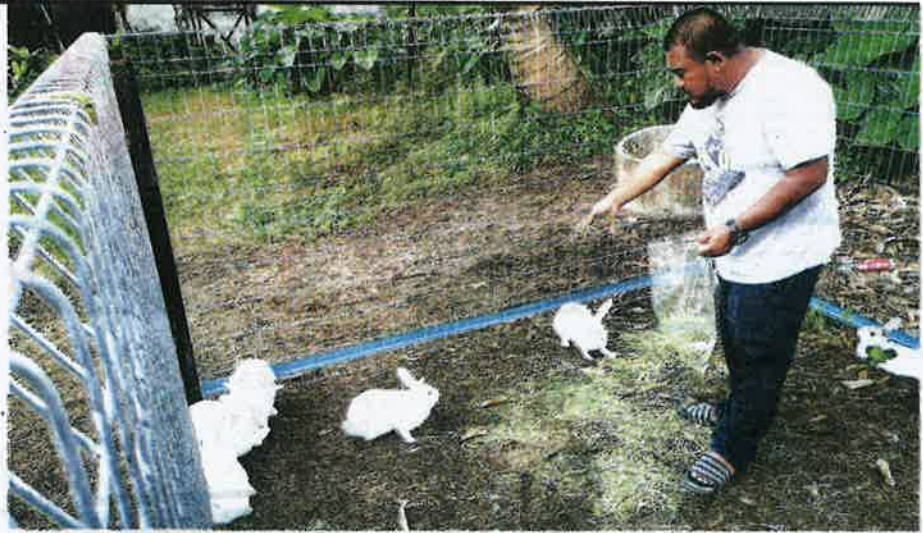
ARNAB betina kakukan tempatan dilepaskan seketika di dalam sangkar terbuka sebelum diberi peluang mengawan dengan baka pejantan yang diimport.

"Arnab baka Mat Salleh yang berasal dari California akan diterbangkan dari Los Angeles terus ke Lapangan Terbang