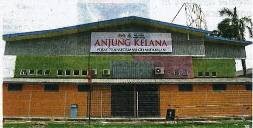
The Anjung Kelana transit centre, which was set up at the end of February, is the brainchild of the FT minister.

Rashdan, who is also president of Lestari Alam Malaysia which is an association pro-