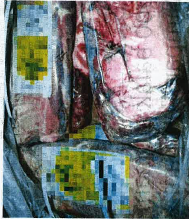
Sebahagian daging sejuk beku dari India bernilai lebih RM600,000 yang dirampas MAQJS Pulau Pinang di NBCT, Butterworth.

Belian berkata, pihaknya menahan tiga lori dan hasil pemeriksaan dua jam menemui beku bernilai RM36,060; 1,710kg pelbagai jenis sosis dianggarkan bernilai RM7,695 dan 2,106kg pelbagai sayur-sayuran serta buah-buahan yang berjumlah RM3,274.