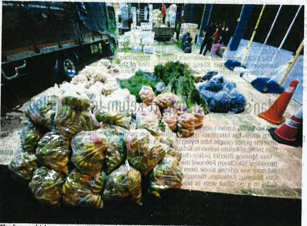
The frozen chicken, sausages, vegetables and fruits seized by the Malaysian Quarantine and Inspection Services Department (Maqis) at the Immigration, Customs, Quarantine and Security Complex in Rantau Panjang on Wednesday.

"Three of the lorries were found with frozen chicken and sausages that had no import permits.