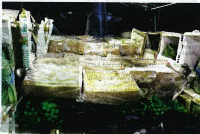
Maqis Kelantan menggagalkan cubaan menyeludup ayam sejuk beku bernilai RM36,060 dalam Operasi Pematuhan Import dan Eksport Keluaran Pertanian di Kompleks ICQS pada Khamis.

"Langkah ini juga bagi menjamin keselamatan keluaran pertanian yang diimport atau dieksport mematuhi syarat serta peraturan ditetapkan oleh kerajaan," katanya.