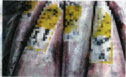
Kesemua daging kerbau dirampas untuk keselamatan selanjutnya.

"Hasil pemeriksaan mendapati bahawa pihak pengimport membawa 1,400 kg (1.4 tan) ikan basah yang diikrar