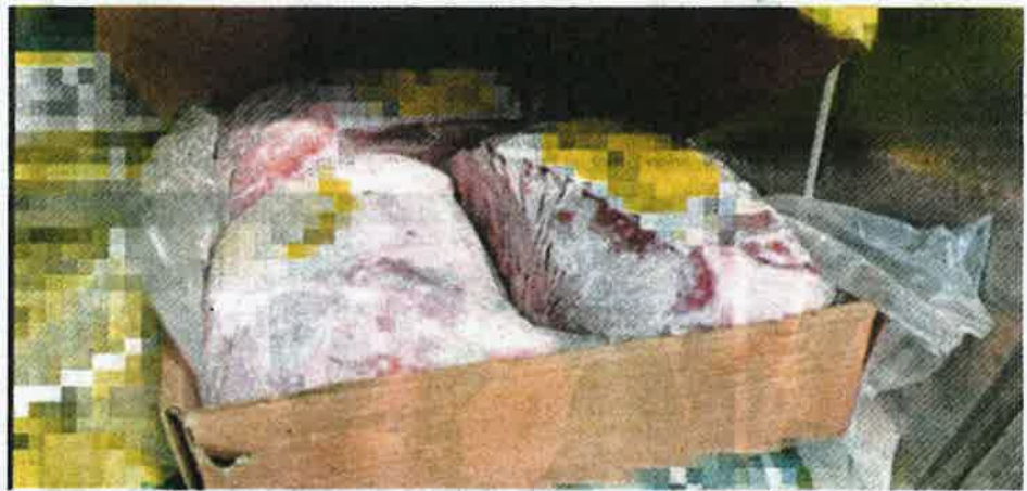
Daging import dari India yang dirampas di Terminal Kontena Utara Butterworth.

"Kegagalan mematuhi syarat ditetapkan pada permit import MAQIS adalah kesalahan mengikut Seksyen 15(1), Akta Perkhid-