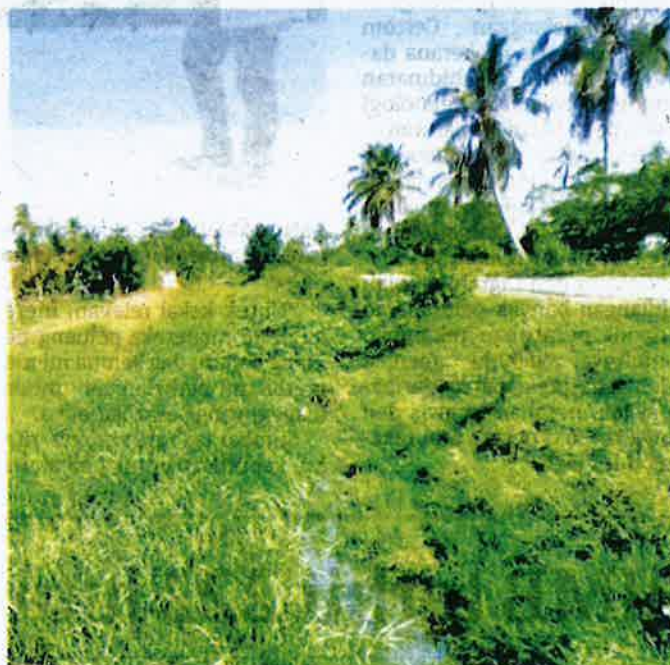
TALIAN air yang semak samun di Kampung Matang Mahang, Kerpan, Jerlun.

"Saya sangat berharap MADA dapat mengatasi masalah ini secepat mungkin terutama daripada segi infrastruktur saliran dan pengairan untuk memudahkan petani mengikut jadual penanaman ditetapkan," katanya.