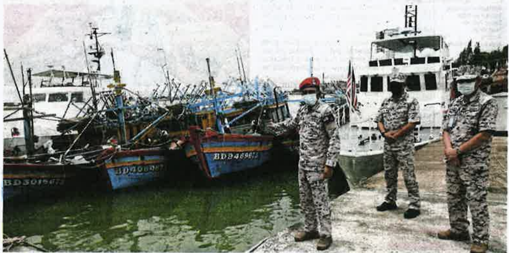
Sebahagian bot nelayan Vietnam yang dirampas Agensi Penguatkuasaan Maritim Malaysia di perairan Terengganu, minggu lalu.