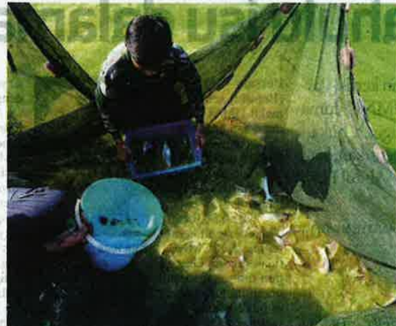
Salah seorang anak peneroka Felda memetik ikan tilapia.

"Berbeza dengan pelaksanaan konsep projek peneroka, program bersama Agrobank ini kita ada senarai operator yang akan bekerjasama dengan kita.