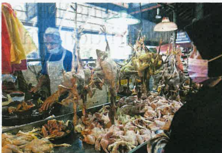
Tinjauan harga ayam di Pasar Chabang Tiga, Kuala Terengganu didapati naik secara mendadak sejak hari pertama Ramadan.

Di Johor Bahru, tinjauan di pasar basah di Skudai mendapati harga ayam segar antara RM6 hingga RM8 sekilogram dengan sekor ayam proses saiz sederhana dijual purata RM19 sekilogram. Ia berbeza dengan harga pada awal Ramadan, iaitu RM3.50 sekilogram dengan sekor ayam segar sederhana an-