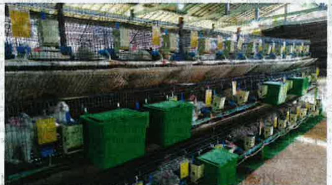
Melalui PPP, peneroka mengusahakan tanaman kontan dan penternakan seperti amab.

"Operator ini adalah pihak industri dari luar yang telah mahir atau diiktiraf dalam bidang mereka sendiri. Contohnya kalau nanas MD2 kita akan ada kerjasama dengan syarikat pengeluar nanas varieti itu yang terbaik iaitu Syarikat Aqina.