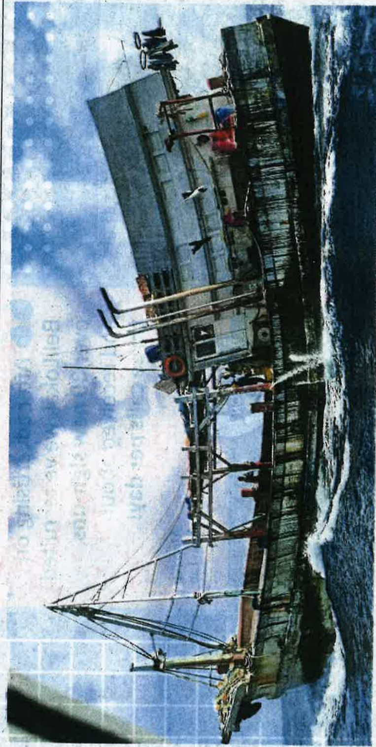
Caught: The Vietnamese boat as the MMEA pulls alongside to intercept it in Kudat waters.