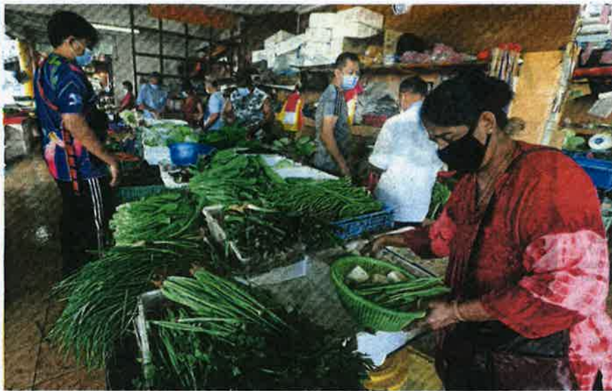
PEMBELI terpaksa mengawal perbelanjaan dengan menghadkan pembelian sayur-sayuran.

Oleh Nurul Hidayah Bahaudin nurul.hidayah@hmetro.com.my