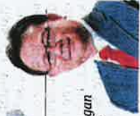
Alexander Nanta Linggi, Menteri Perdagangan Dalam Negeri dan Hal Ehwal Pengguna

kementerian dan agensi lain serta pemain industri