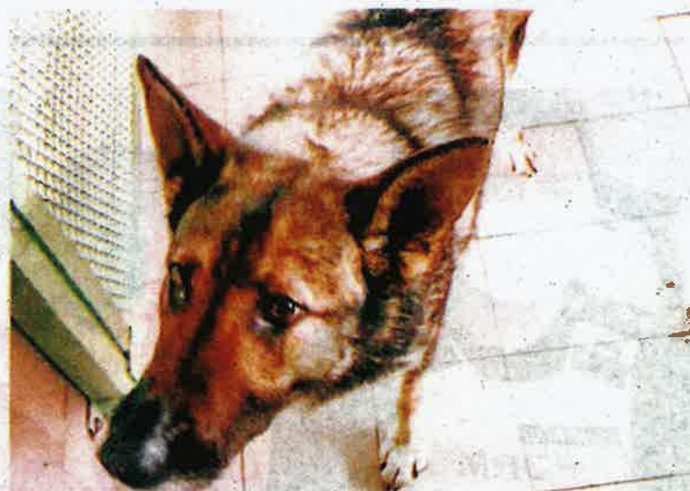
ANJING baka Jerman Shepherd yang ditahan kargo KLIA, Sepang Jumaat lalu.

Jelas beliau, Maqis sentiasa teliti dalam melakukan pemeriksaan bagi setiap komoditi haiwan, tumbuhan serta karkas sama ada yang diimport atau dieksport bagi mengawal dan menjaga biosekuriti dan kawalan penyakit serta keselamatan makanan di dalam negara kita.