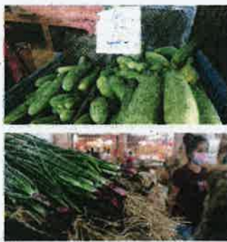
ANTARA barangan yang menjadi mahal sejak awal April.

ga menghadkan pembelian sayur berkenaan dari satu kilogram kepada setengah kilogram," katanya.